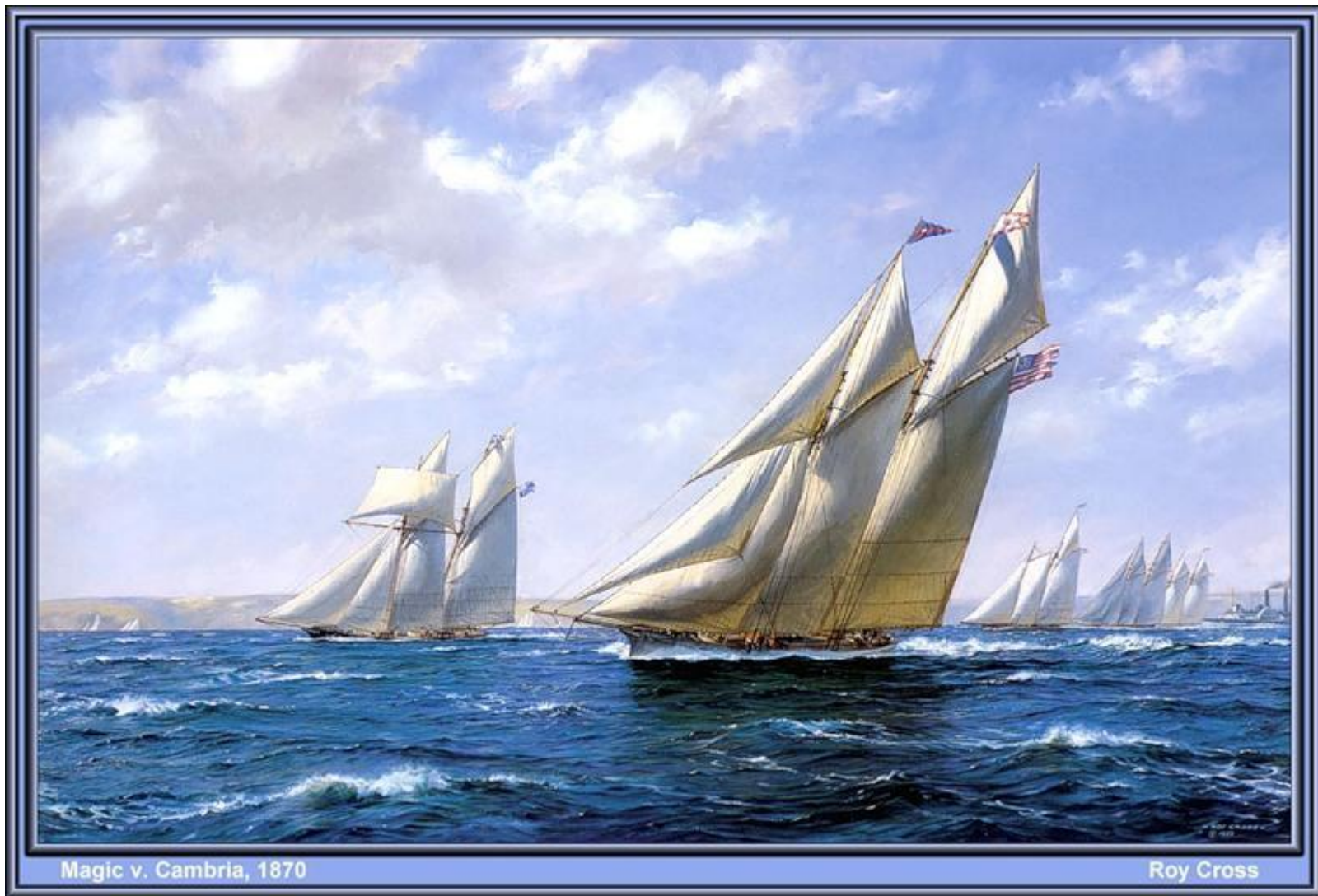
Magic v. Cambria, 1870