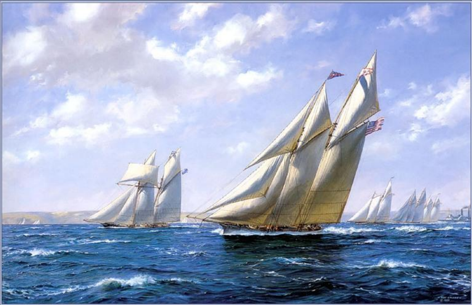
Magic v. Cambria, 1870