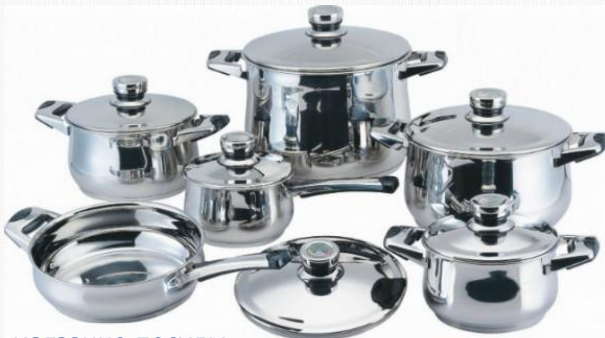
Витрина в магазине посуды