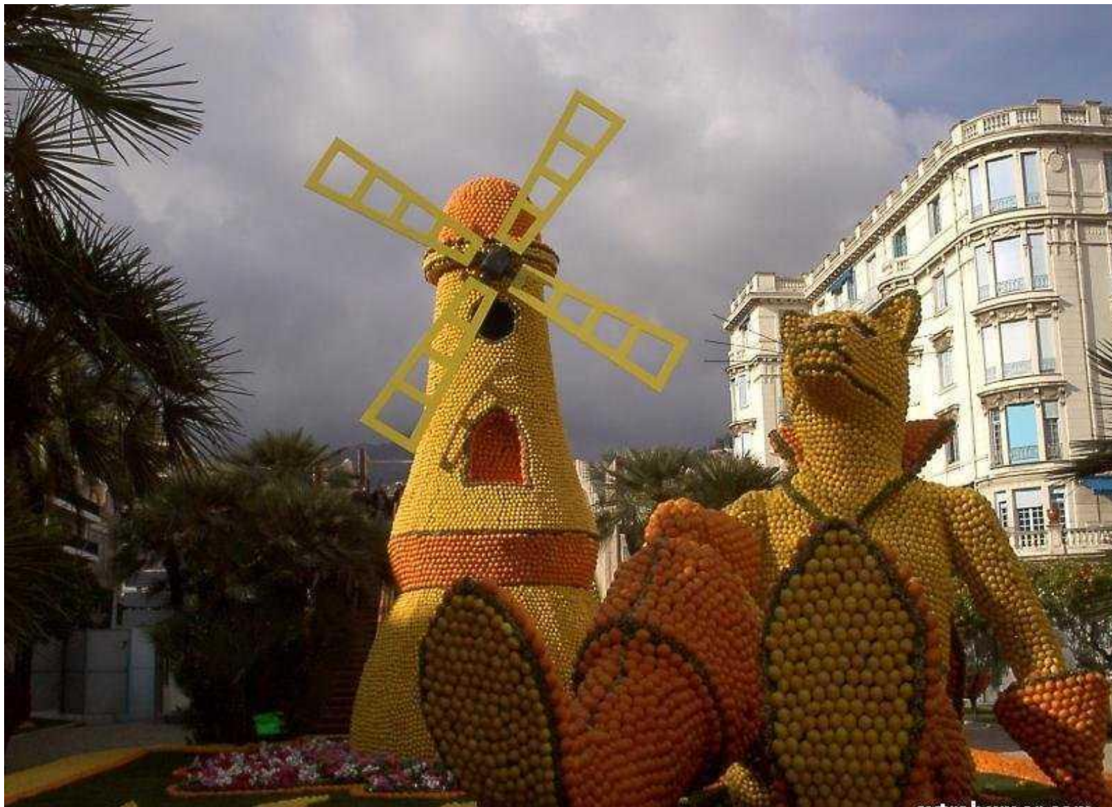
Изделия из апельсинов