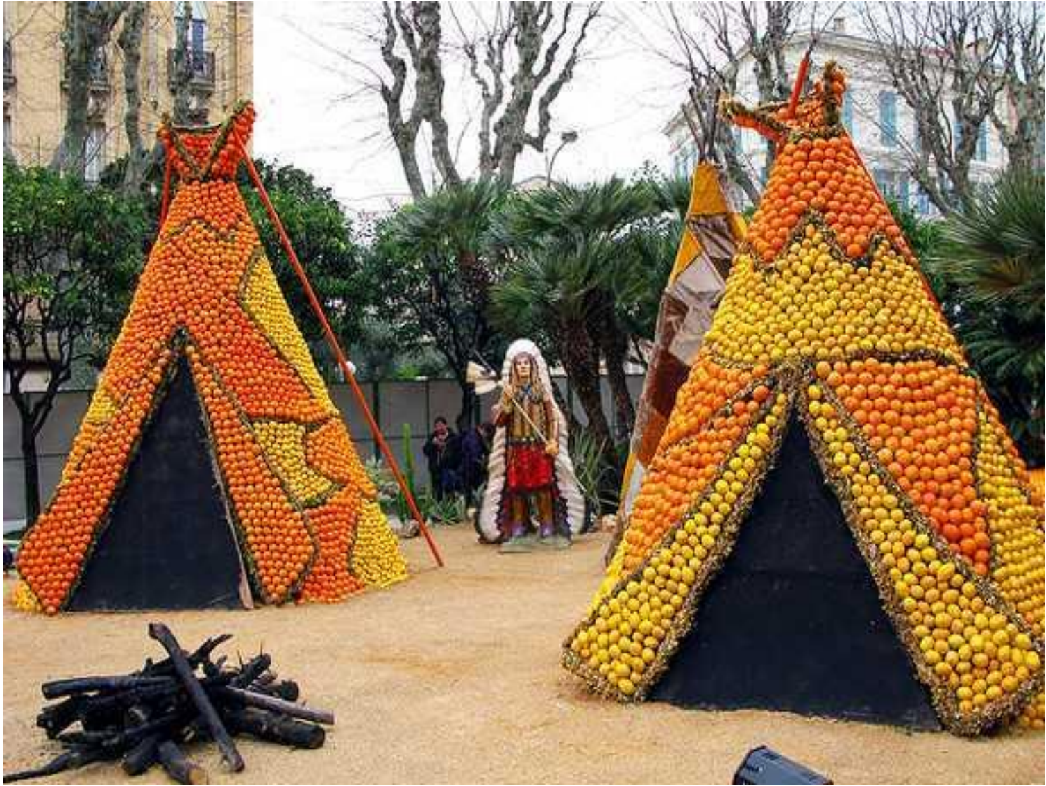
Изделия из апельсинов