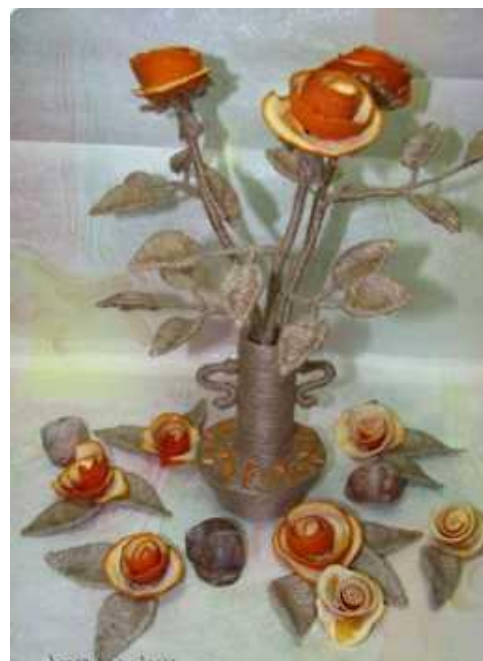
Изделия из апельсинов