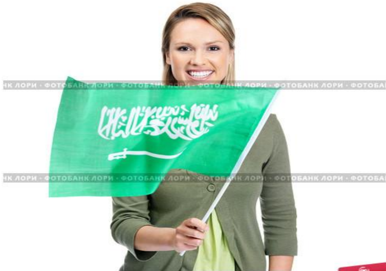
Девушка держит флаг Саудовской Аравии