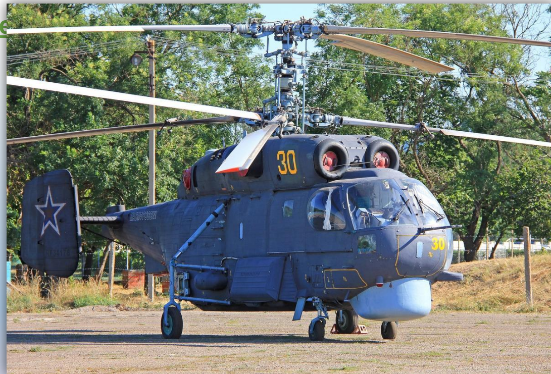
Фото: июль 2015 года.