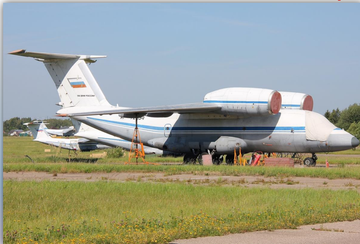
Фото: июль 2014 года.