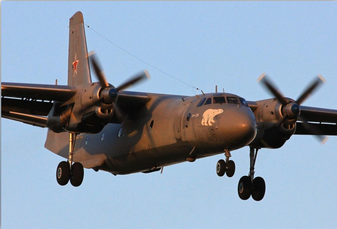
Фото: июнь 2015 года.

Позывные – 71574 и 71576 . По состоянию на апрель 2016 года – летает .