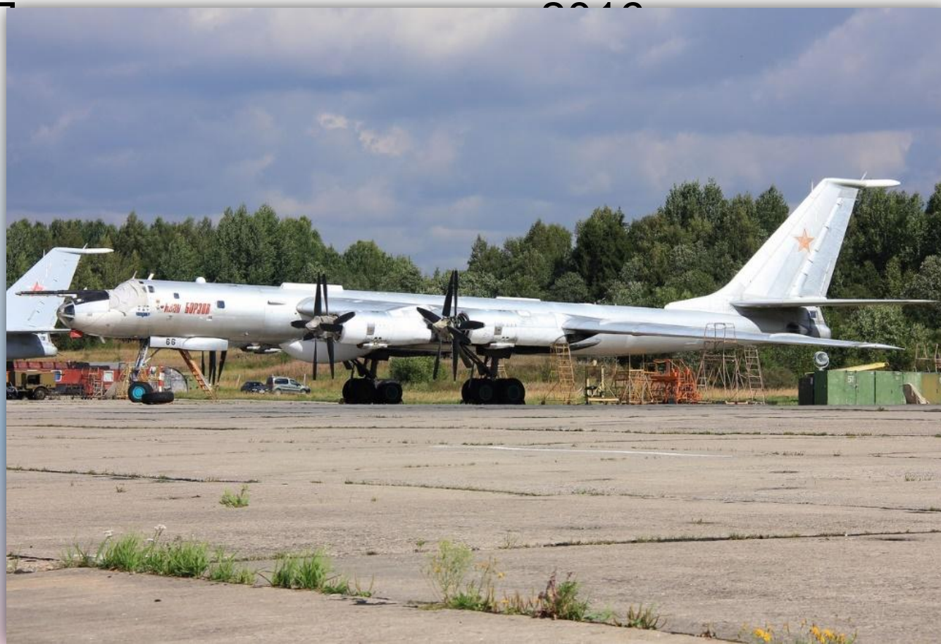
Фото: август 2014 года.