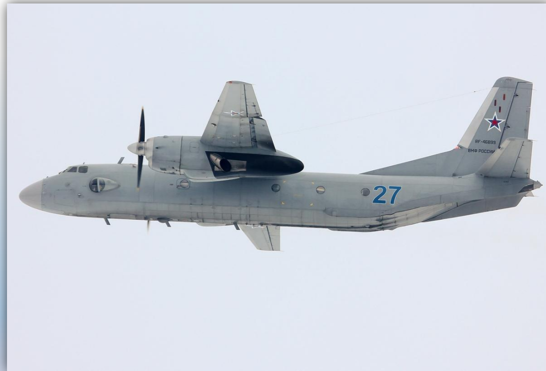
Фото: февраль 2015 года.