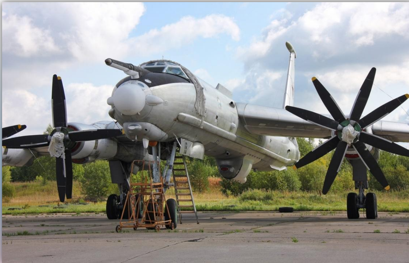
Фото: август 2014 года.

По состоянию на апрель 2016 года – на хранении .