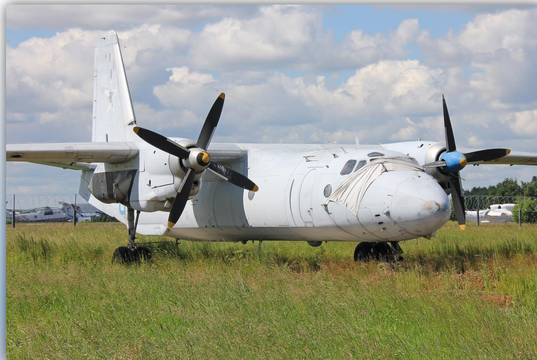
Фото: июль 2013 года.