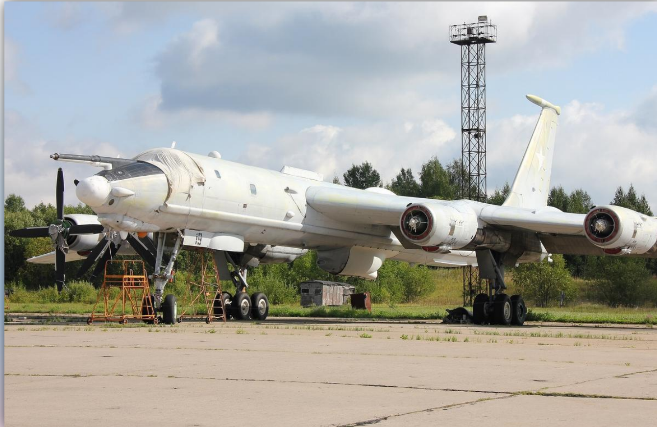
Фото: август 2014 года.

По состоянию на апрель 2016 года – на хранении .