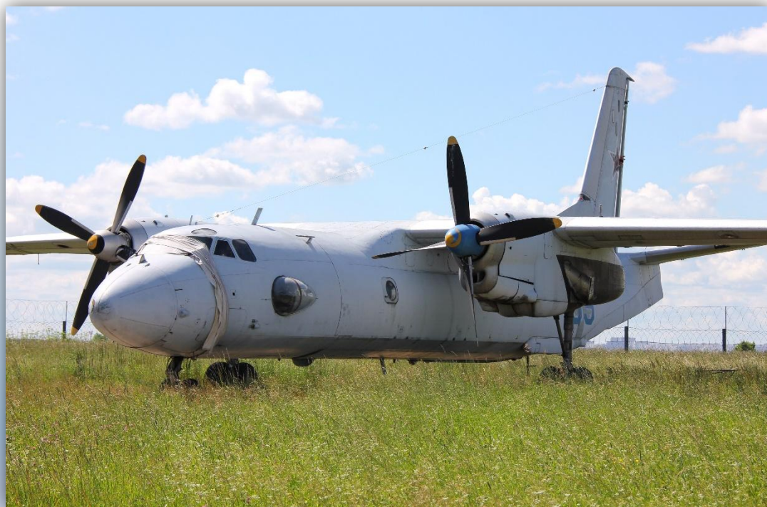
Фото: июль 2013 года.

По состоянию на апрель 2016 года – на хранении .