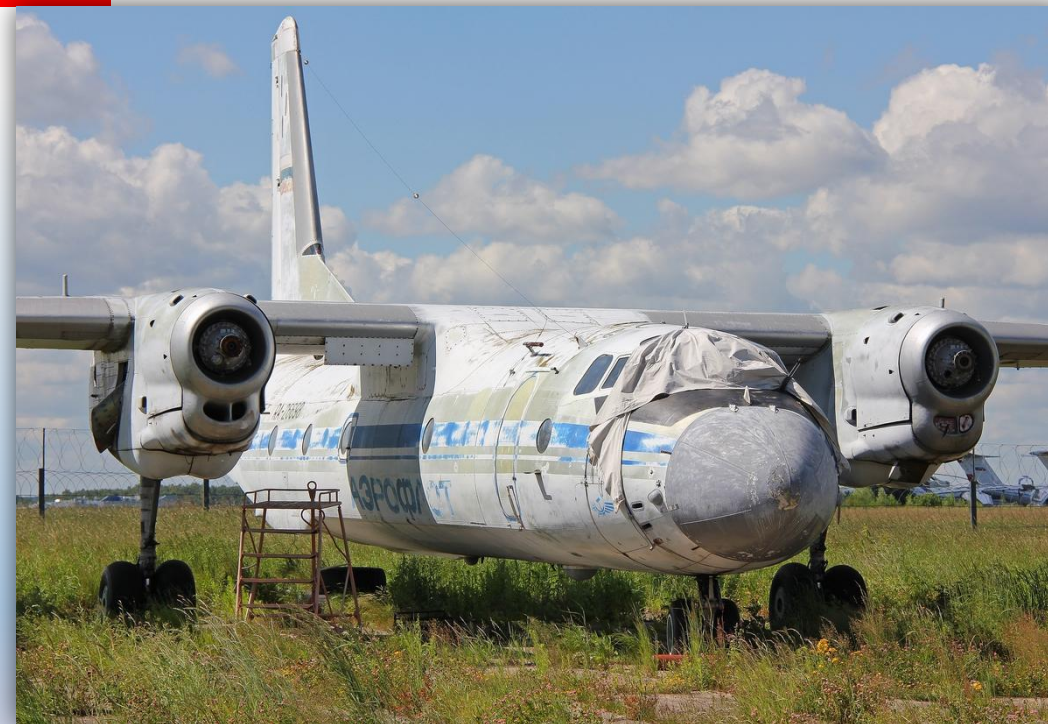
Фото: июль 2013 года.