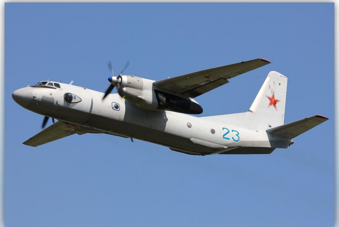
Фото: июнь 2014 года.