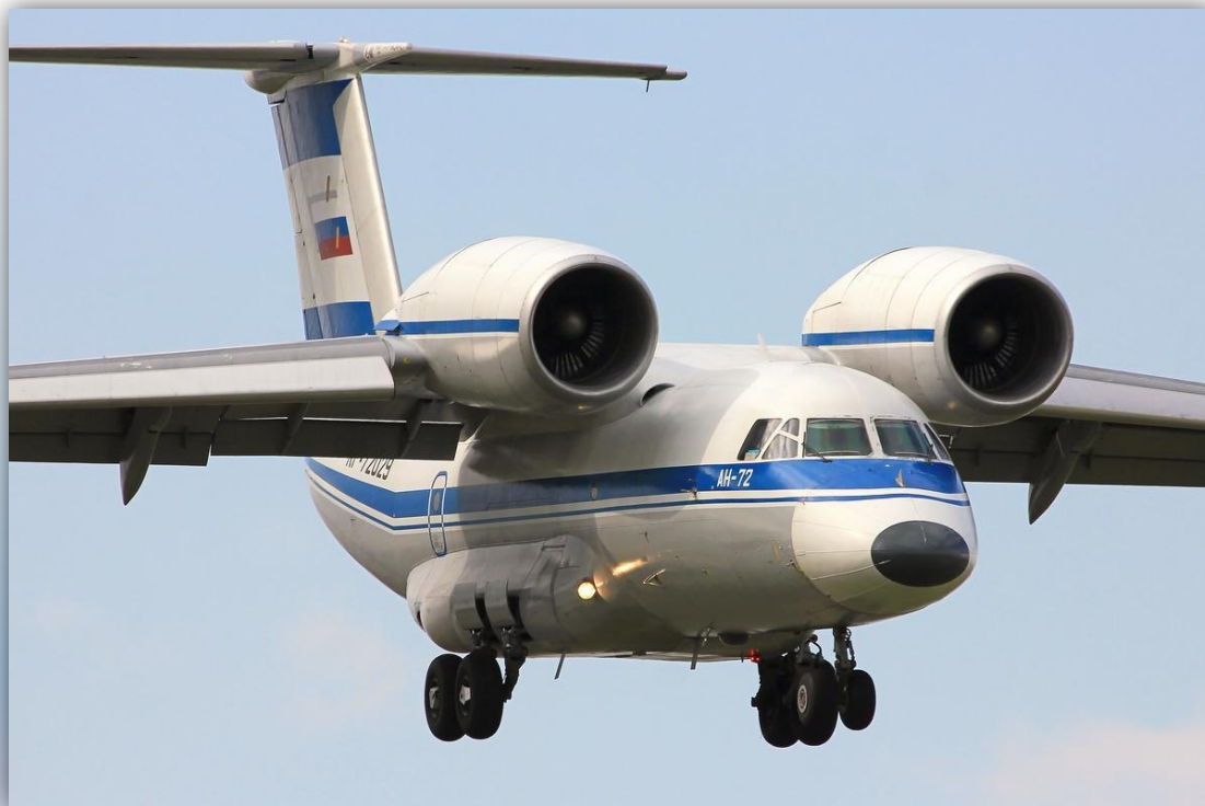
Фото: сентябрь 2014 года.

Позывные: 63002 , 95721 , 95723 , 95727 , 95728 , 95732 . Прежние номера: RA-72914 , СССР-72914 . По состоянию на апрель 2016 года – летает .