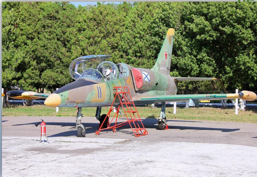
Фото: июль 2015 года.