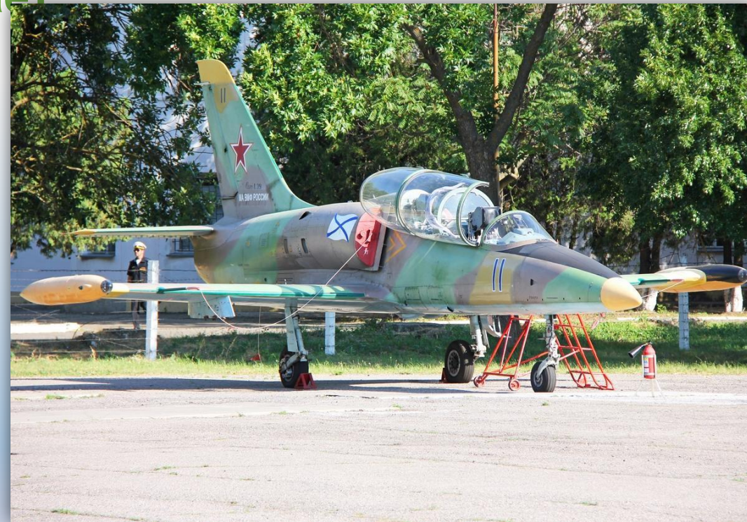
Фото: июль 2015 года.