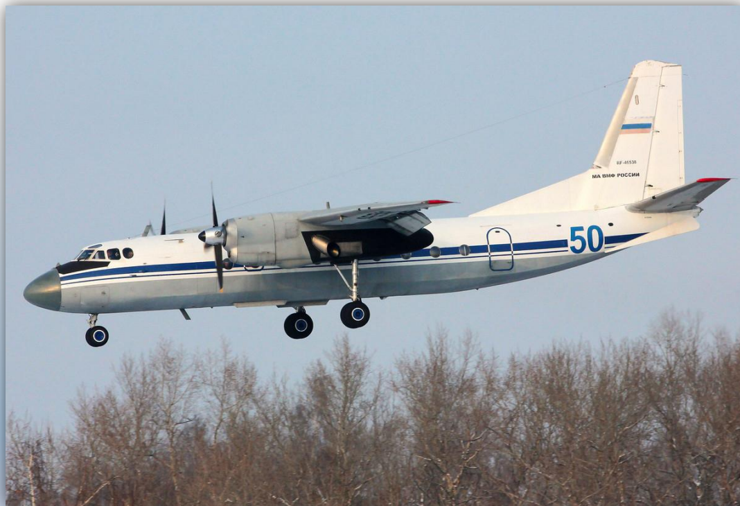
Фото: январь 2016 года.