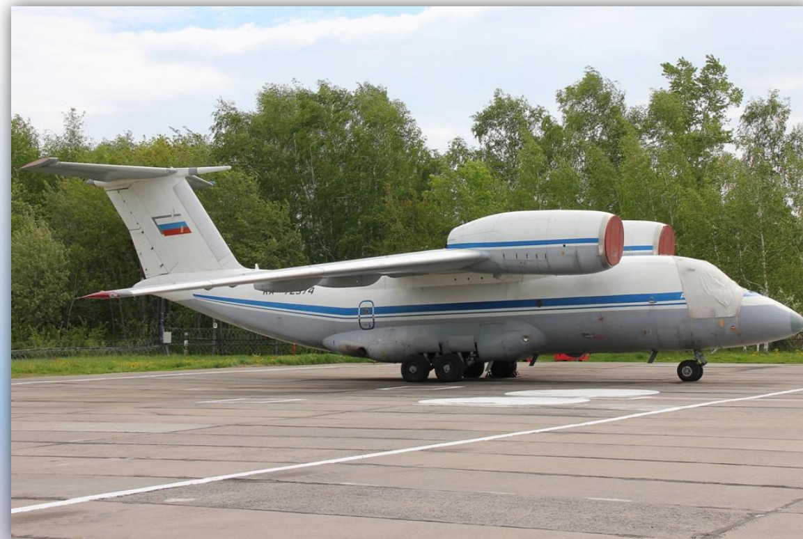
Фото: май 2011 года.