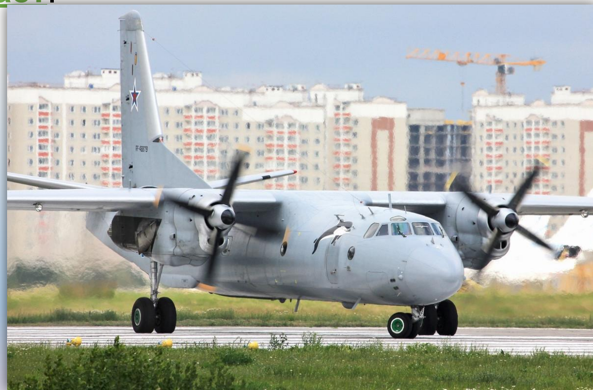
Фото: июль 2014 года.