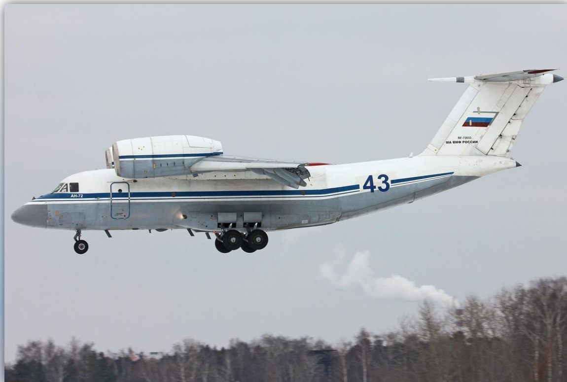
Фото: февраль 2016 года.