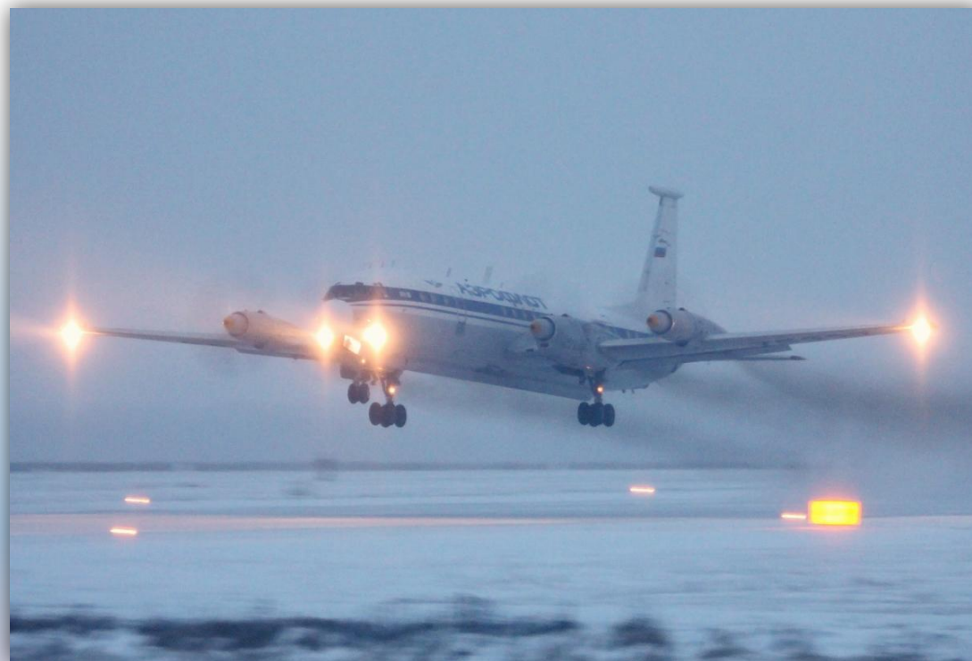
Фото: декабрь 2015 года.

Позывной – 75337 . Прежние номера: RA-75905 , СССР-75905 . По состоянию на апрель 2016 года – летает .