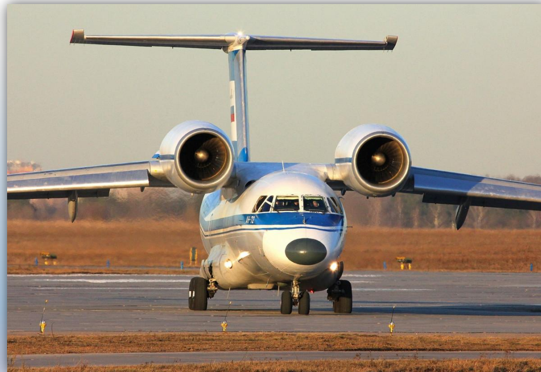
Фото: март 2015 года.