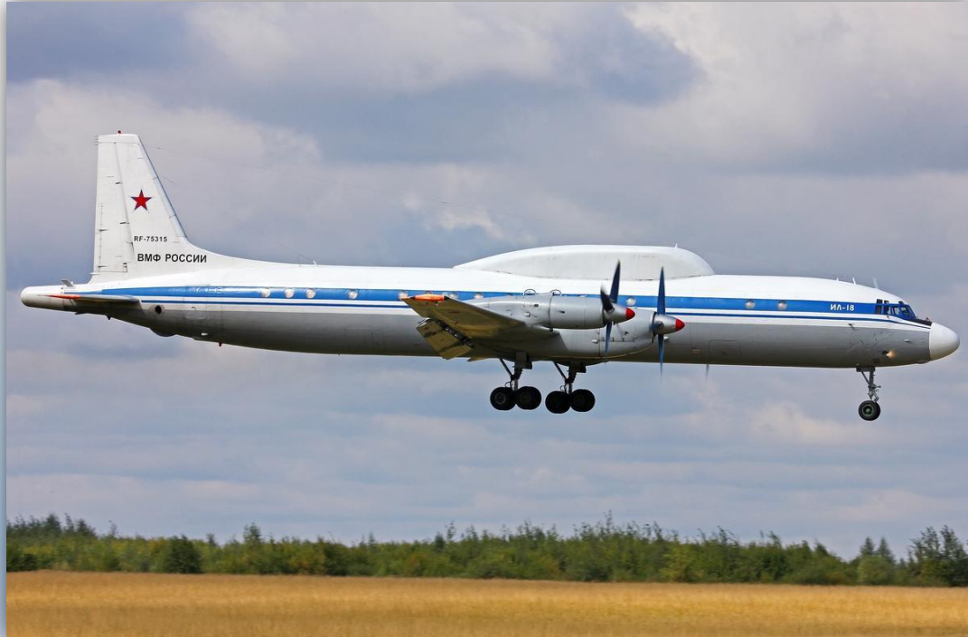
Фото: август 2015 года.

Позывной – 75040 . Прежние номера: RA-75482 , СССР-75482 . По состоянию на апрель 2016 года – летает .