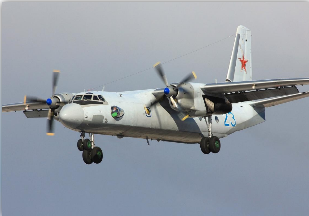
Фото: апрель 2014 года.

Позывные – 02203 , 02204 , 63801 , 63804 . По состоянию на апрель 2016 года – летает .