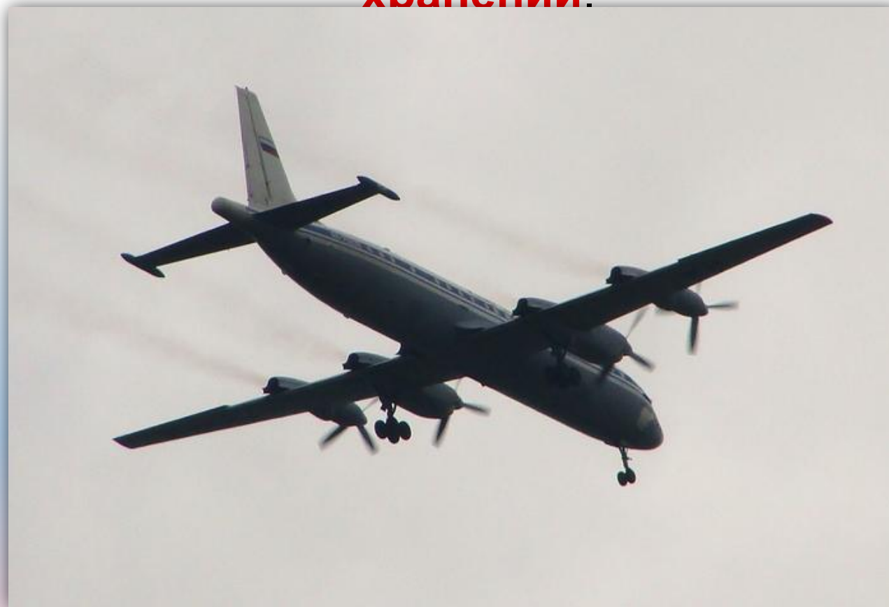
Фото: август 2009

Прежний номер: СССР-75528 . По состоянию на апрель 2016 года – на хранении.