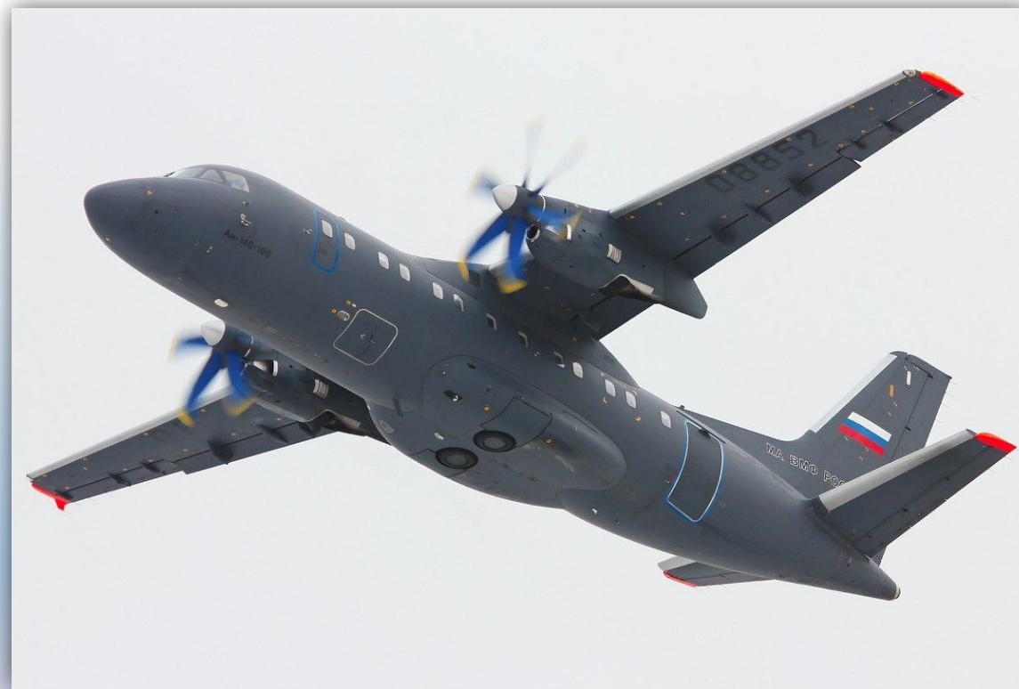
Фото: март 2015 года.