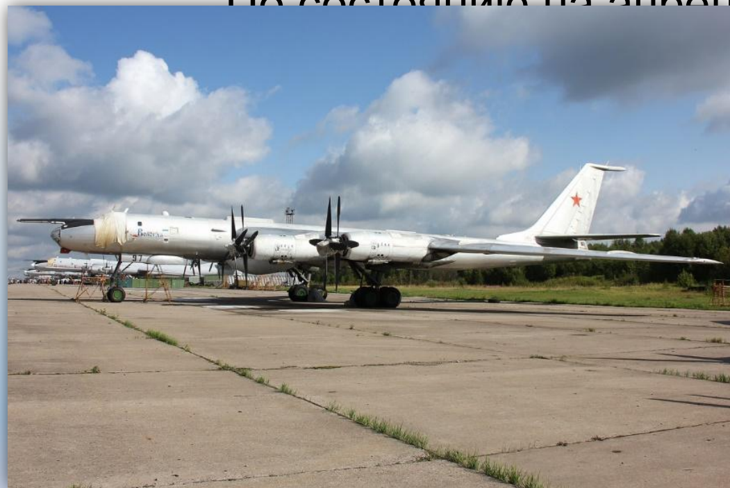
Фото: август 2014 года.

По состоянию на апрель 2016 года на хранилищах