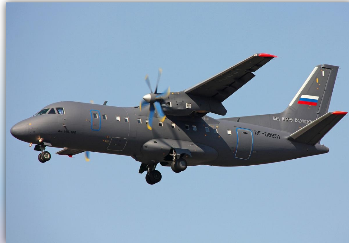
Фото: апрель 2013 года.