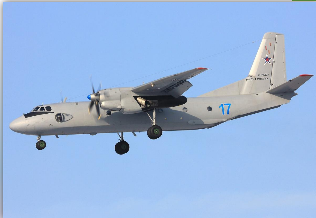
Фото: февраль 2015 года.

Позывной – 52727 . Прежний номер: 10 красный . По состоянию на апрель 2016 года – летает .