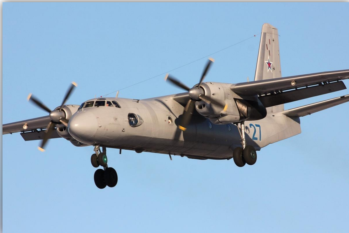
Фото: февраль 2015 года.

Позывные – 02203 , 02204 , 63801 , 63804 . По состоянию на апрель 2016 года – летает .