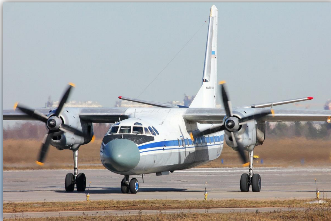
Фото: март 2015 года.