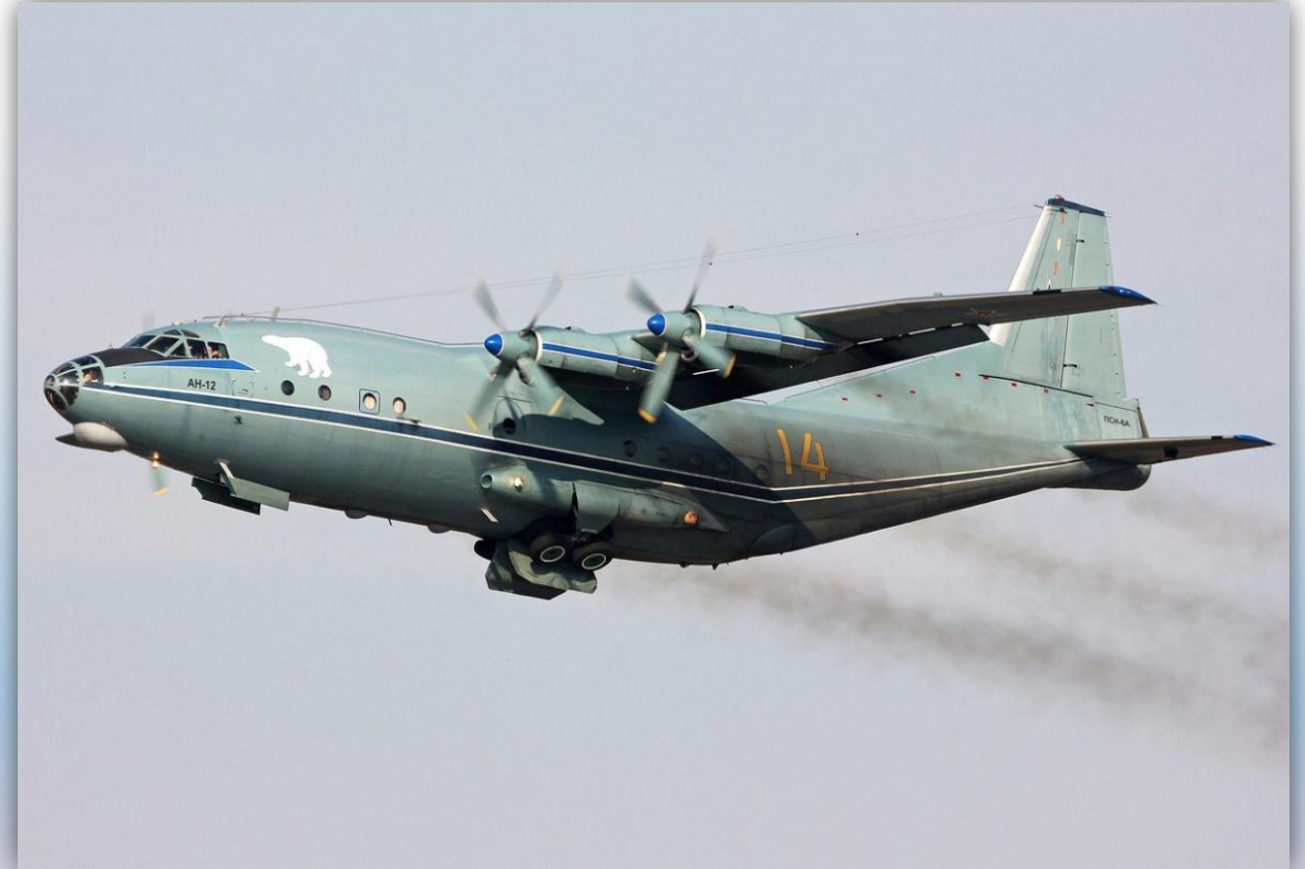
Фото: март 2015 года.