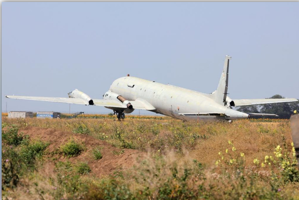
Фото: июль 2015

По состоянию на апрель 2016 года – на хранении .