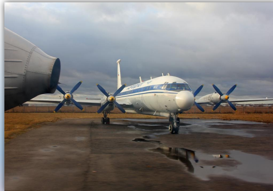
Фото: декабрь 2015 года.