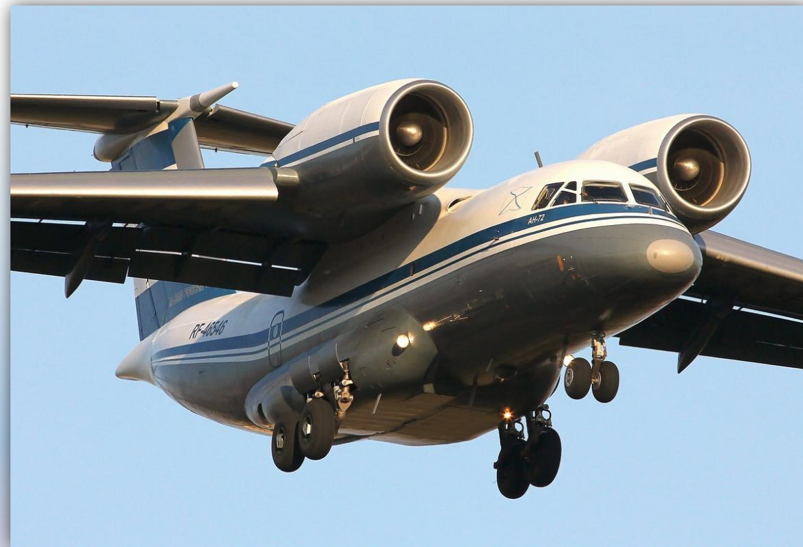
Фото: март 2015 года.