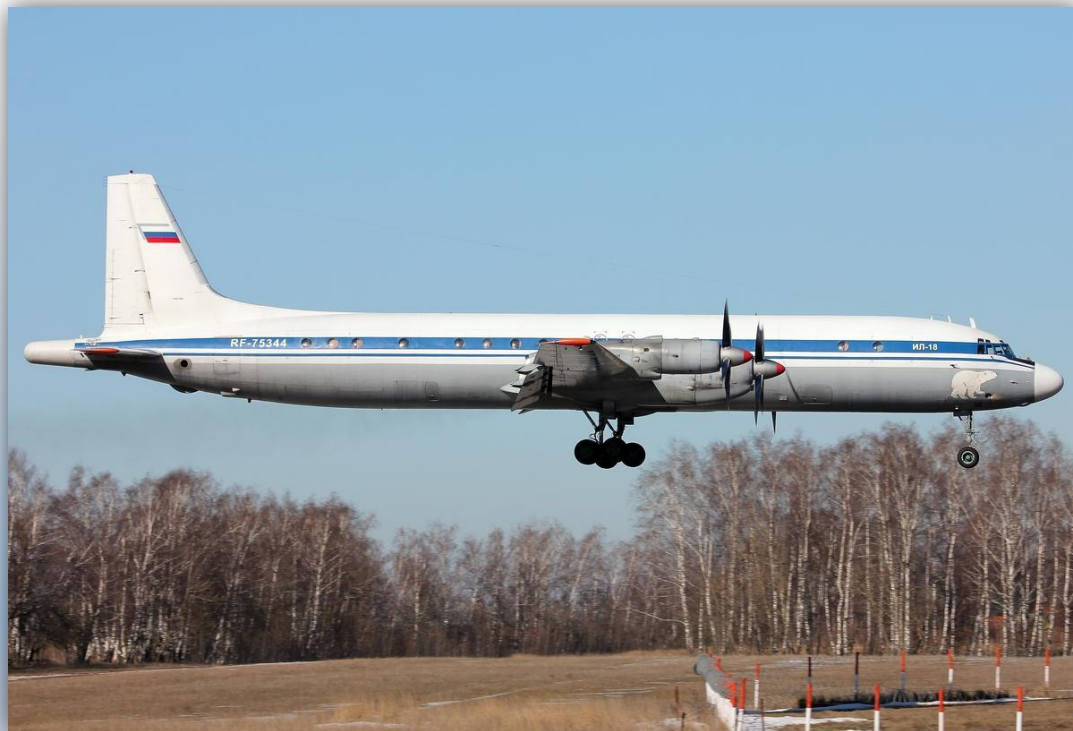
Фото: март 2015 года.

Позывной – 75040 . Прежние номера: RA-75481 , СССР-75481 . По состоянию на апрель 2016 года – летает.