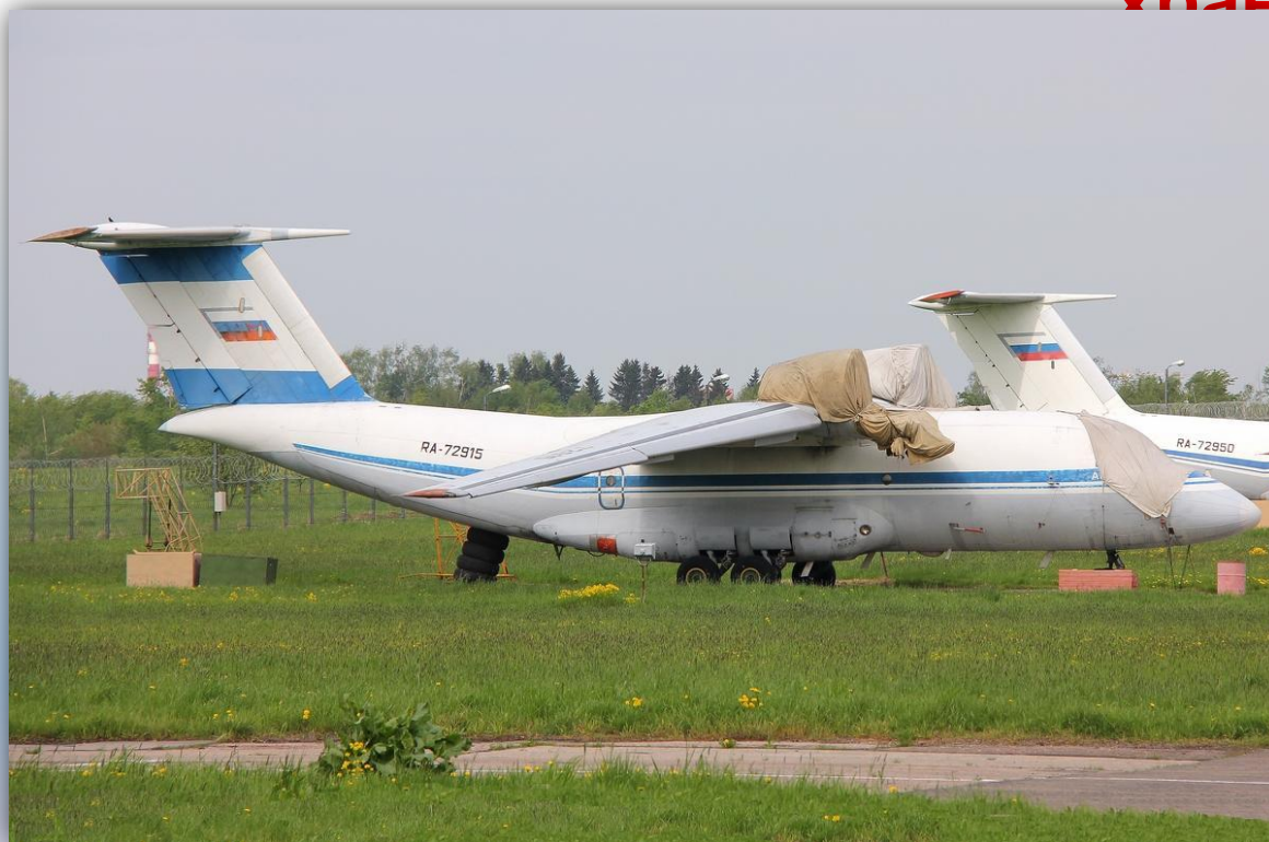
Фото: май 2011 года.