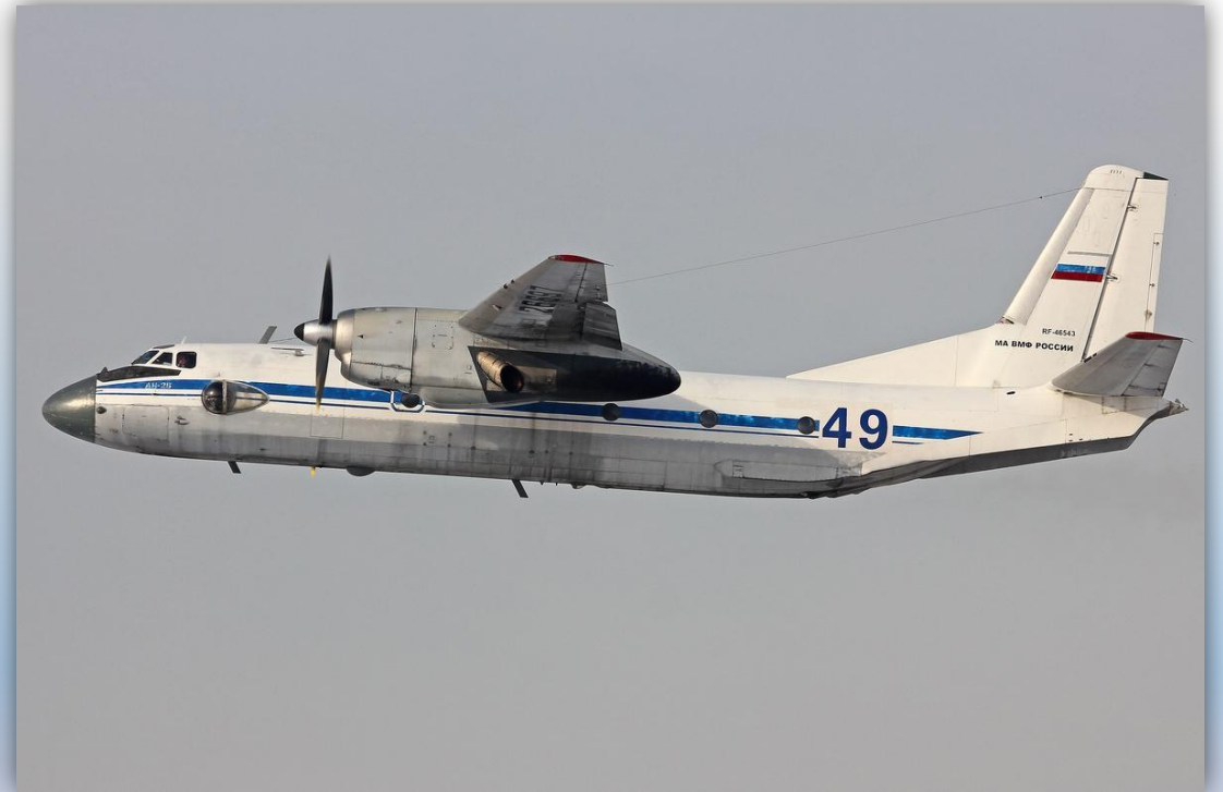
Фото: март 2016 года.