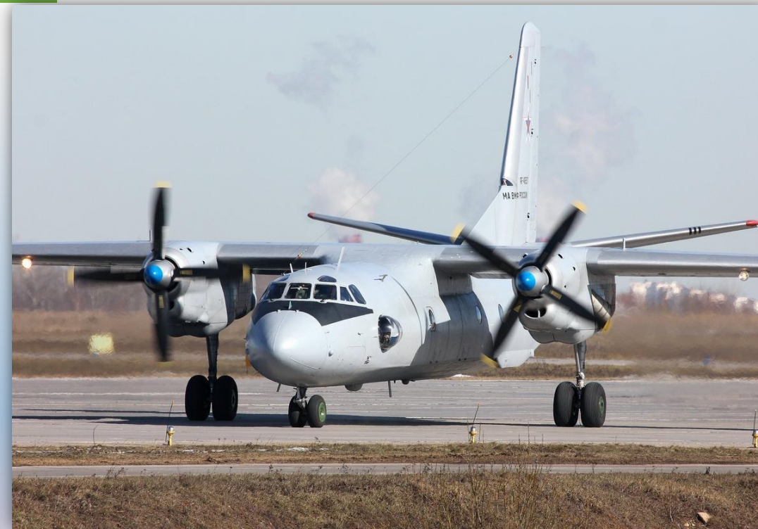
Фото: март 2015 года.