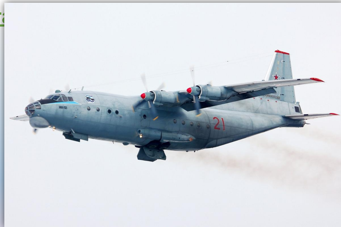
Фото: февраль 2016 года.