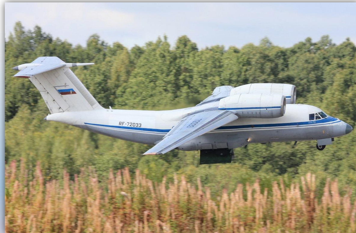
Фото: август 2014 года.