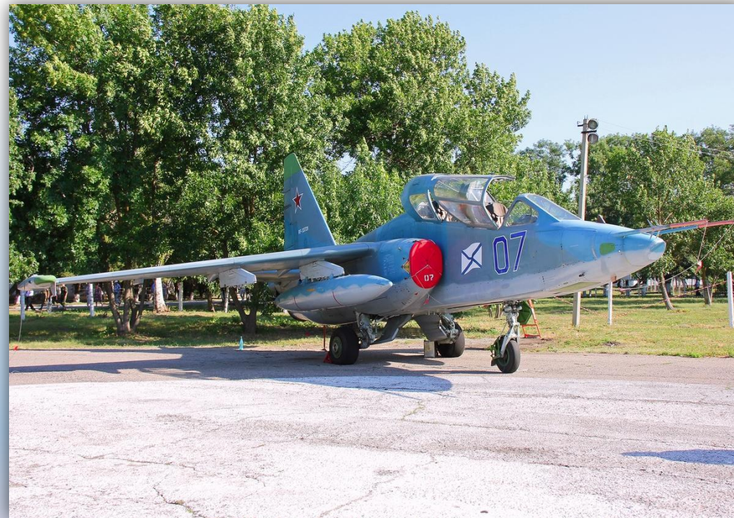
Фото: июль 2015 года.