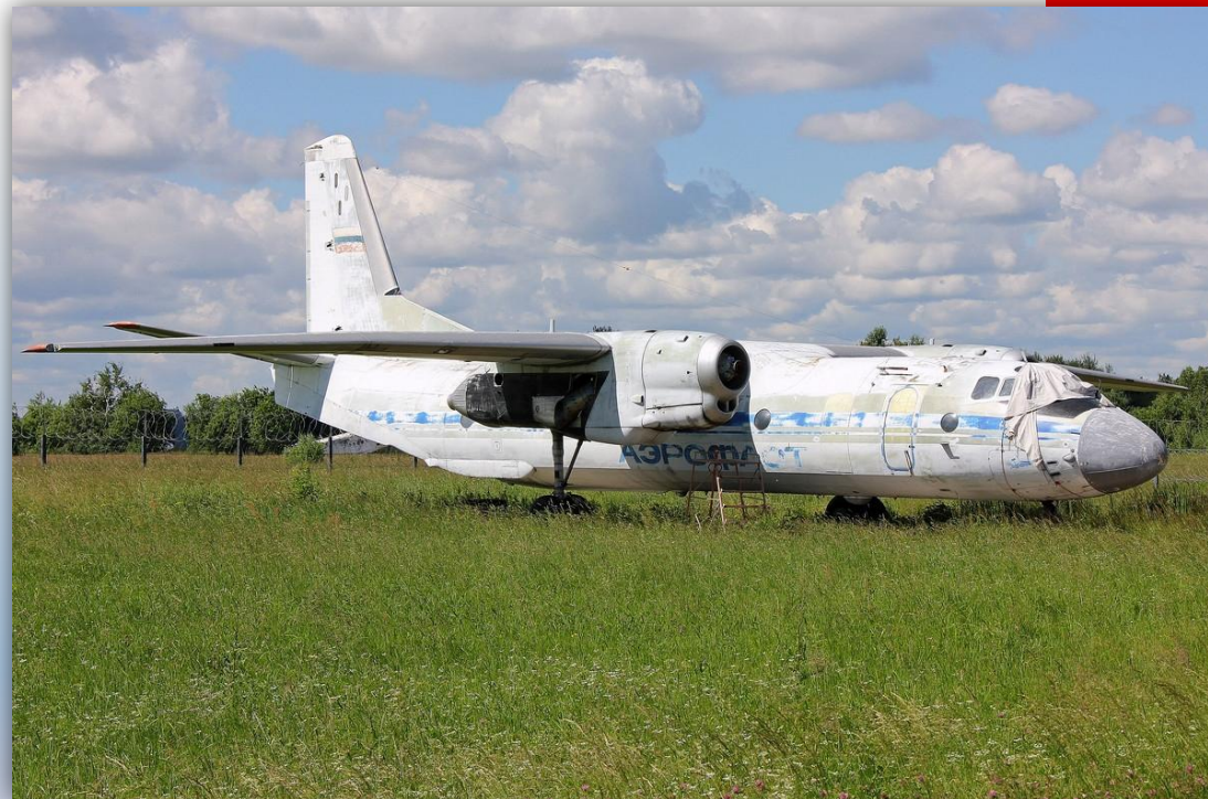
Фото: июль 2013 года.