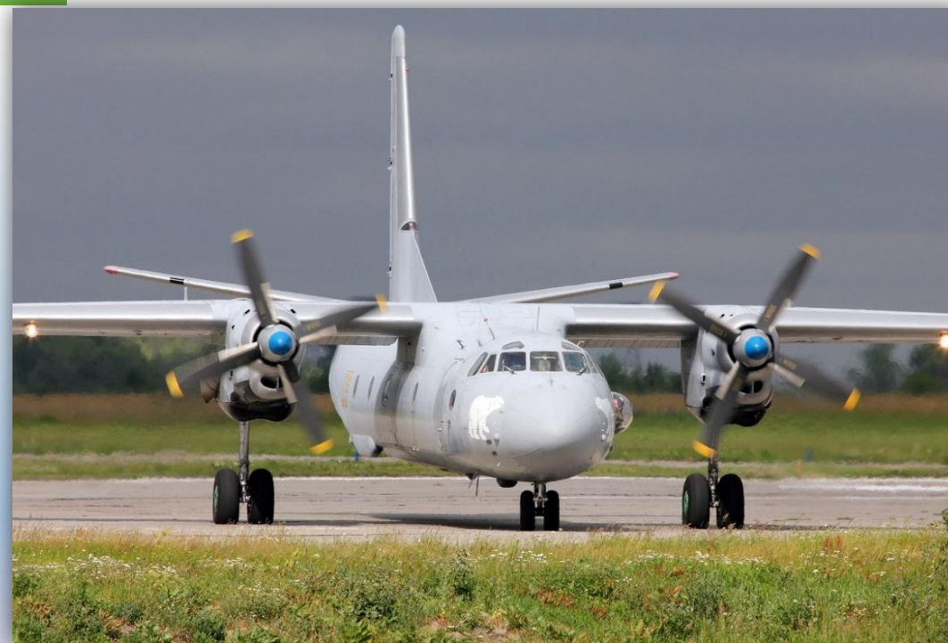
Фото: июль 2014 года.