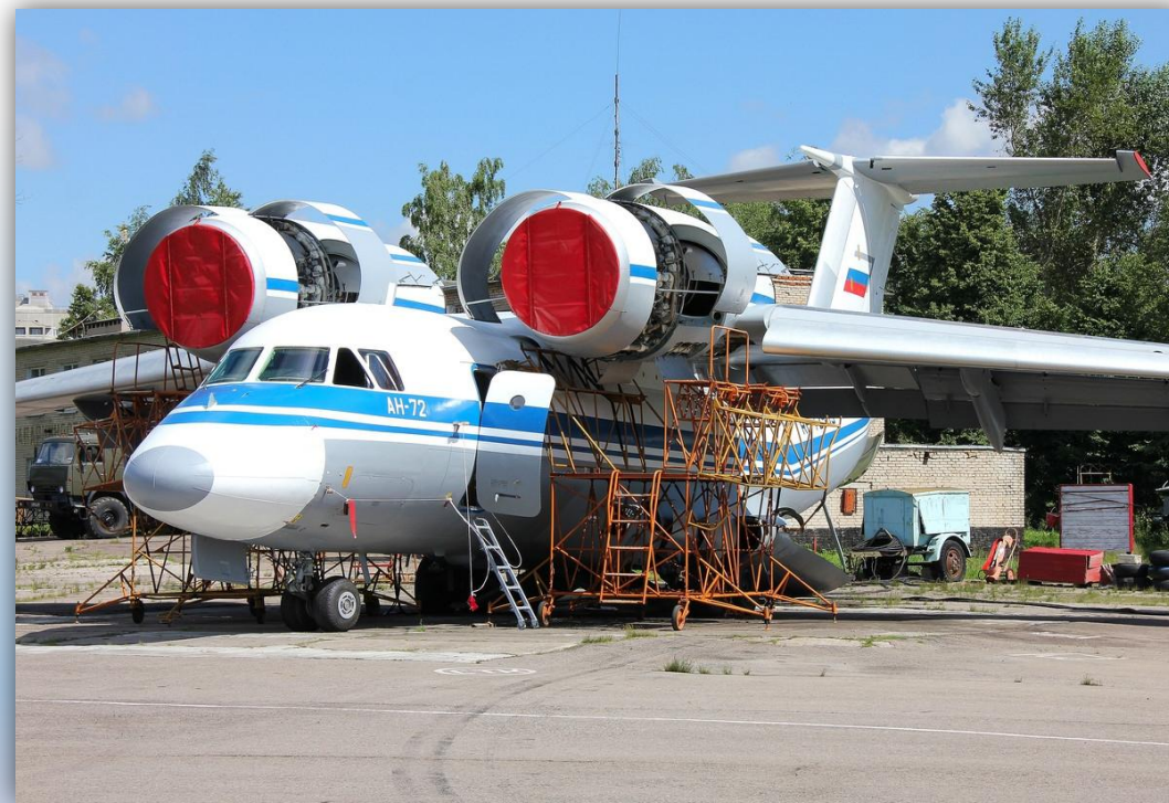
Фото: август 2015 года.