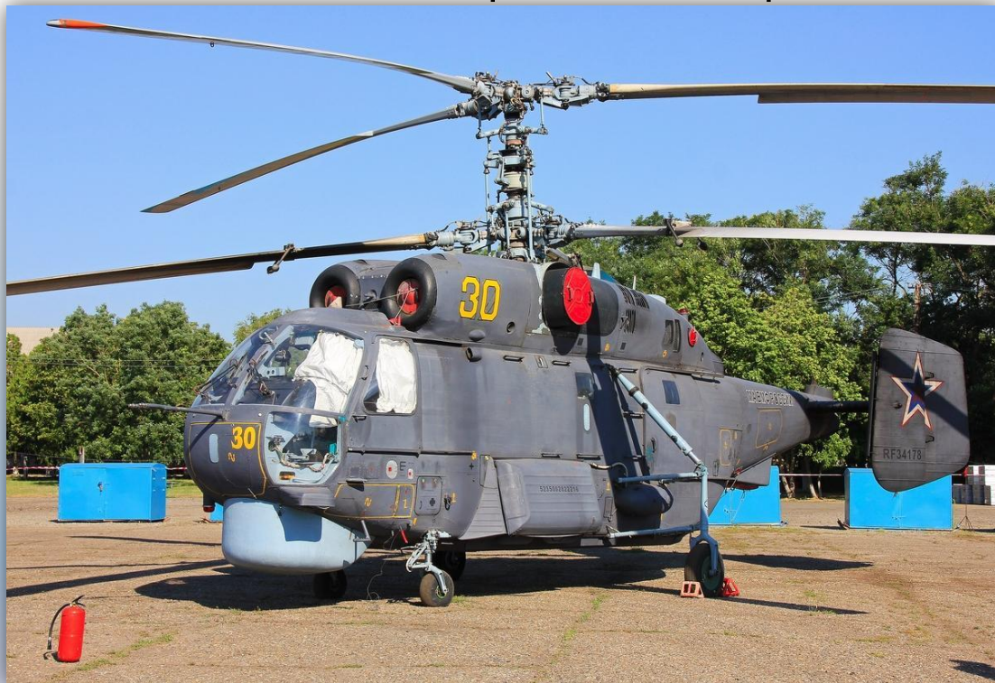
Фото: июль 2015 года.

Позывной – нет данных. Прежние номера: 17 желтый , 38 желтый . По состоянию на апрель 2016 года –