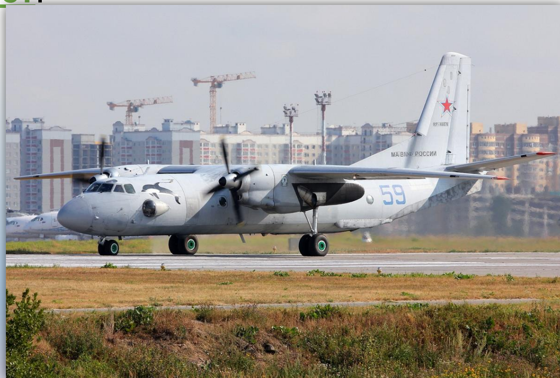
Фото: август 2014 года.