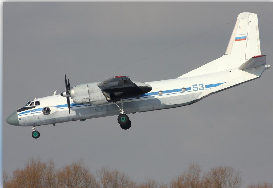
Фото: февраль 2014 года.

Позывные: 95722 , 95725 , 95729 , 95731 . Прежний номер: 50 красный . По состоянию на апрель 2016 года – летает .