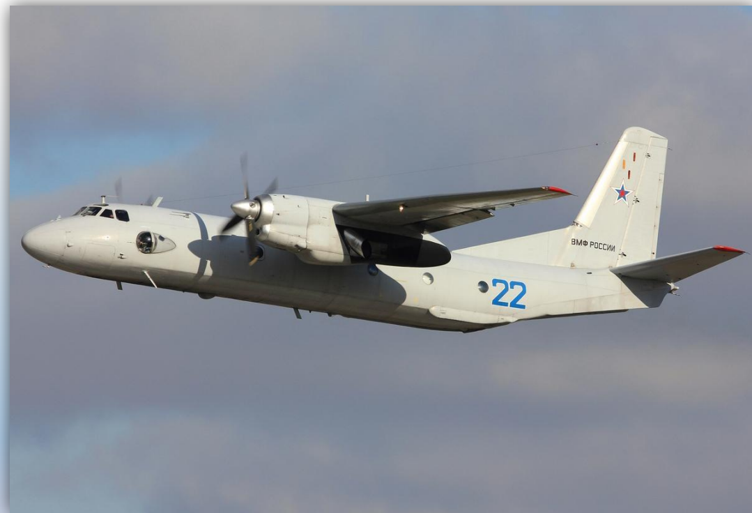
Фото: ноябрь 2014 года.