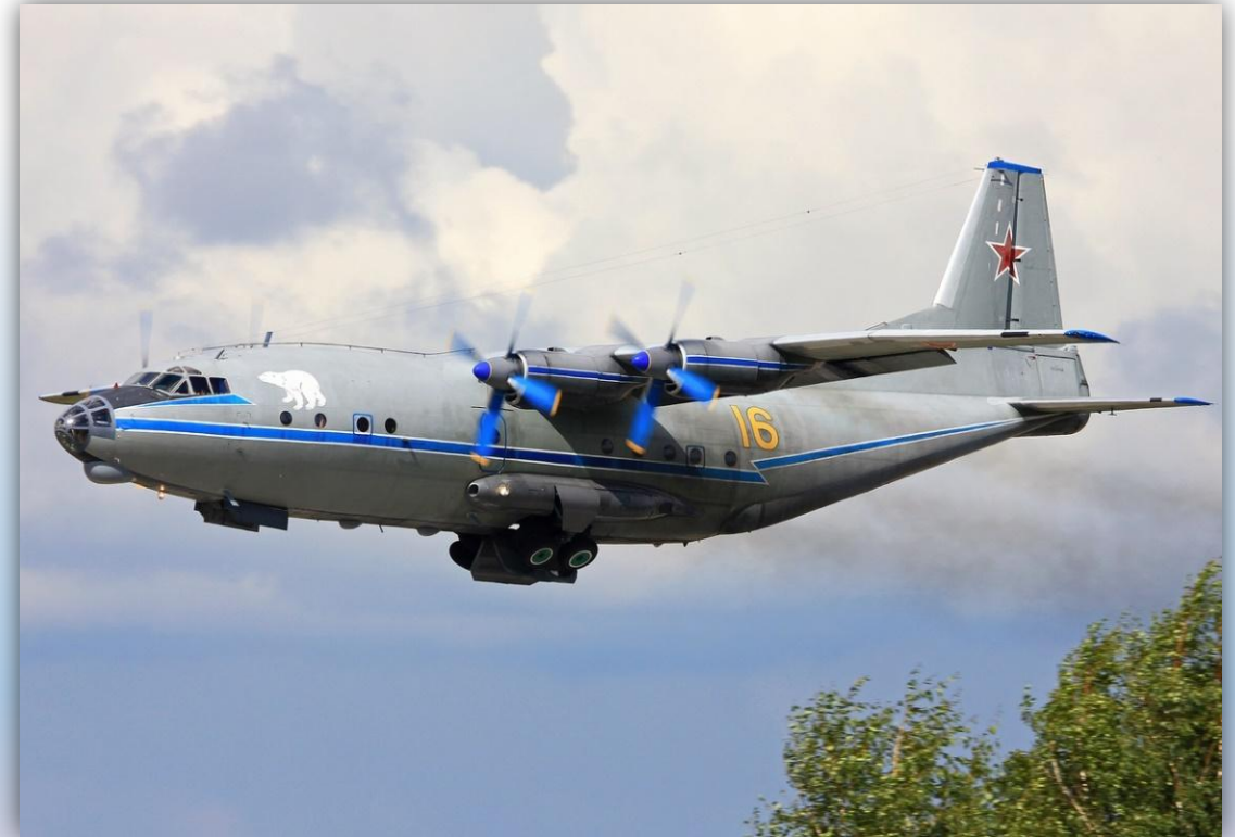
Фото: июль 2015 года.