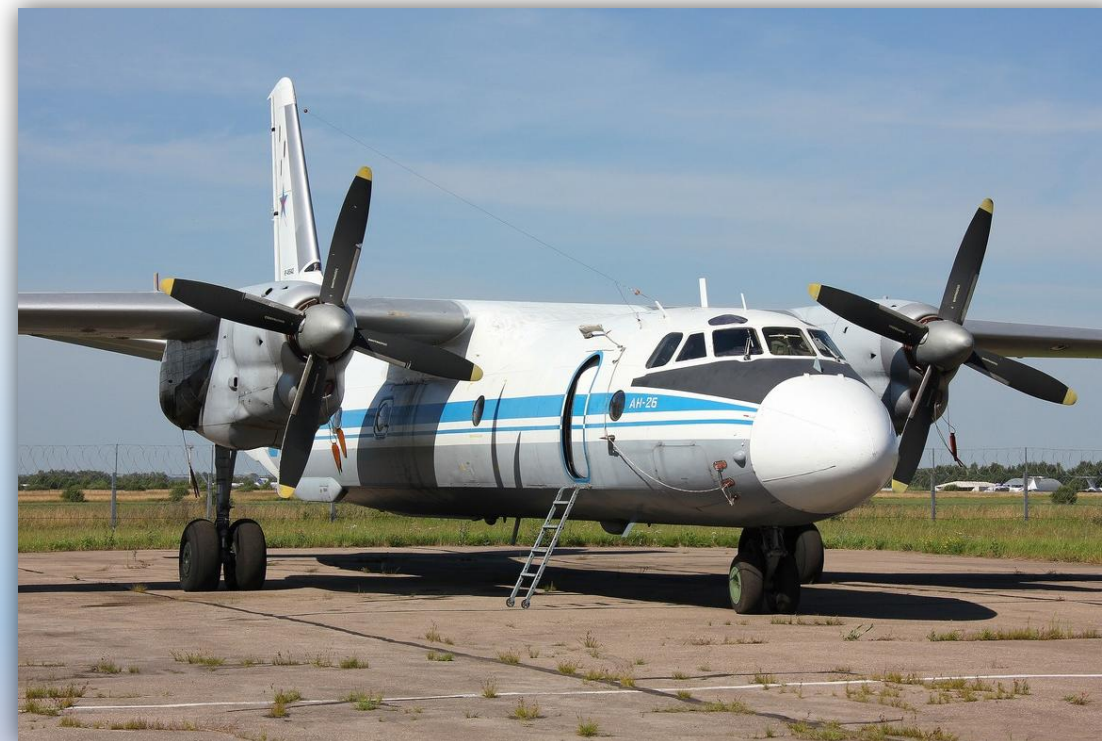
Фото: июль 2013 года.