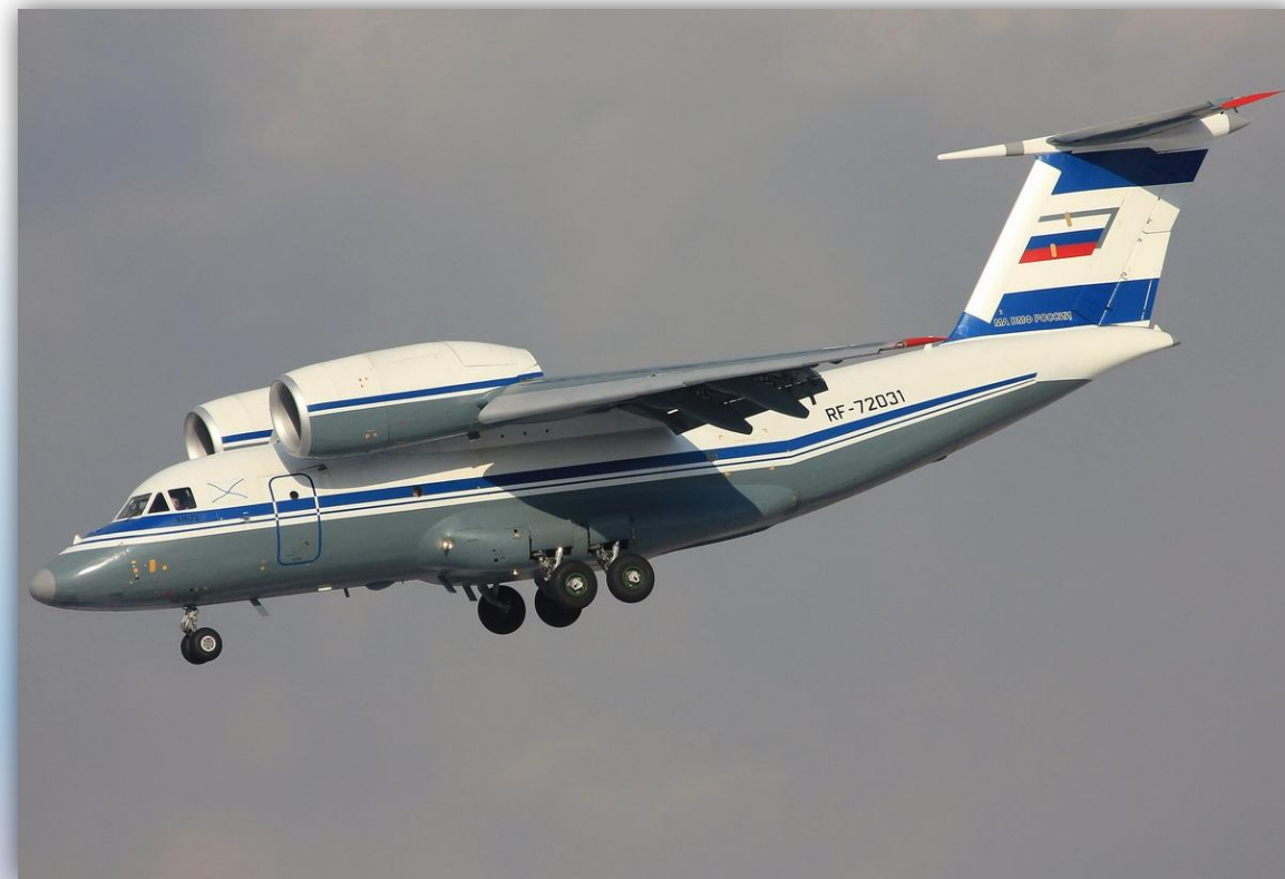
Фото: февраль 2014 года.