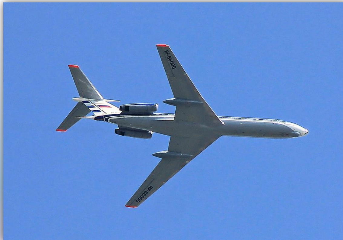
Фото: июль 2015 года.

Позывные – 66000 , 65399 . Прежний номер: СССР-63780 . По состоянию на апрель 2016 года – летает .