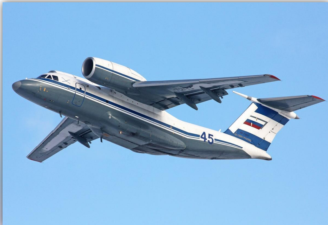
Фото: февраль 2016 года.