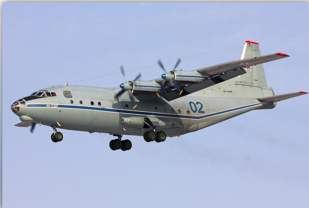
Фото: февраль 2015 года.

Позывной – нет данных . По состоянию на апрель 2016 года – летает .