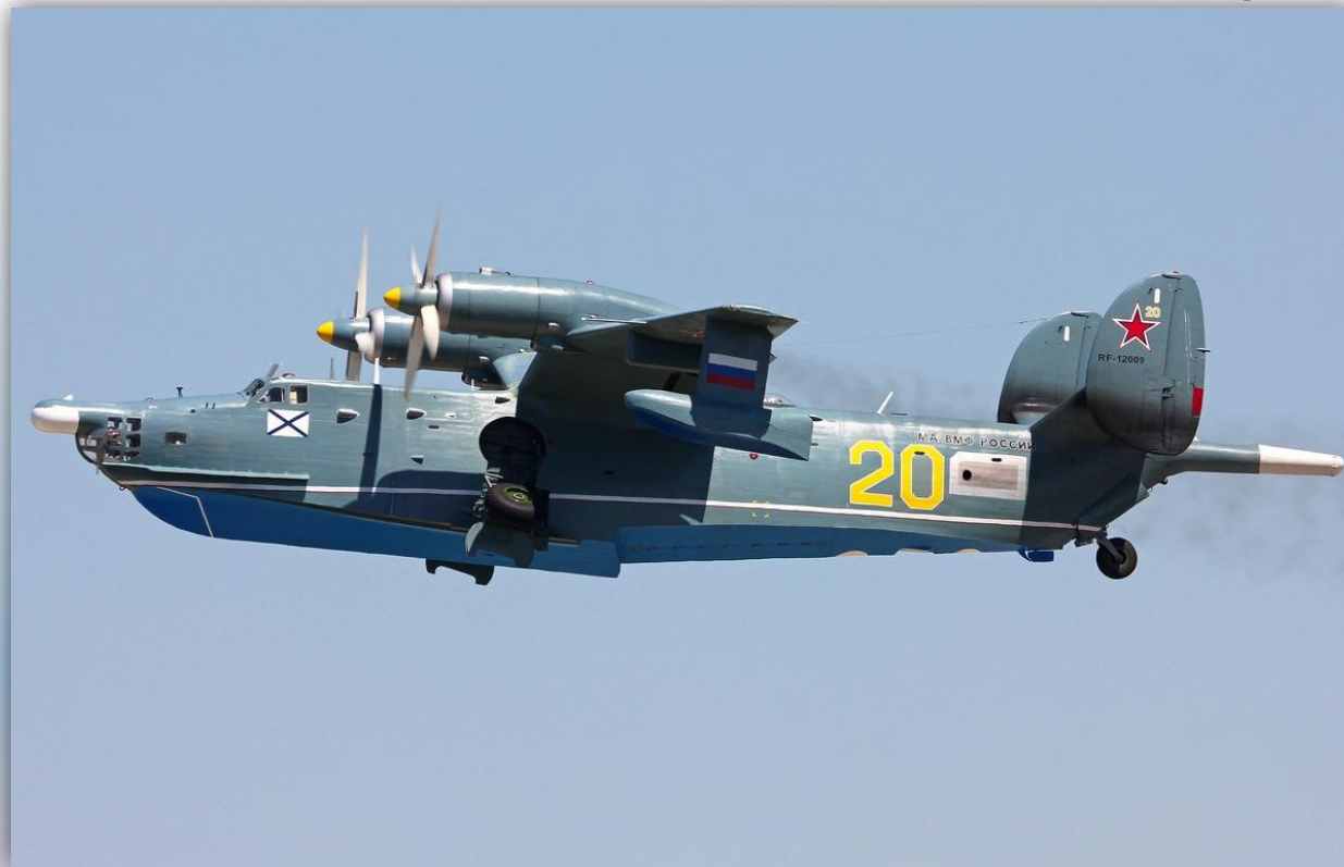
Фото: июль 2015 года.

Позывные – нет данных. По состоянию на апрель 2016 года –