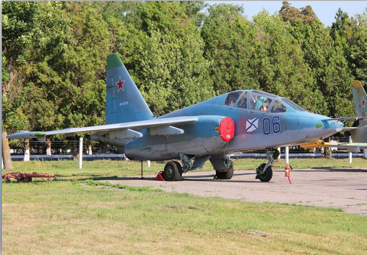
Фото: июль 2015 года.

Позывной — нет данных. Прежний номер: 06 желтый . По состоянию на апрель 2016 года — летает.