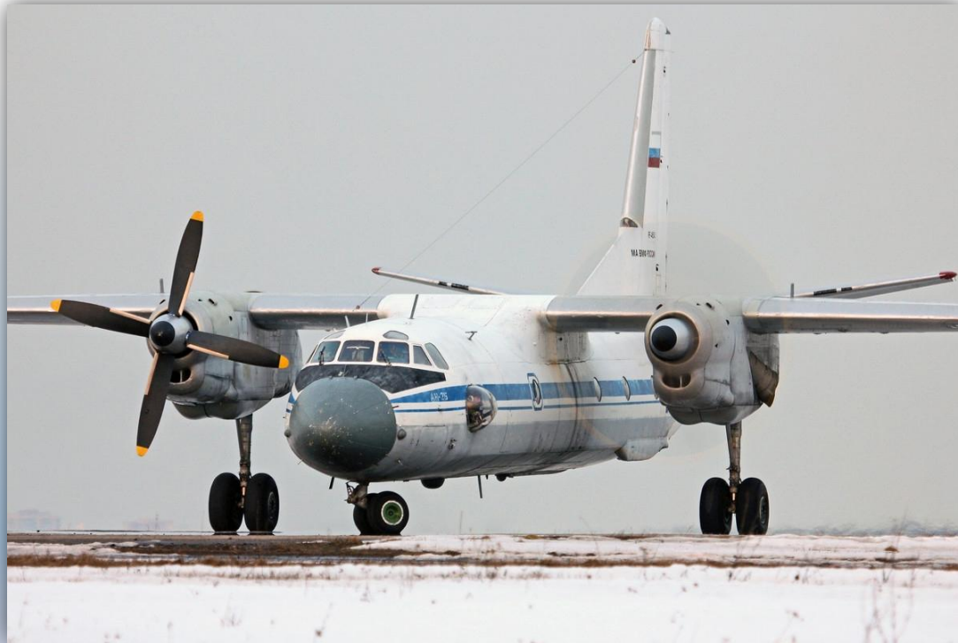
Фото: март 2016 года.