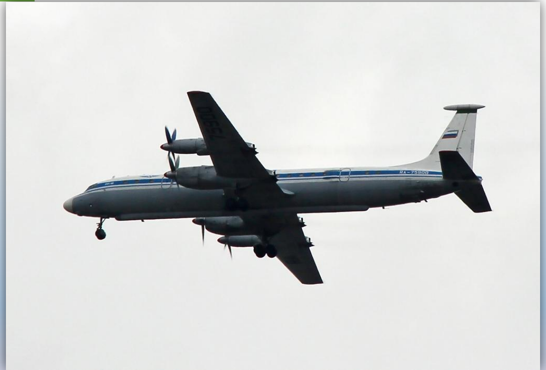
Фото: май 2011 года.