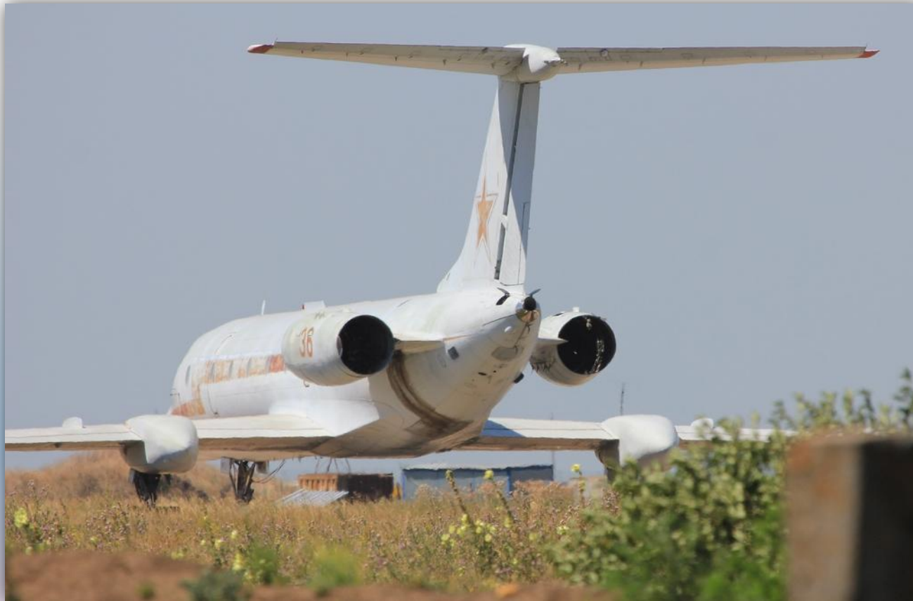
Фото: июль 2015 года.

По состоянию на апрель 2016 года – на хранении .