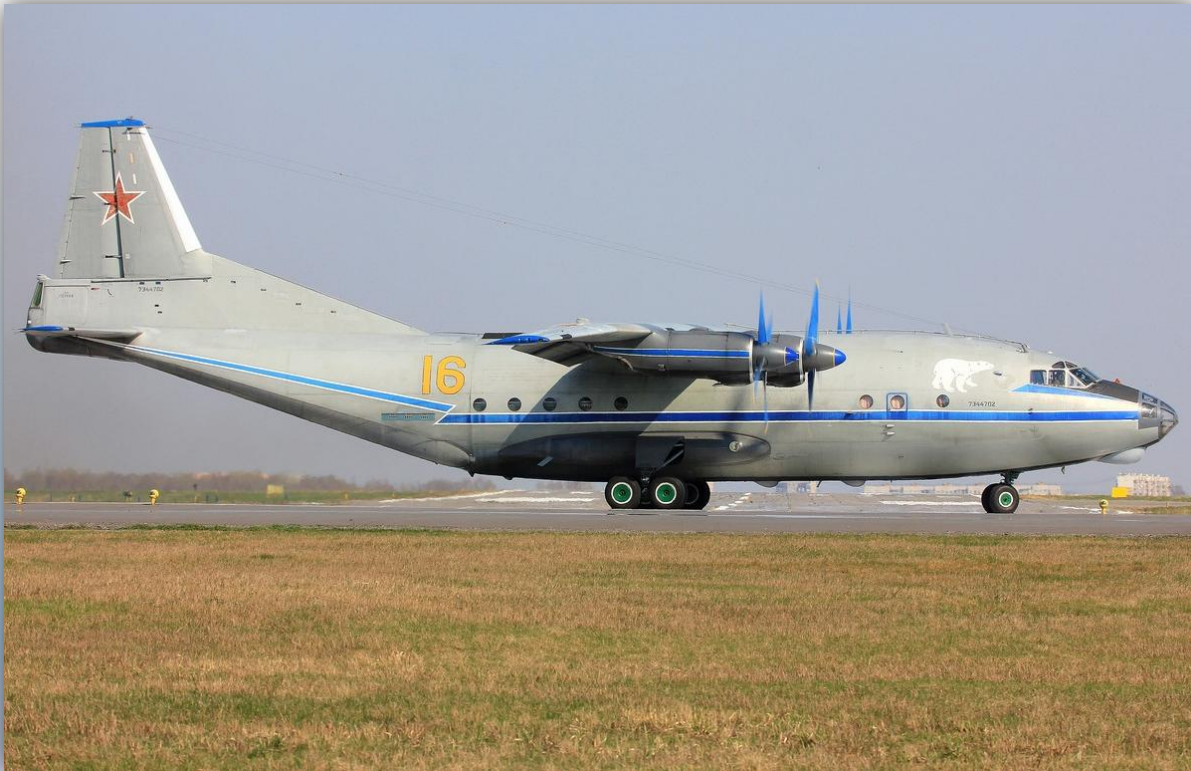
Фото: апрель 2014 года.

Позывной – 08395 . По состоянию на апрель 2016 года – летает .