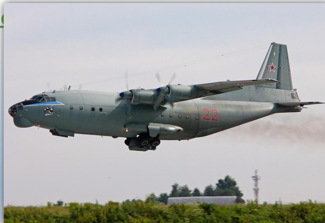
Фото: июнь 2013 года.