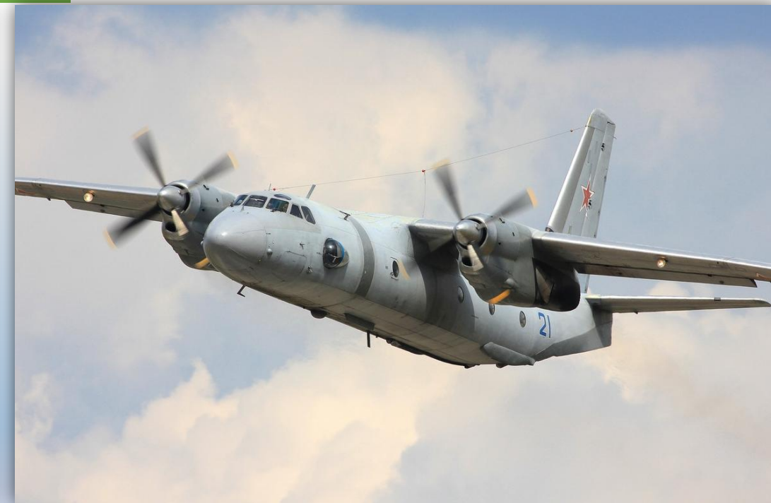
Фото: июль 2014 года.