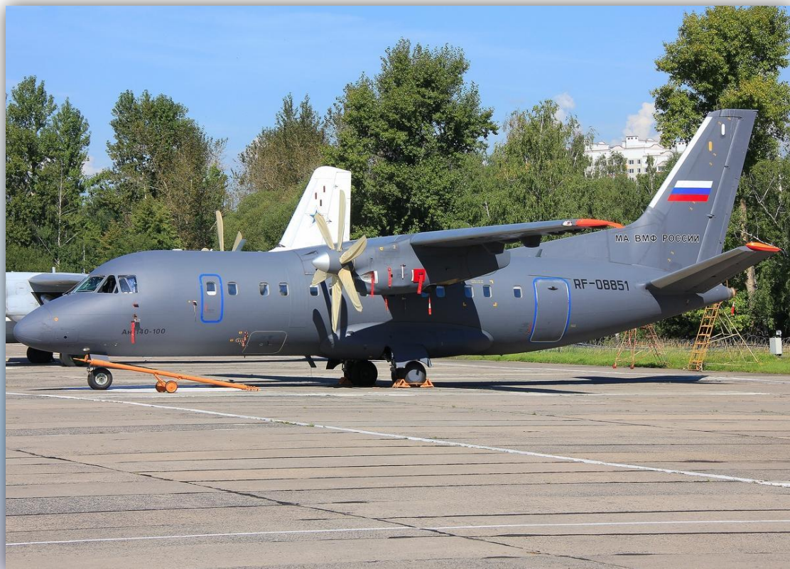
Фото: август 2013 года.

Позывной: 08851 . Прежний номер: 07 синий . По состоянию на апрель 2016 года – летает .