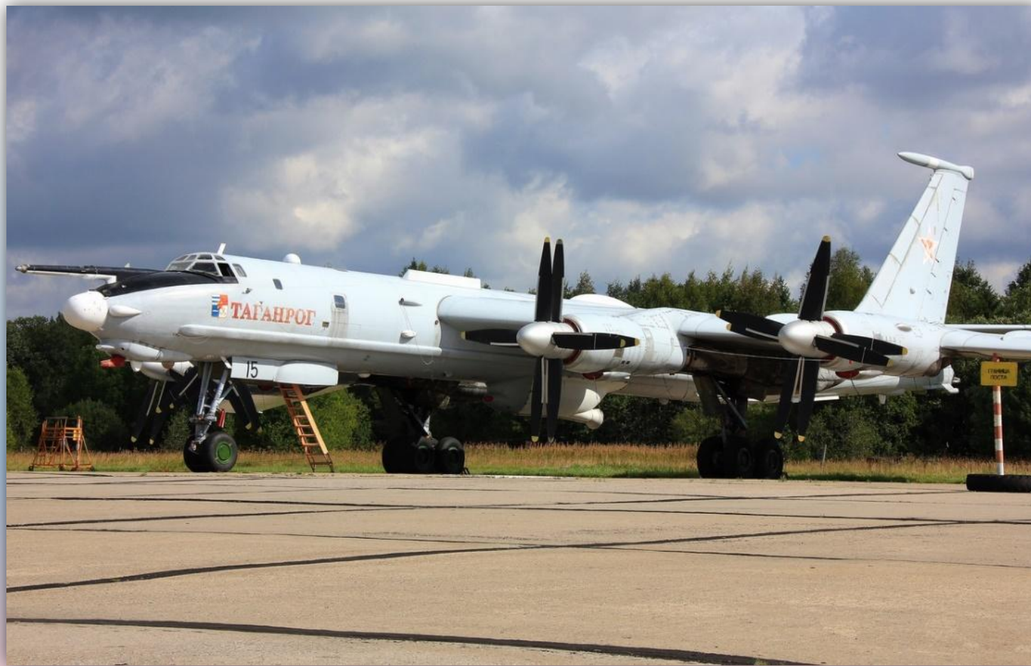
Фото: август 2014 года.

По состоянию на апрель 2016 года – летает .