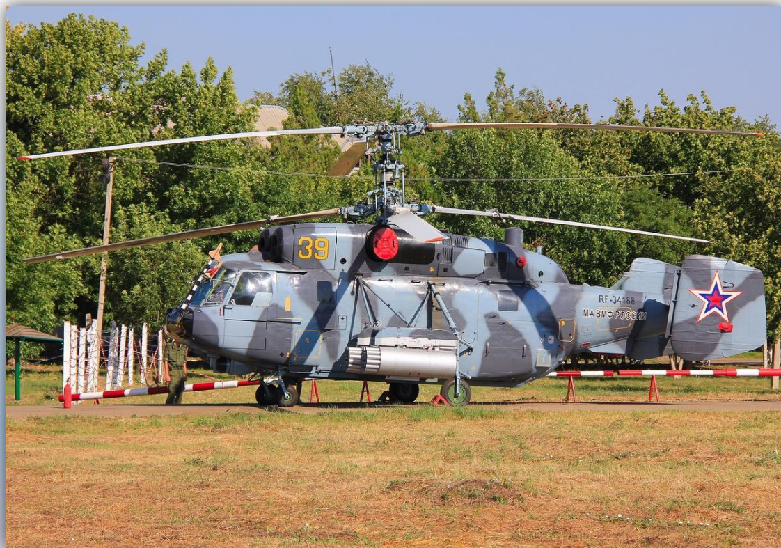
Фото: июль 2015 года.

Позывной – нет данных. По состоянию на апрель 2016 года – летает .