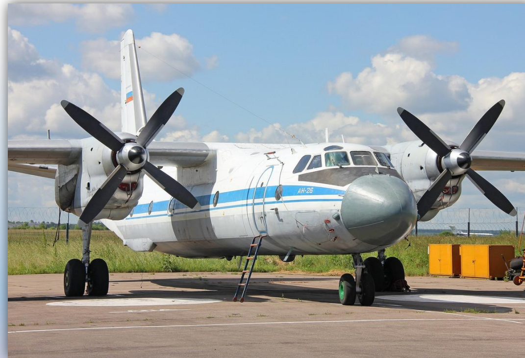
Фото: февраль 2014 года.