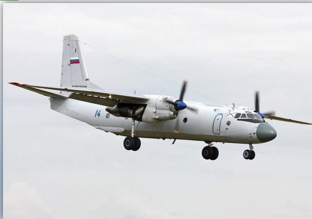
Фото: июнь 2014 года.