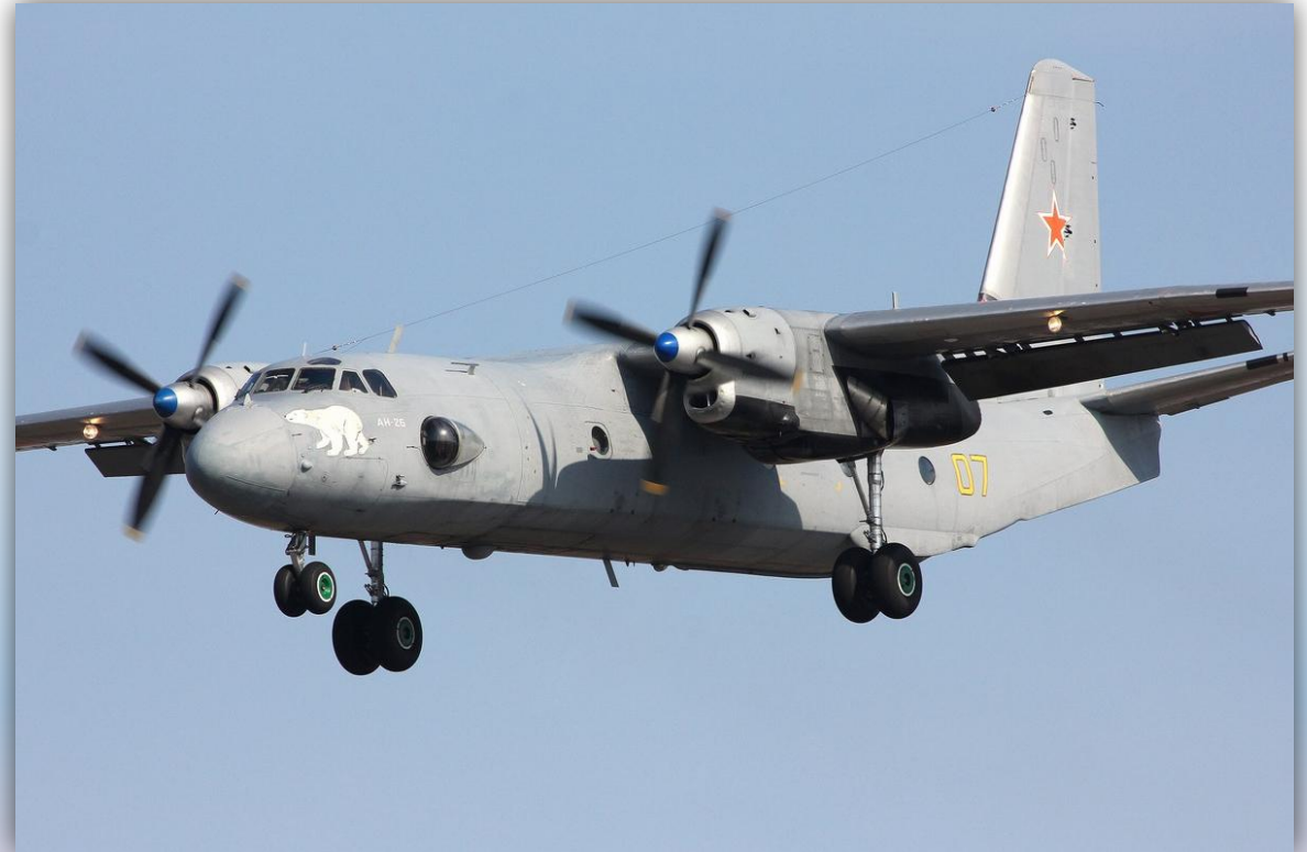
Фото: март 2014 года.