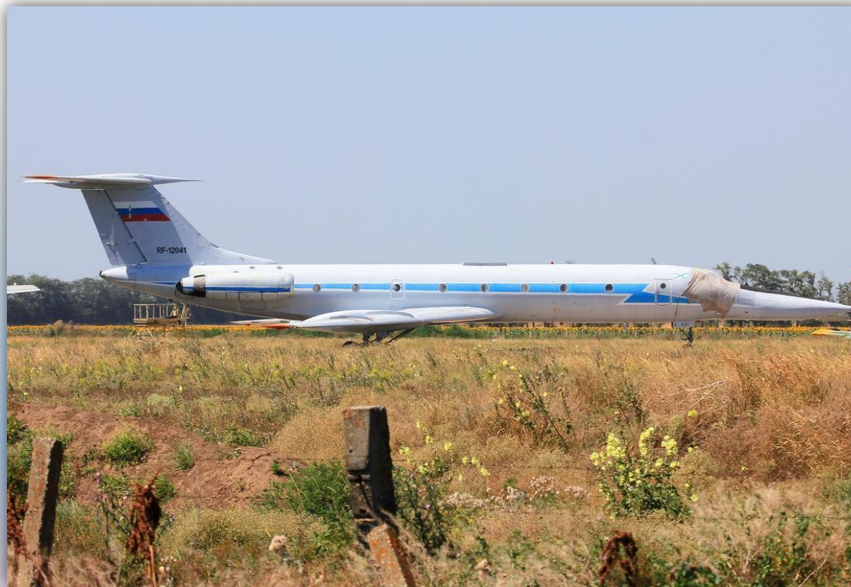
Фото: июль 2015 года.

Позывной – 64073 . Прежние номера: 31 синий , 16 красный , СССР-64073 . По состоянию на апрель 2016 года – летает .