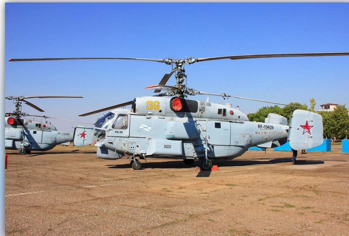
Фото: июль 2015 года.