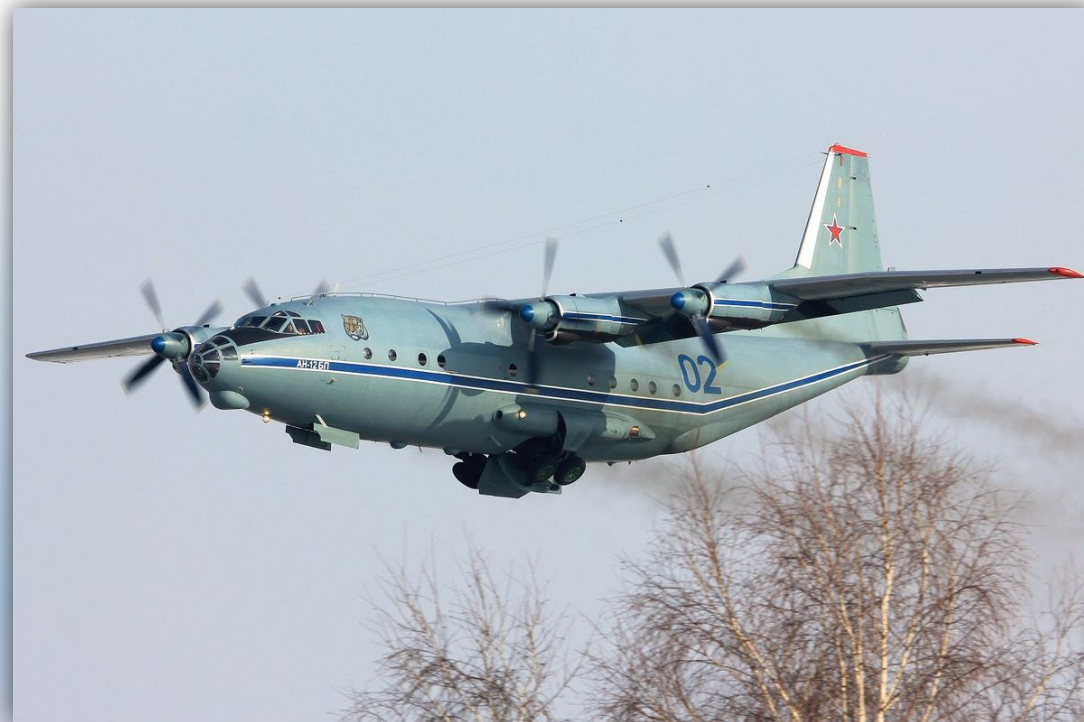
Фото: март 2015 года.