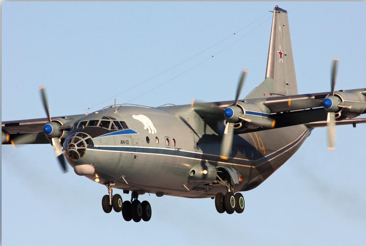
Фото: февраль 2015 года.

Позывной – 08395 . По состоянию на апрель 2016 года – летает .