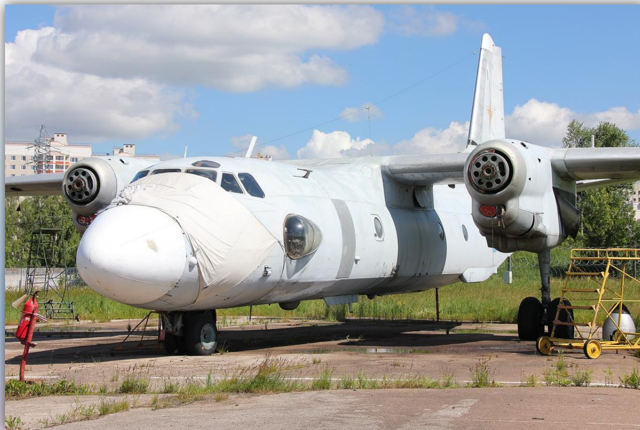
Фото: июнь 2013 года.

По состоянию на апрель 2016 года – на хранении .