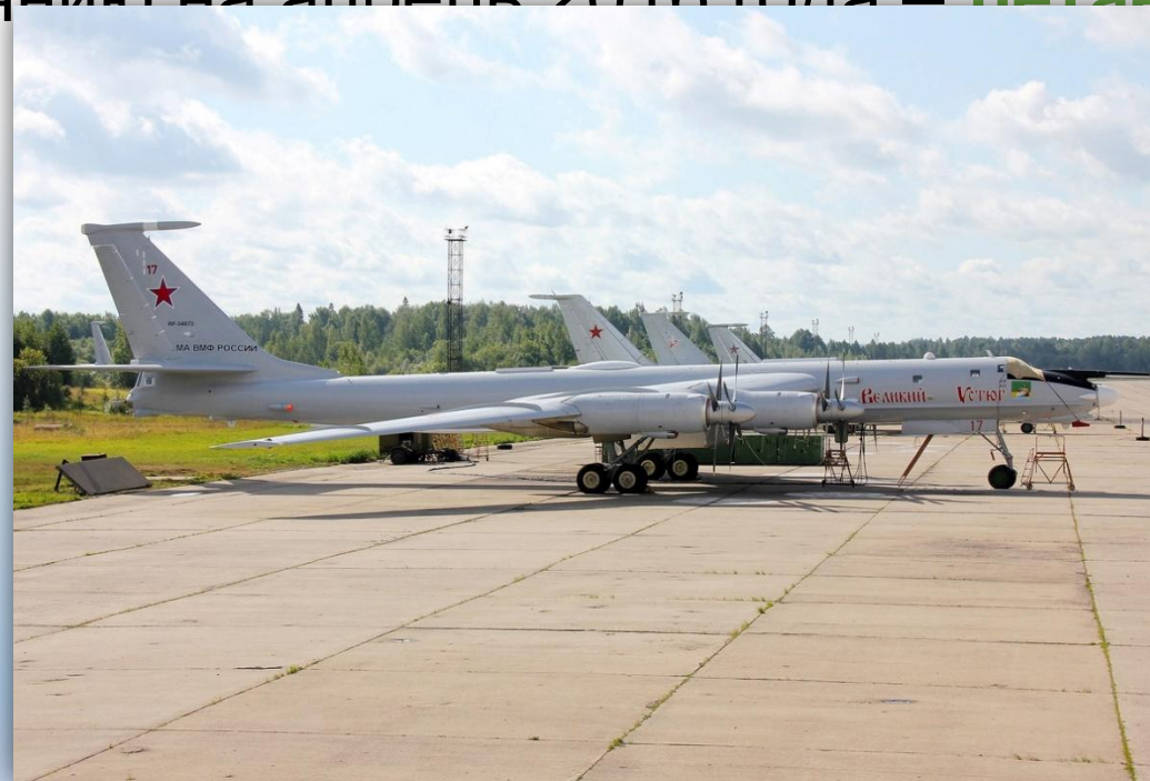
Фото: август 2014 года.