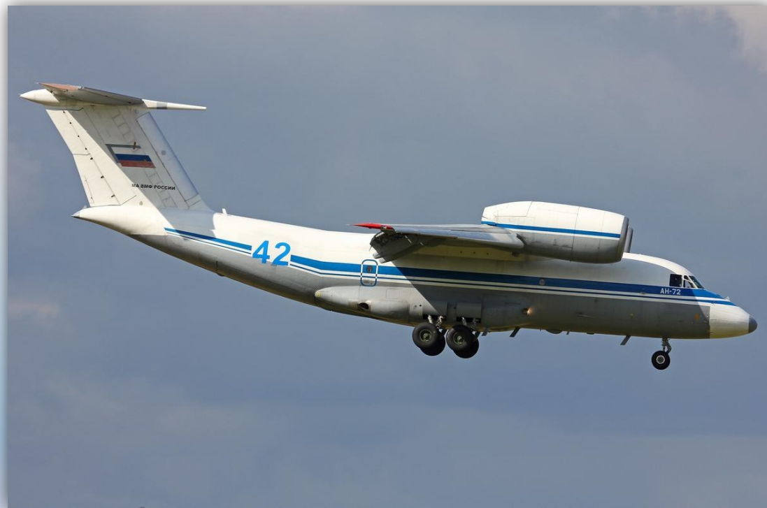
Фото: август 2015 года.