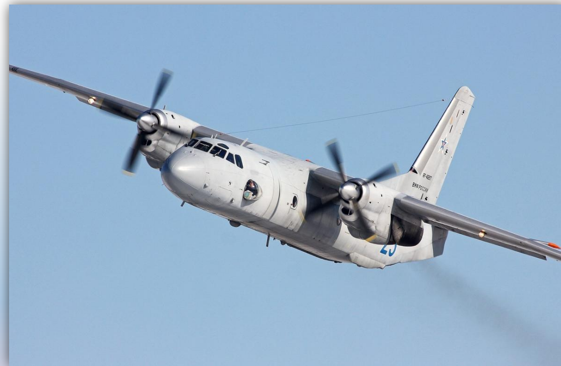
Фото: март 2016 года.