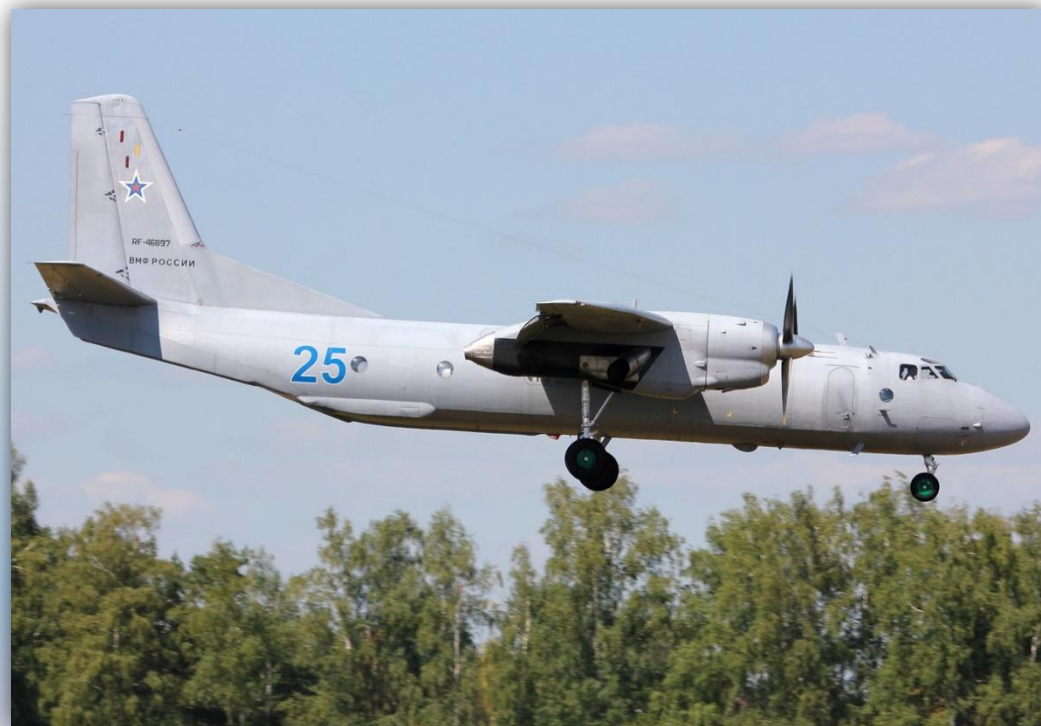
Фото: июль 2014 года.