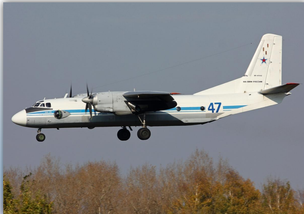
Фото: сентябрь 2015 года.