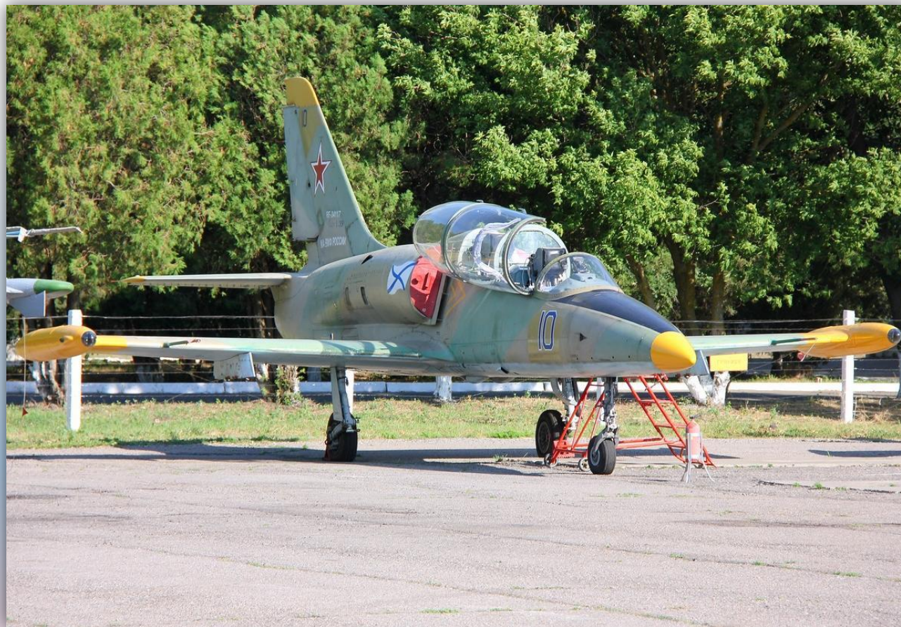
Фото: июль 2015 года.

Позывной – нет данных. По состоянию на апрель 2016 года – летает .