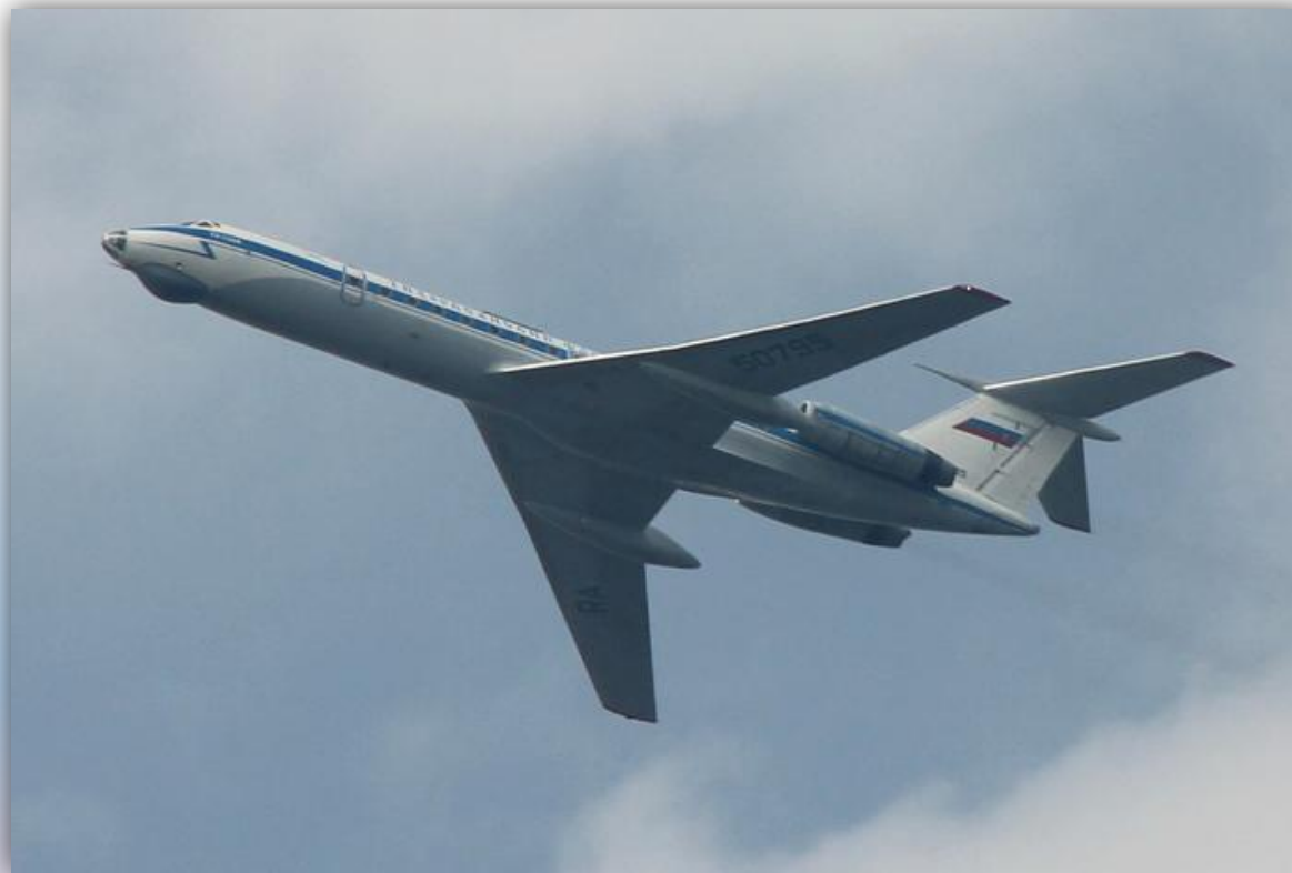
Фото: август 2012 года.

Позывной — 66002 . Прежний номер: RA-50795 , 02 синий . По состоянию на апрель 2016 года летает .