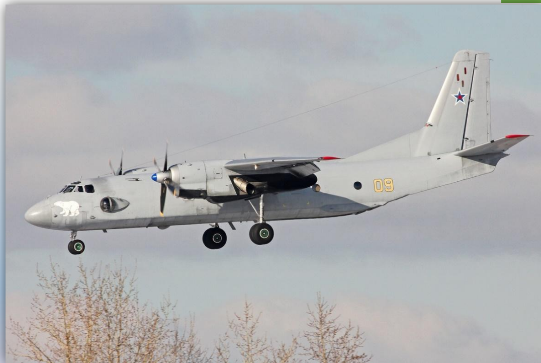
Фото: март 2016 года.

Позывные – 71574 и 71576 . По состоянию на апрель 2016 года – летает.