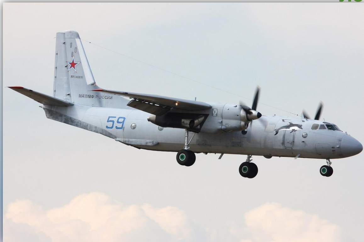
Фото: август 2014 года.

Позывные – 71587 , 71590 . По состоянию на апрель 2016 года – летает.