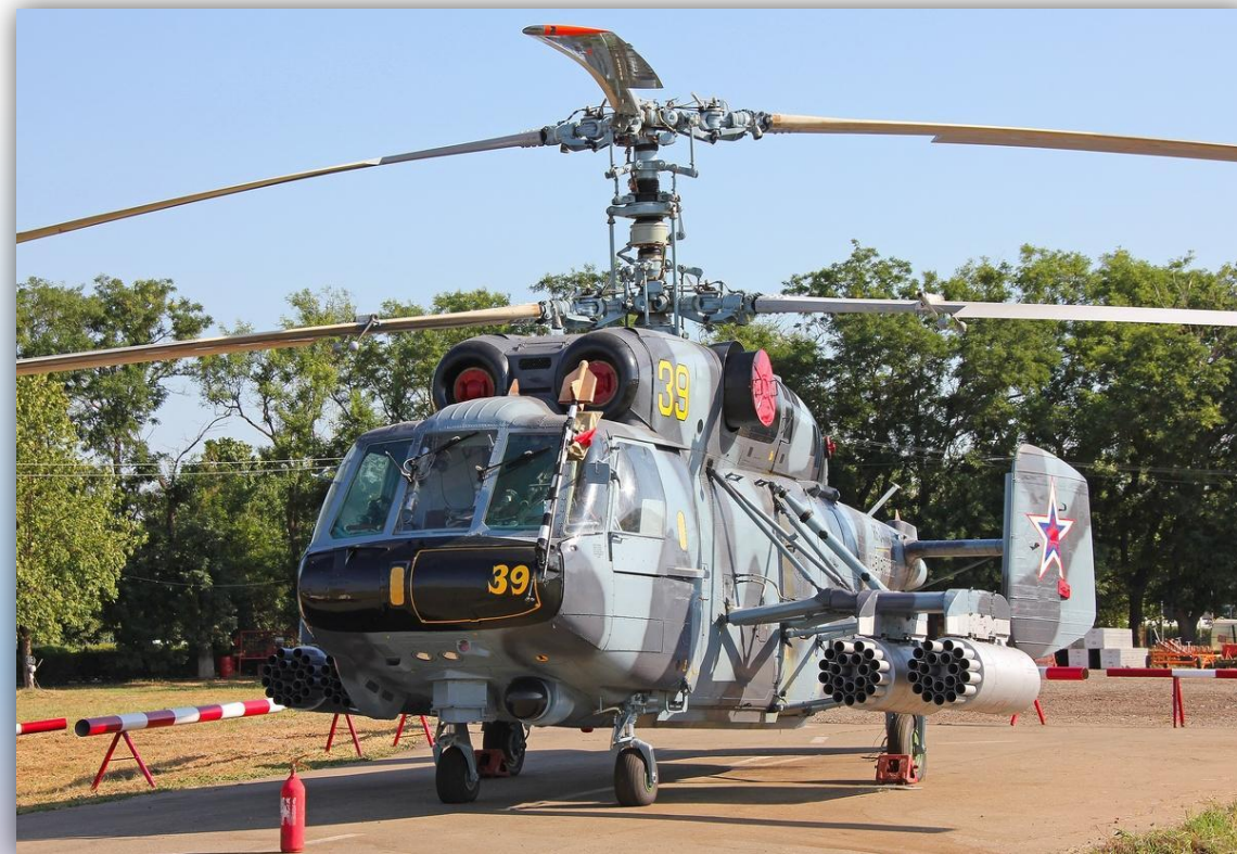
Фото: июль 2015 года.