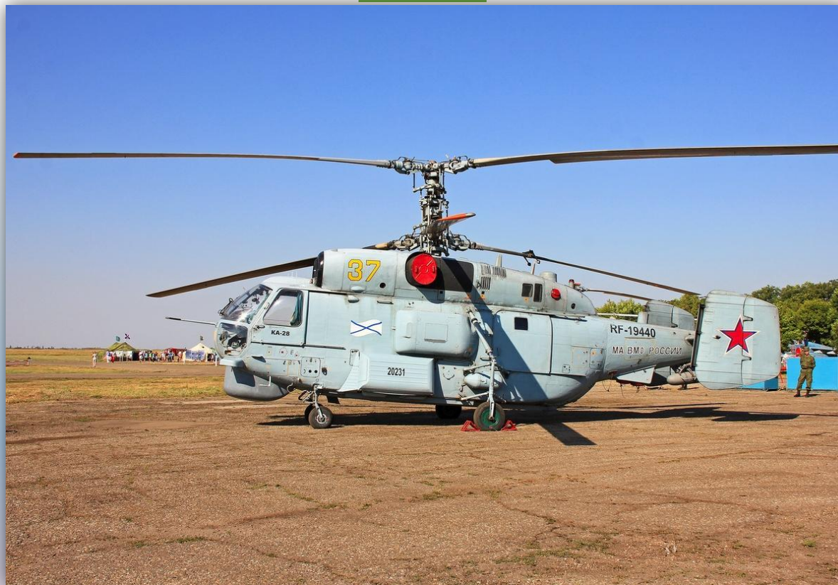
Фото: июль 2015 года.

Позывной — нет данных. Прежний номер: 20 желтый . По состоянию на апрель 2016 года — летает .