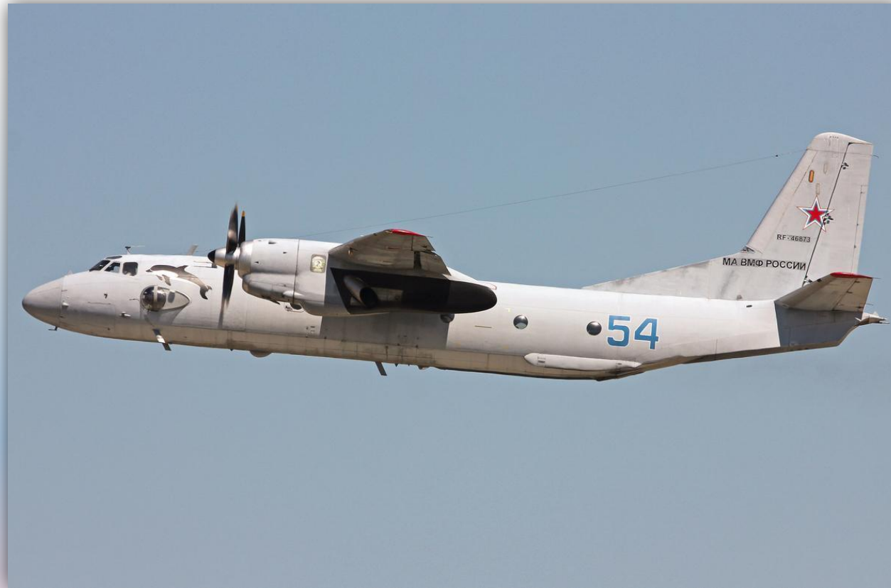
Фото: июль 2015 года.

Позывные – 71587 , 71590 . По состоянию на апрель 2016 года – летает .