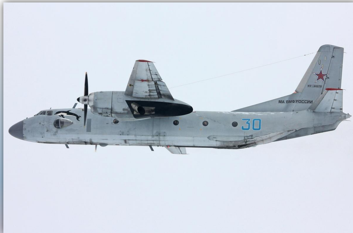
Фото: февраль 2015 года.