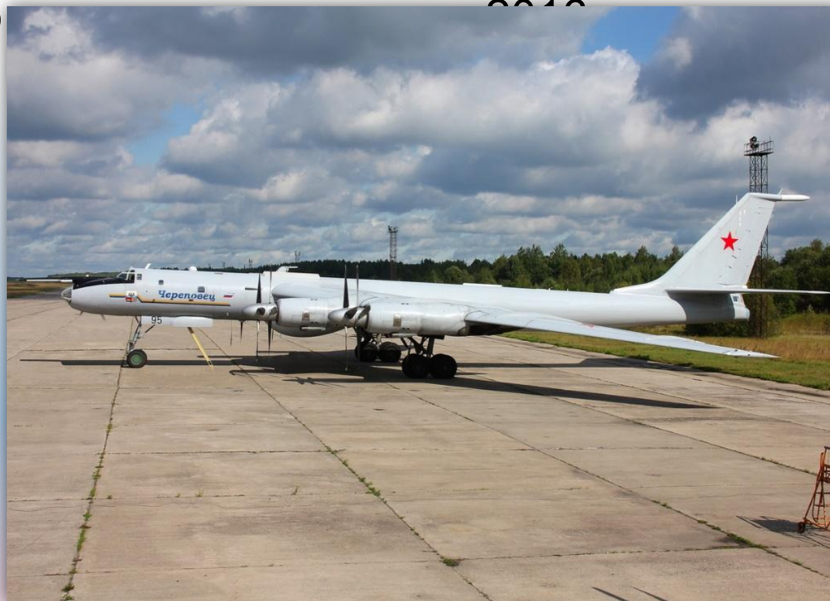
Фото: август 2014