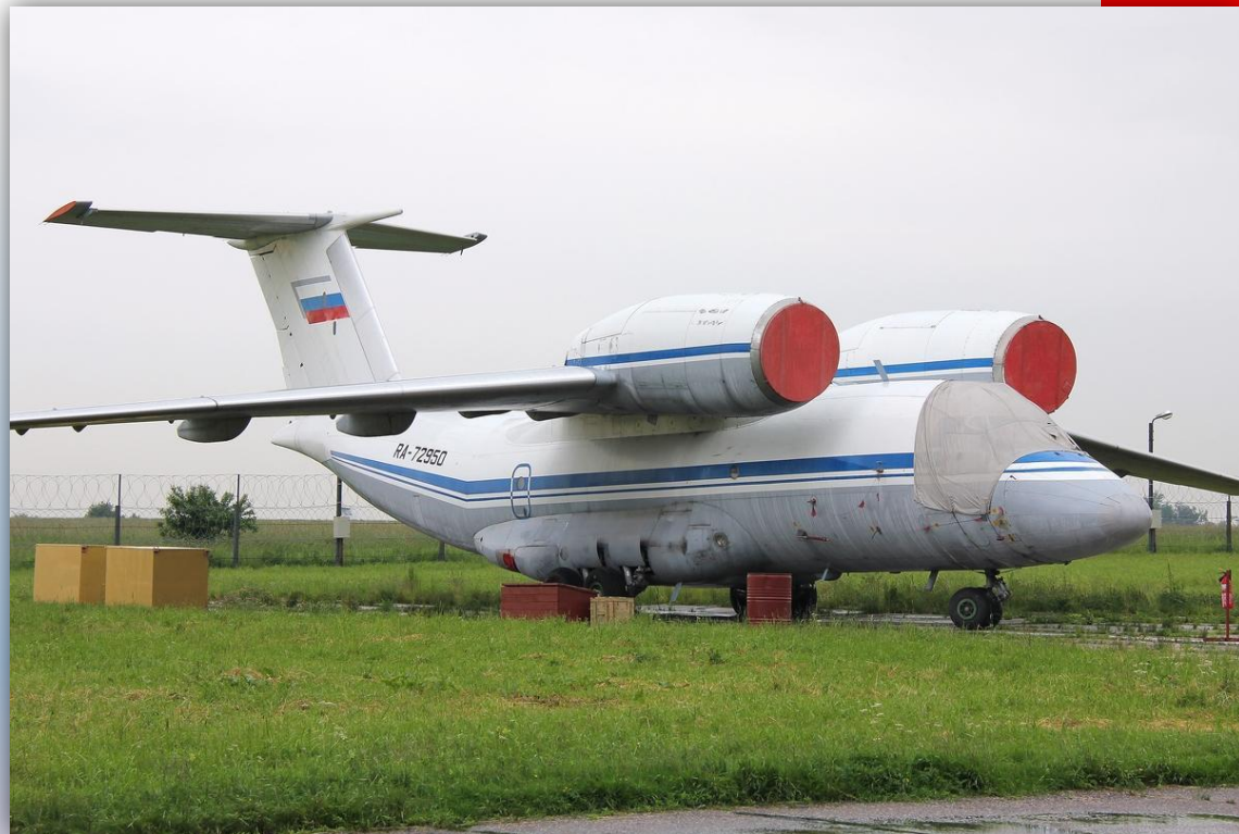
Фото: июнь 2012 года.