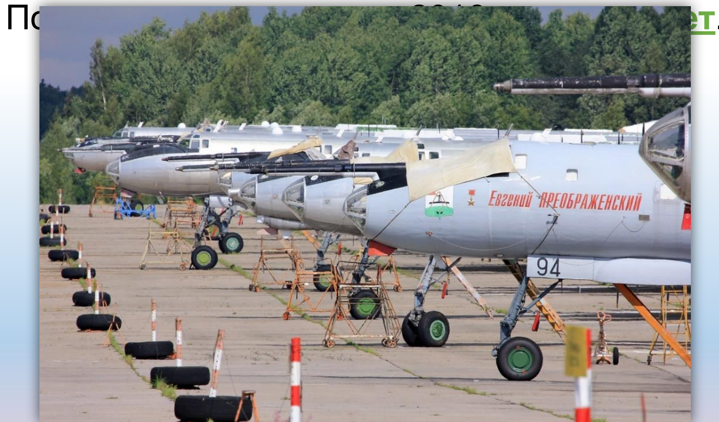
Фото: август 2014 года.