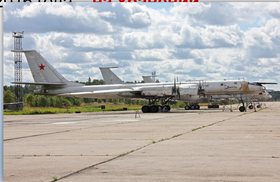
Фото: август 2014 года.