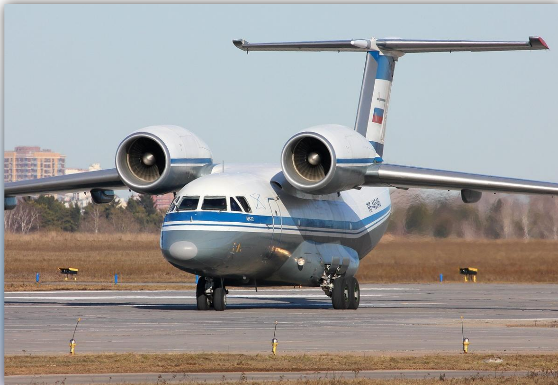
Фото: март 2015 года.