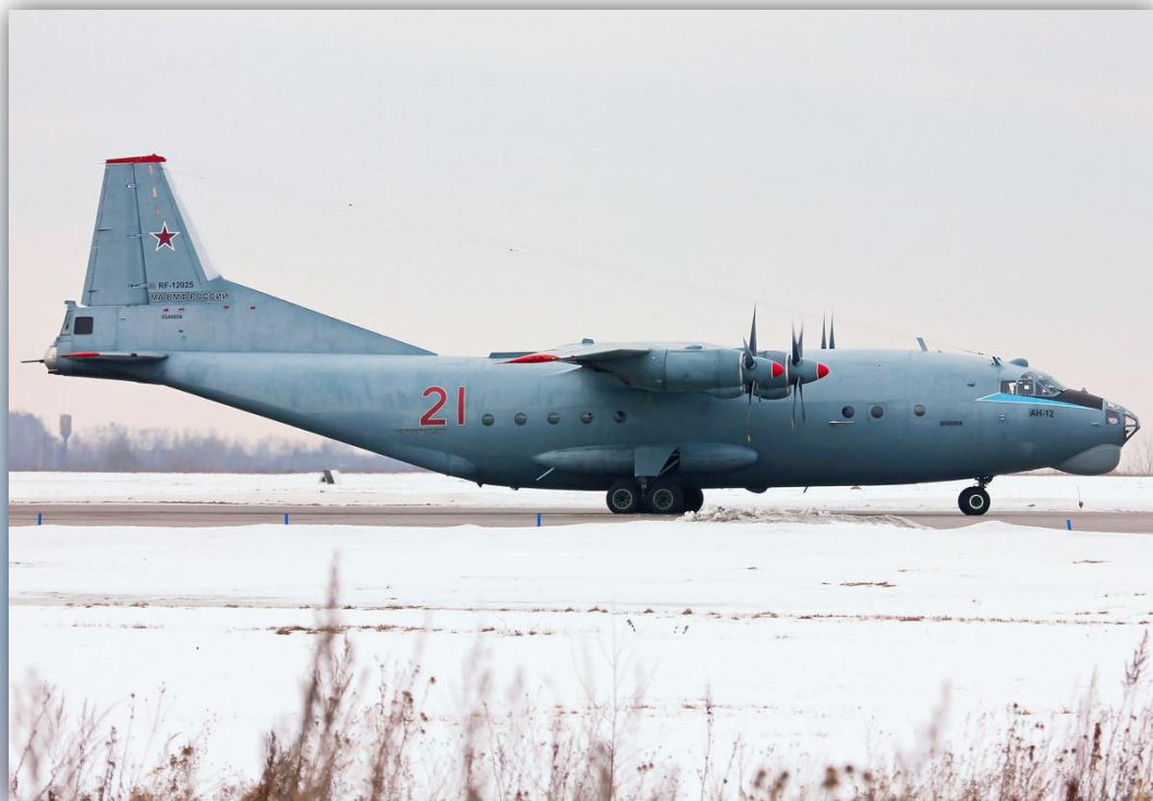
Фото: февраль 2016 года.

Позывной — нет данных . По состоянию на апрель 2016 года —