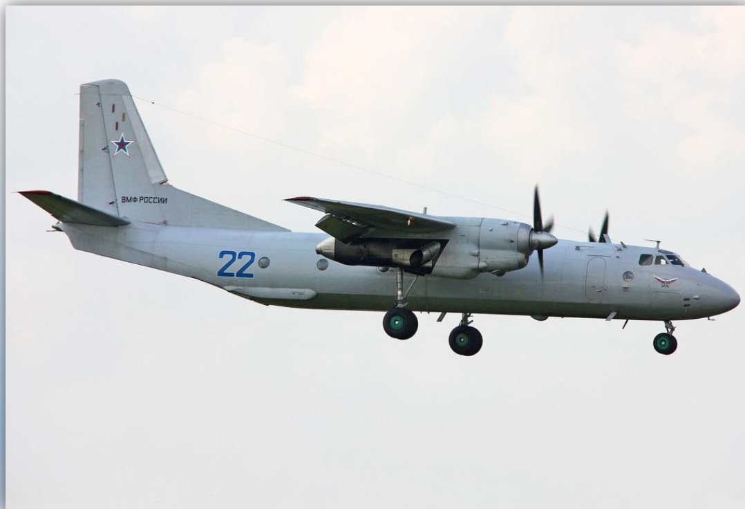
Фото: июнь 2013 года.

Позывные – 02203 , 02204 , 63801 , 63804 . По состоянию на апрель 2016 года – летает .