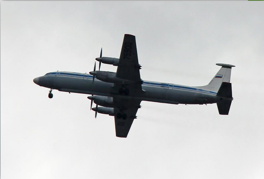
Фото: май 2011 года.

Позывной: 75040 . Прежние номера: RA-75900 , СССР-75900 . По состоянию на апрель 2016 года – летает .