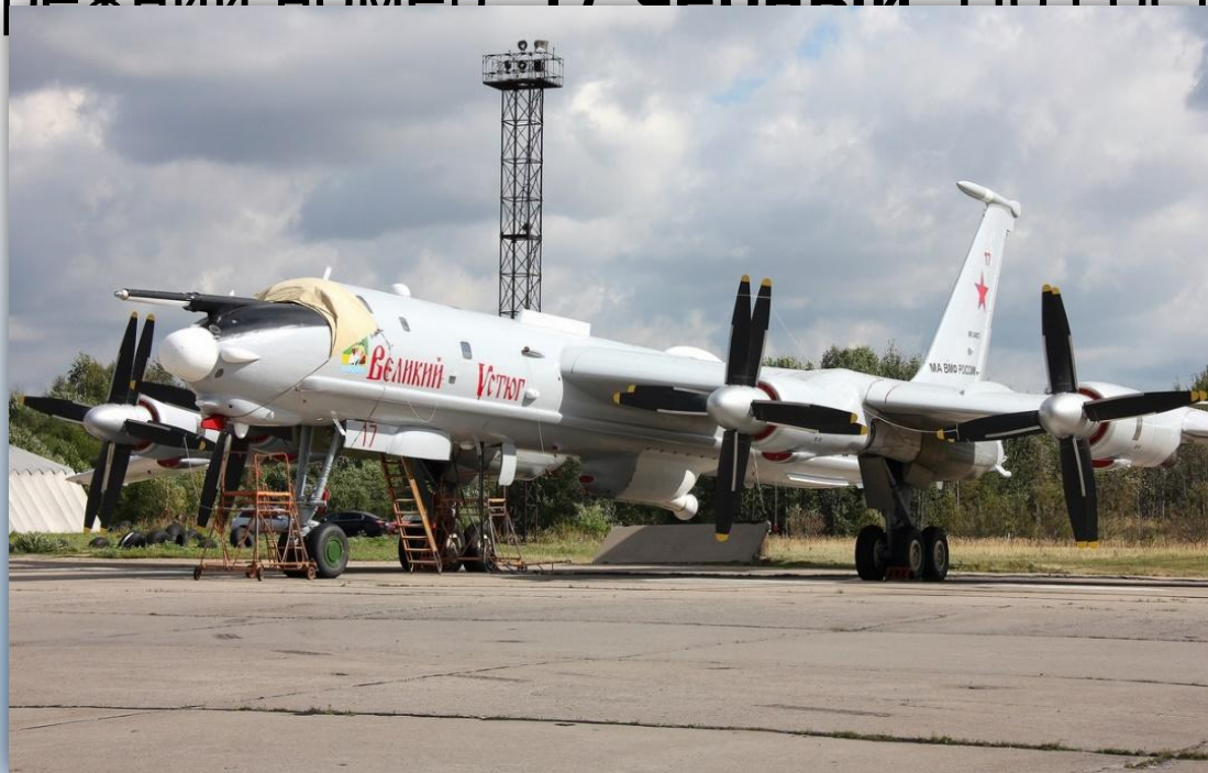
Фото: август 2014 года.

Прежний номер: 17 черный . По состоянию на апрель 2016 года — летает .