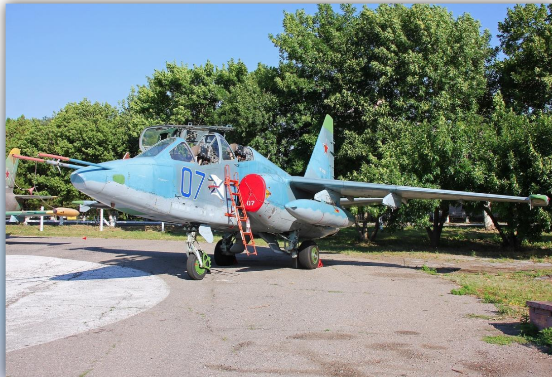
Фото: июль 2015 года.

Позывной – нет данных. Прежний номер: 03 желтый . По состоянию на апрель 2016 года – летает.