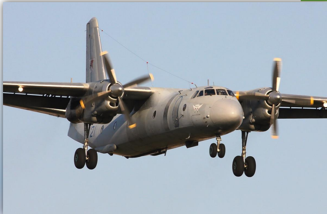
Фото: август 2014 года.

Позывные – 02203 , 02204 , 63801 , 63804 . По состоянию на апрель 2016 года – летает.