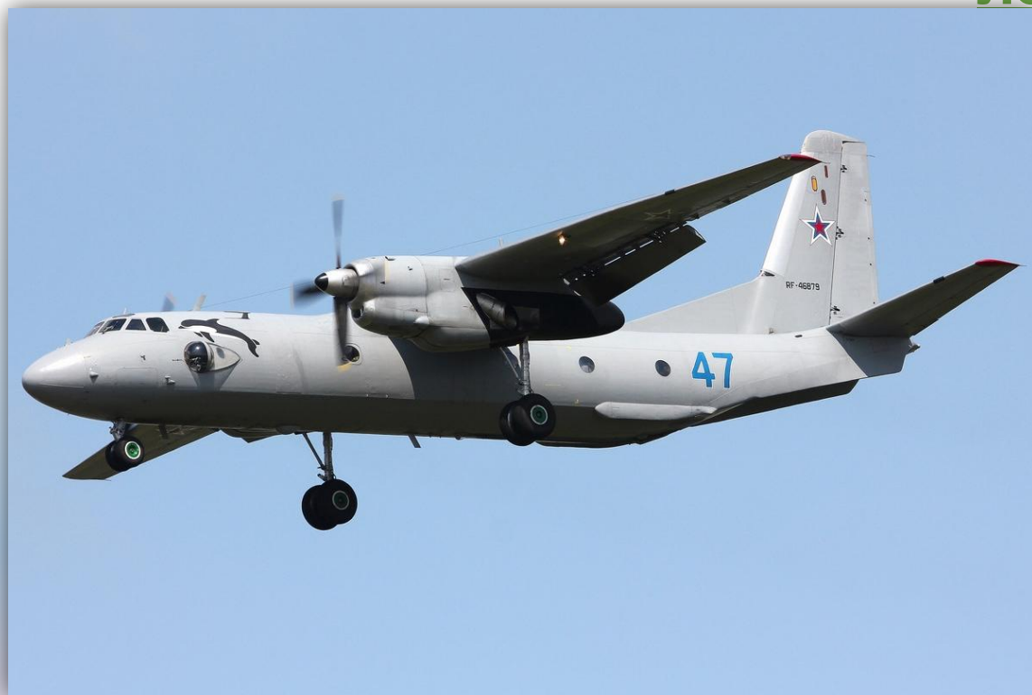
Фото: июль 2014 года.

Позывные – 71587 , 71590 . По состоянию на апрель 2016 года – летает.