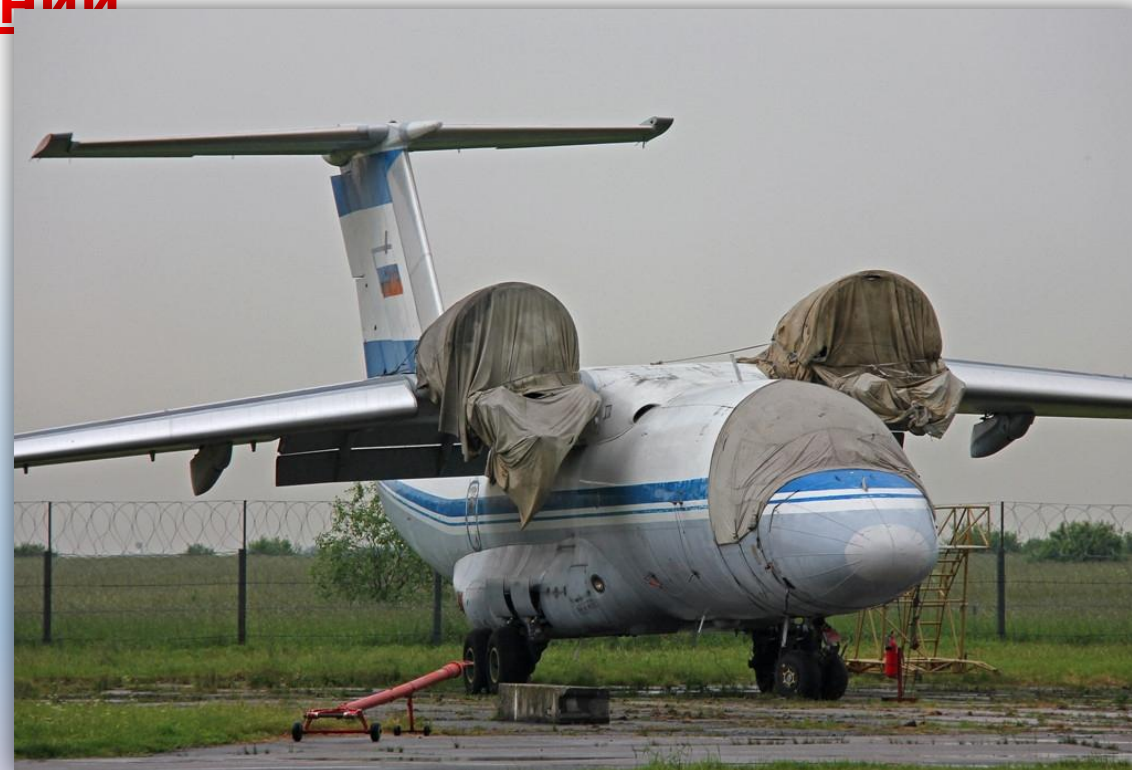
Фото: июнь 2012 года.