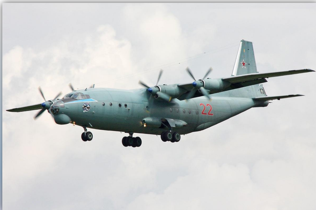
Фото: июнь 2013 года.

Позывной – нет данных . По состоянию на апрель 2016 года –