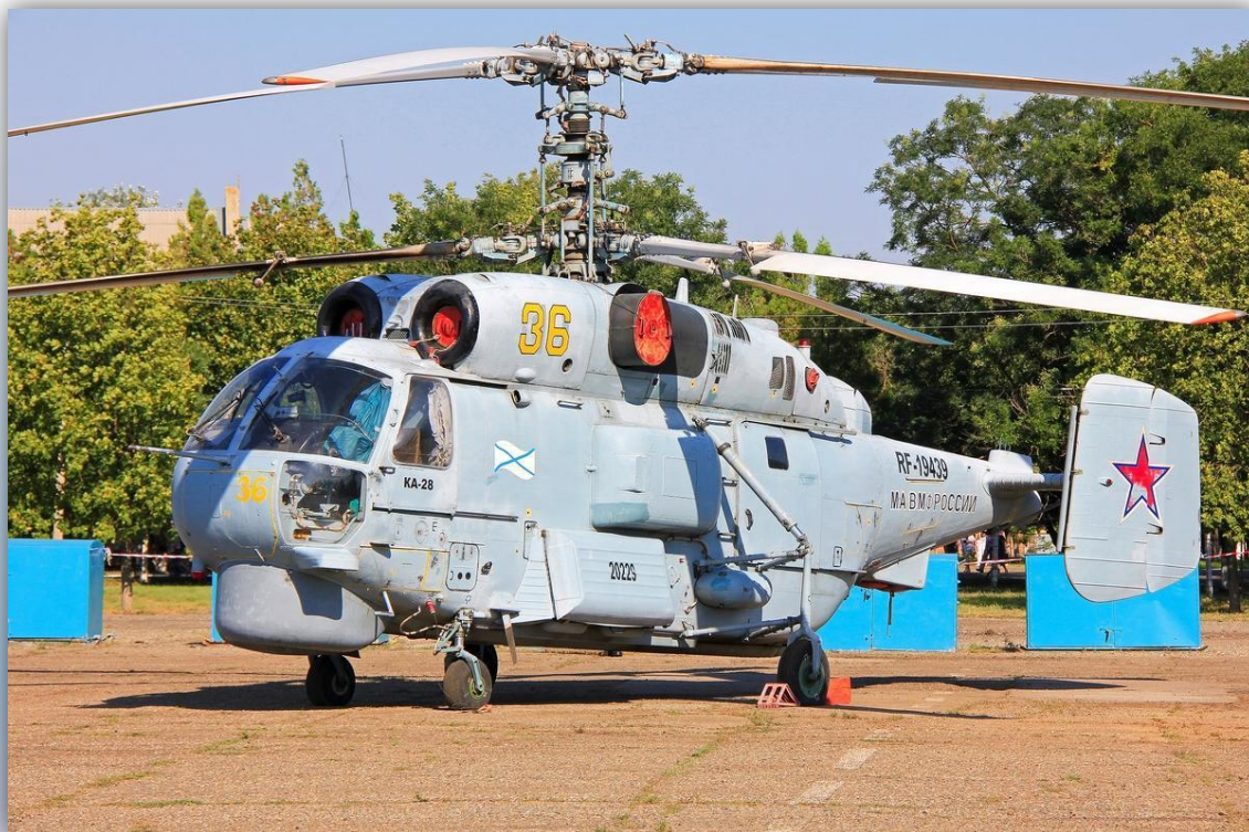
Фото: июль 2015 года.

Позывной – нет данных. Прежний номер: 19 желтый . По состоянию на апрель 2016 года – летает .