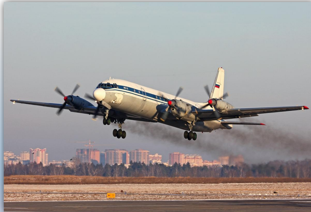
Фото: ноябрь 2015 года.