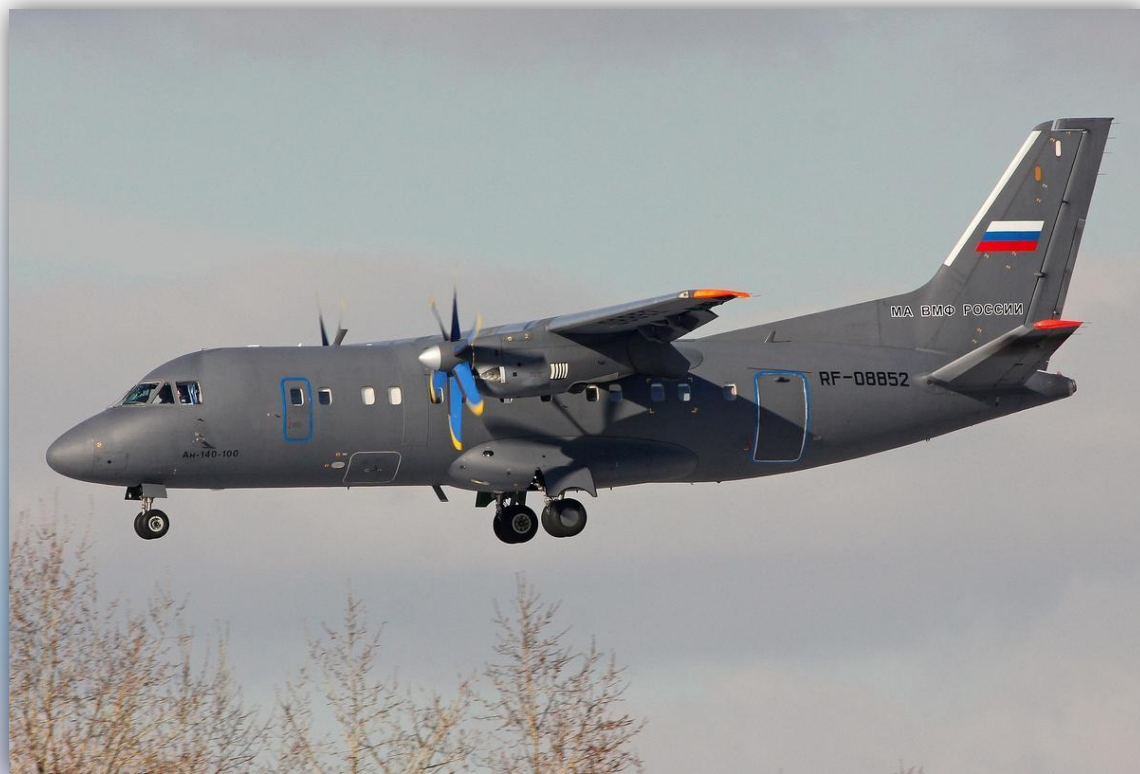
Фото: март 2016 года.

Позывной — 08852 . По состоянию на апрель 2016 года — летает .