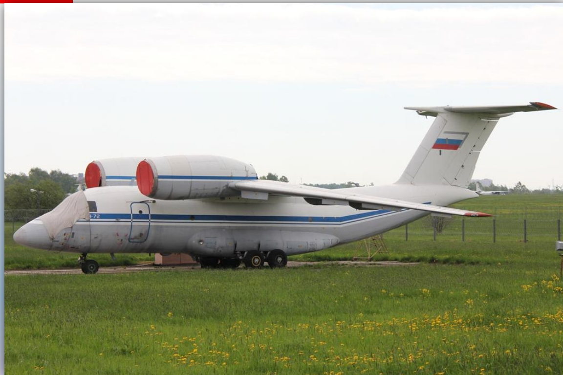
Фото: май 2011 года.