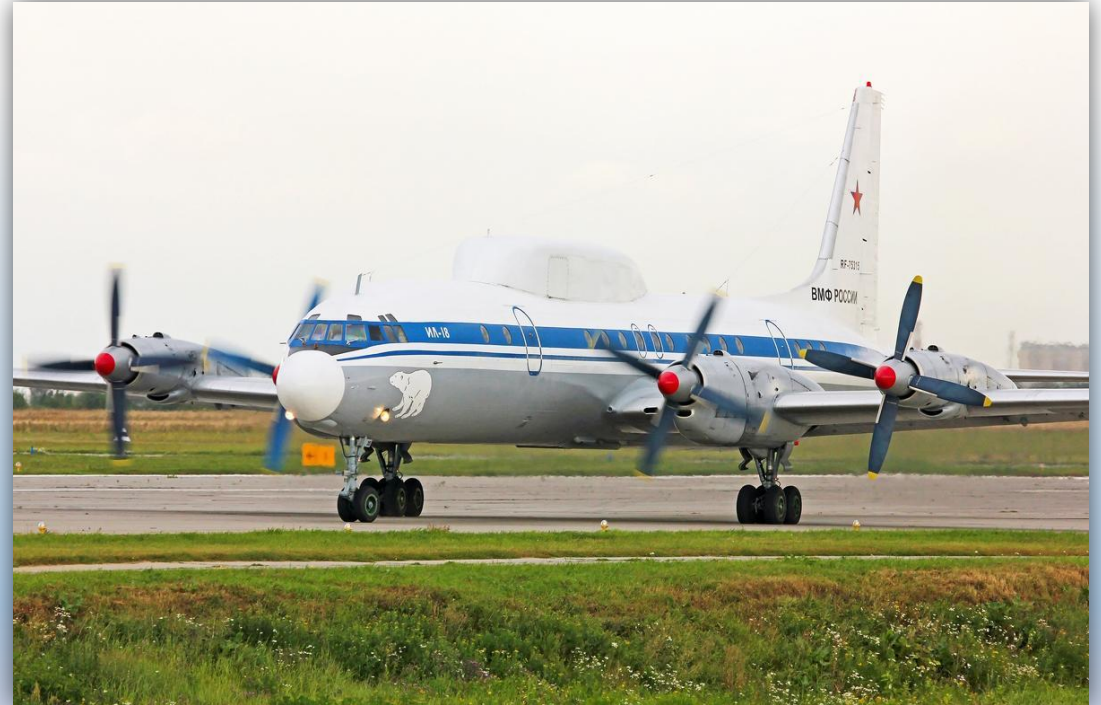
Фото: август 2015 года.