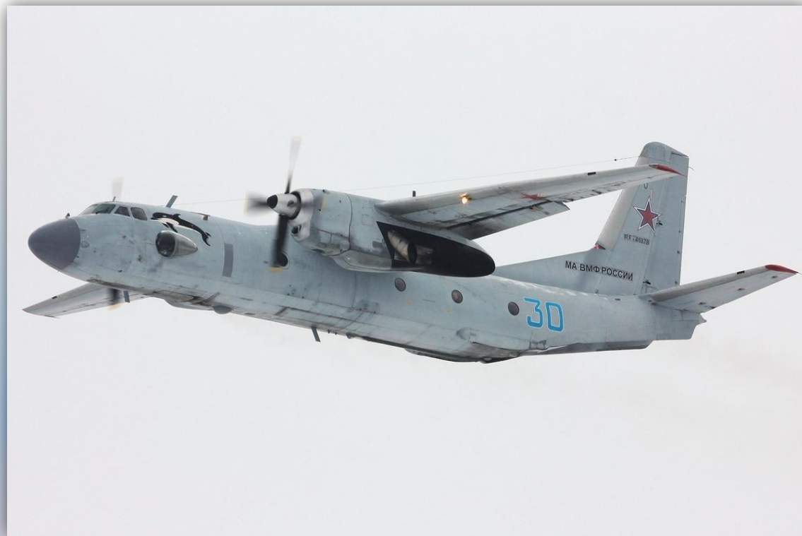
Фото: февраль 2015 года.

Позывные – 71587 , 71590 . Прежний номер: 39 синий . По состоянию на апрель 2016 года – летает .