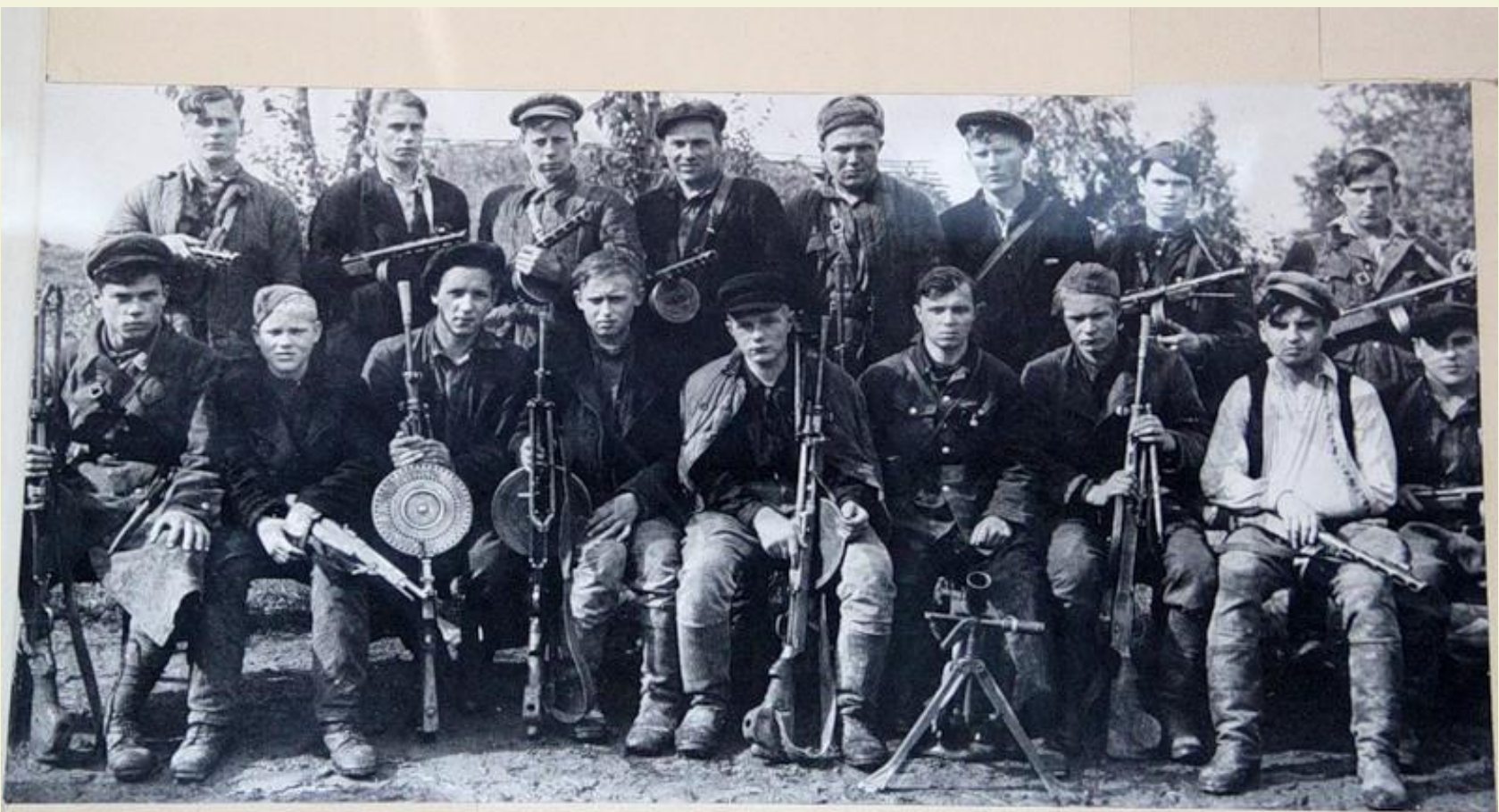
Группа комсомольцев-партизан, действовавших в тылу врага на территории Ленинградской области.