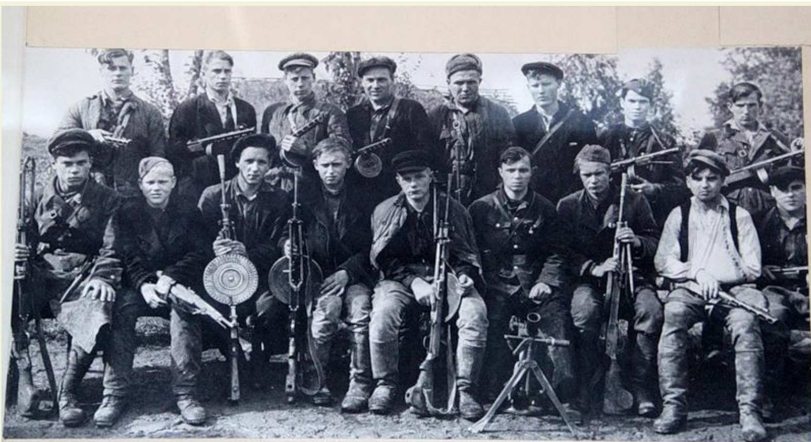
Группа комсомольцев-партизан, действовавших в тылу врага на территории Ленинградской области.