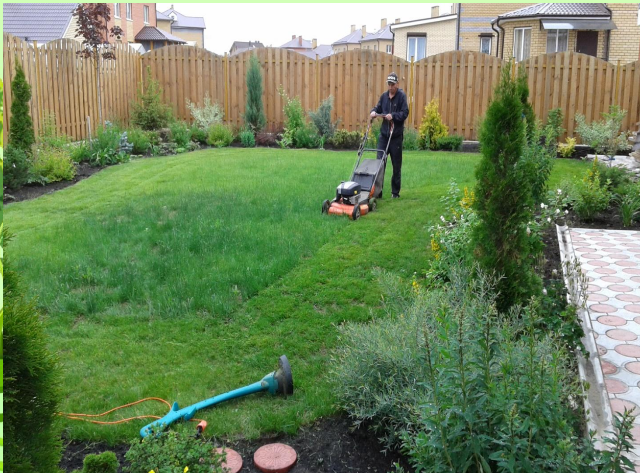
п. Ореховка. Стрижка газона по вызову