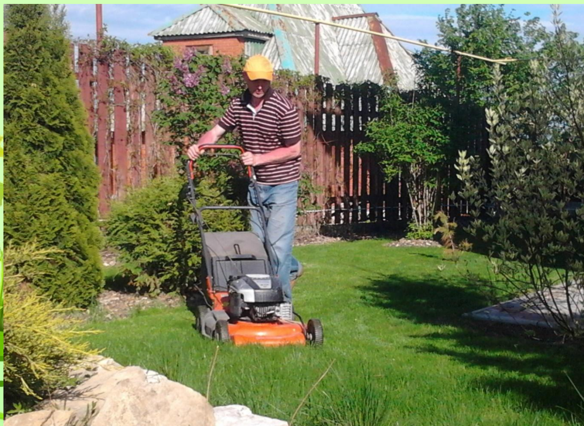
п. Щербаково. Уход за газоном