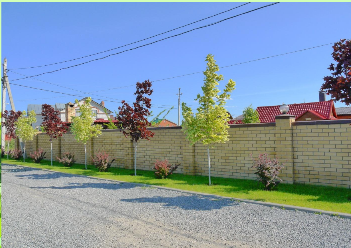
п. Щербаково. Комплексный уход за участком