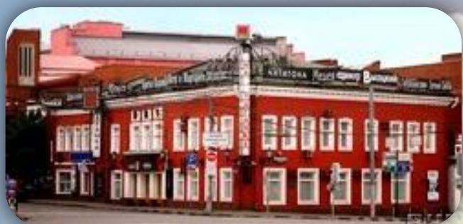
Театр на Таганке