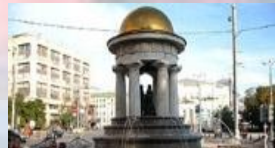
ФОНТАН «ПУШКИН И НАТАЛИ»