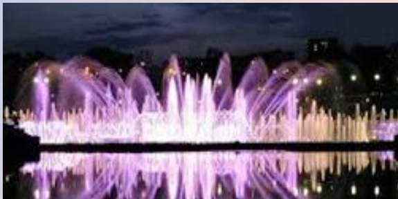
ФОНТАН В ЦАРИЦЫНО