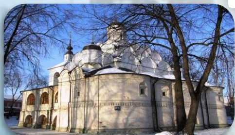
ХРАМ ПРЕСВЯТОЙ БОГОРОДИЦЫ