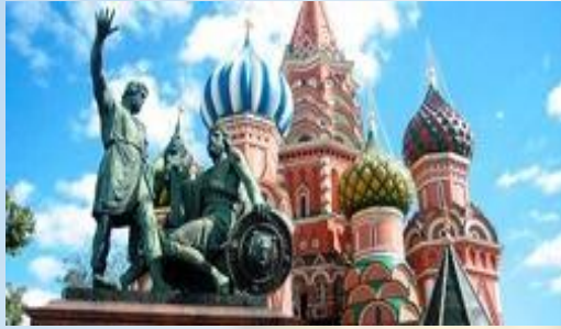
Памятник Минину и Пожарскому