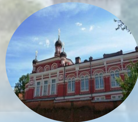
БОГОРОДИЦЕ- РОЖДЕСТВЕНСКИЙ МОНАСТЫРЬ