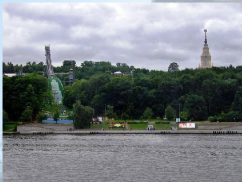
Парк на «Воробьевых горах»