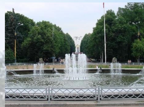
Парк «Сокольники »