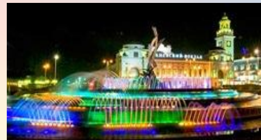
ФОНТАН ПЕРЕД КИЕВСКИМ ВОКЗАЛОМ