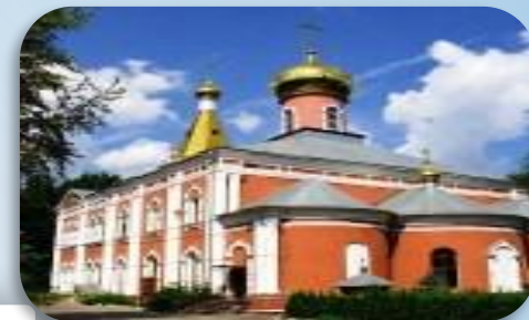
ХРАМ ВОСКРЕСЕНИЯ ХРИСТОВА