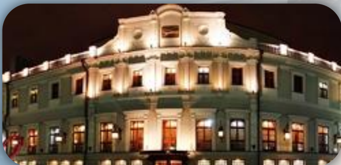
МХТ им. Чехова