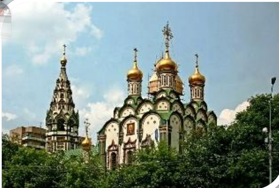
ХРАМ НИКОЛАЯ ЧУДОТВОРЦА