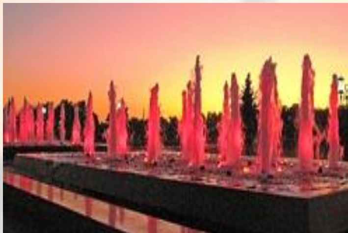
ФОНТАН В ПАРКЕ ПОБЕДЫ