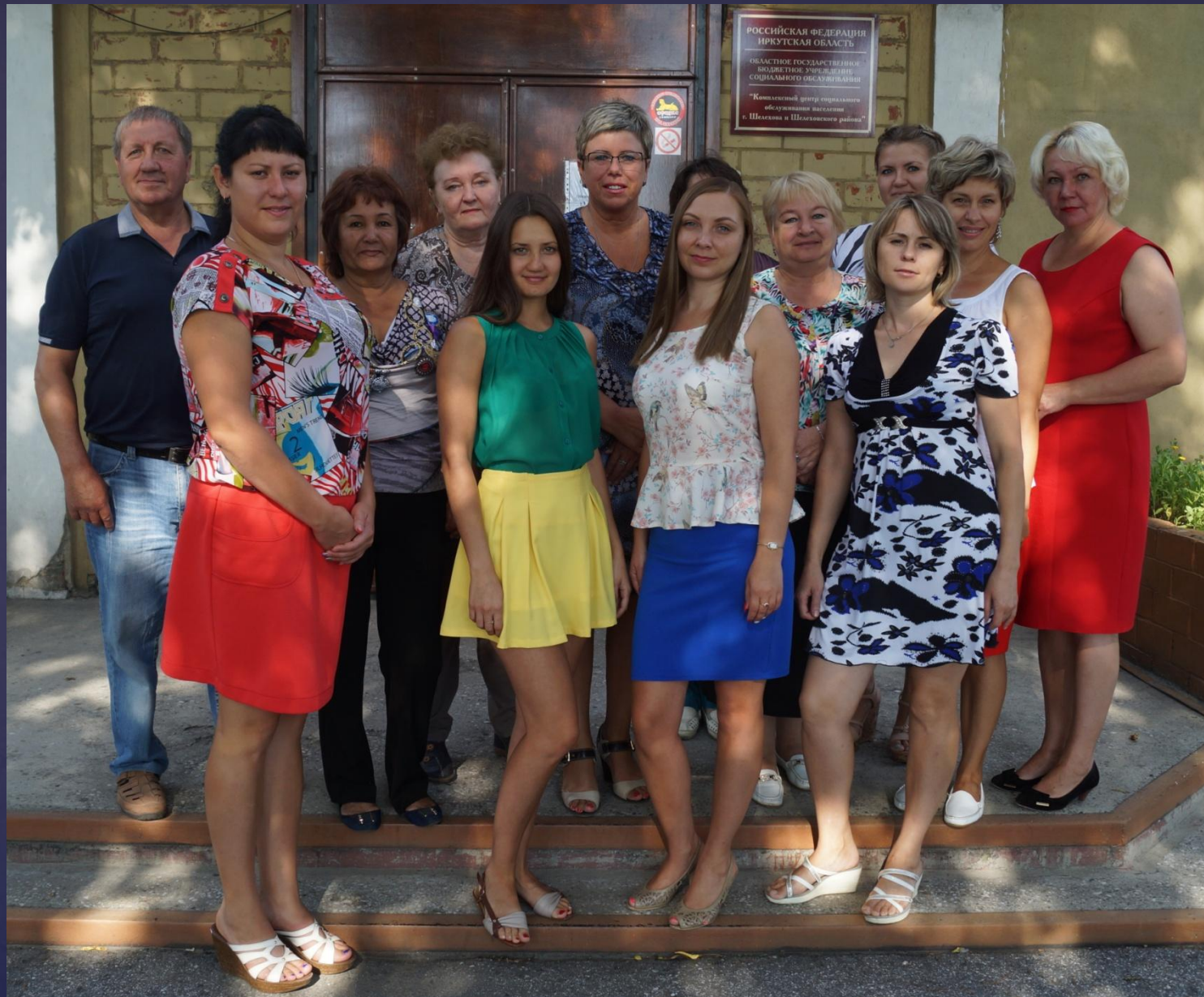
Коллектив ОГБУСО «КЦСОН г.Шелехова и Шелеховского района»