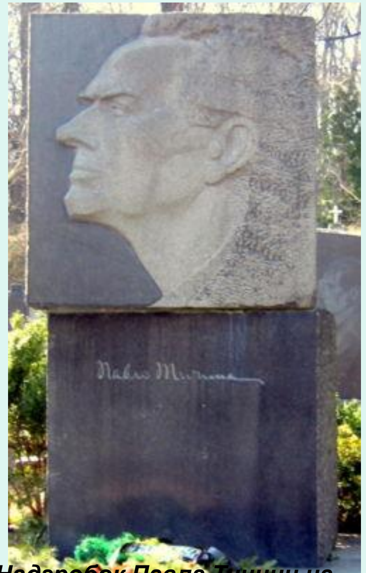
Надгробок Павла Тичини на Байковому цвинтарі Байковому цвинтарі в Києві