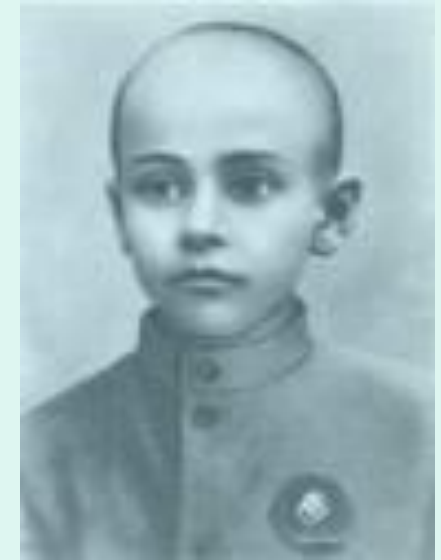
Павло Тичина, 1901 рік

Павло Тичина народився в селі Піски на Чернігівщині 23 січня 1891 р. (традиційна дата 27 січня є датою хрещення, так записано в знайденому в Київському міському архіві в справах Комерційного інституту виписці з церковної книги), був сьомою дитиною сільського дяка Григорія.