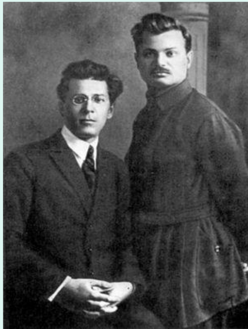
Павло Тичина та Євген Тичина. 1929 рік