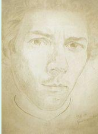
Автопортрет, 1922 рік