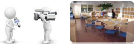
Помещения для сопровождающих участников ГИА