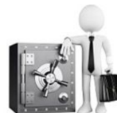
Помещение для руководителя ППЭ, оборудованное рабочим местом и сейфом