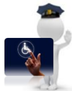
Пункт охраны правопорядка