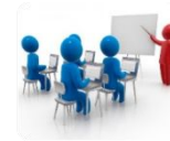
Аудитории для участников ГИА, в том числе для участников с ОВЗ (на 1 этаже)