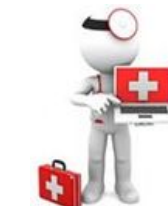
Помещение для медицинских работников