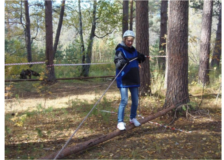
Вот какие мы ловкие