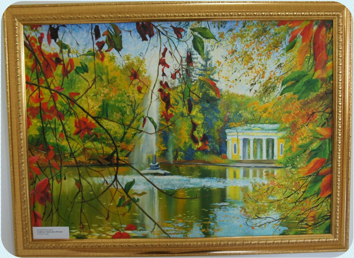
Наталья Рыжикова Соборная. Листопадное Флора. масло, 2018.