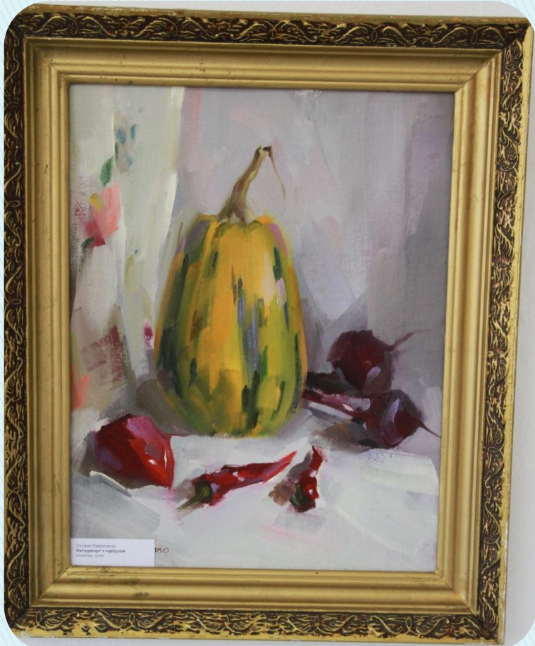
Дмитрий Савицкий Помидоры и перцы 1900, холст