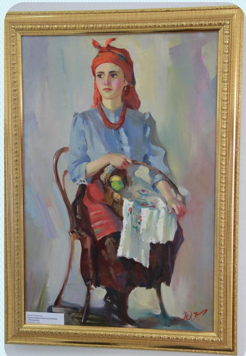
Михаил Врубель Женщина в традиционной одежде 1907, холст