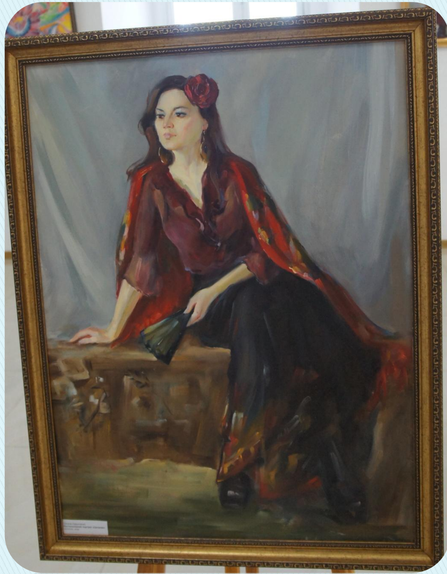
Portrait of a woman in a red and black dress, with a red rose in her hair. The painting is by [unreadable] and is part of the collection of the [unreadable] Museum.