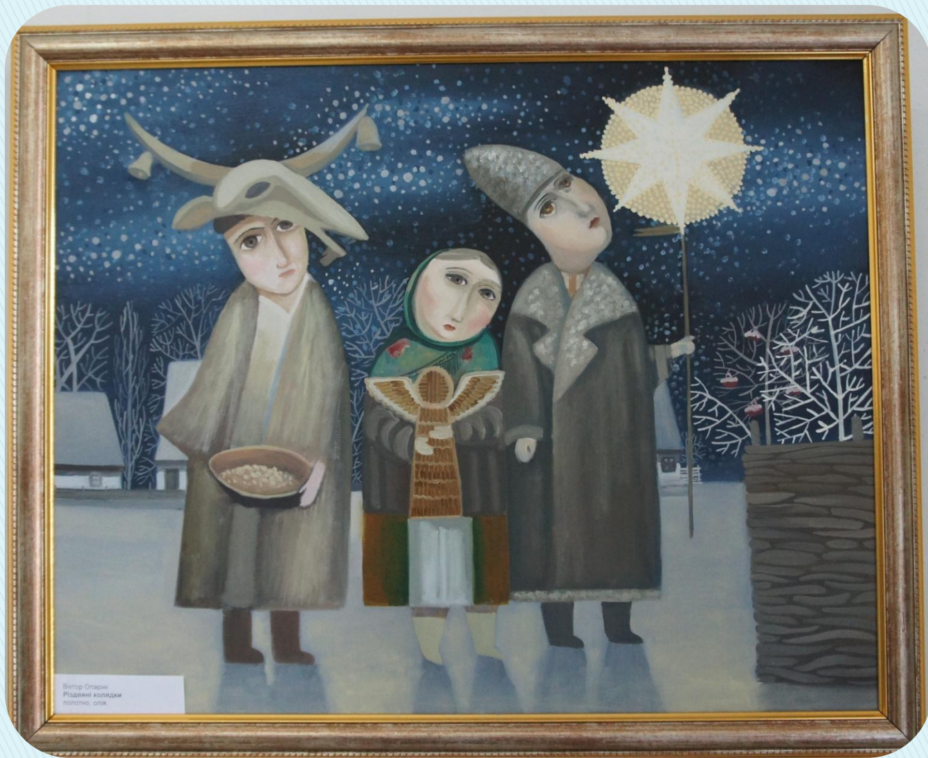
Виктор Свірський Рівяні колядки полотно, олія