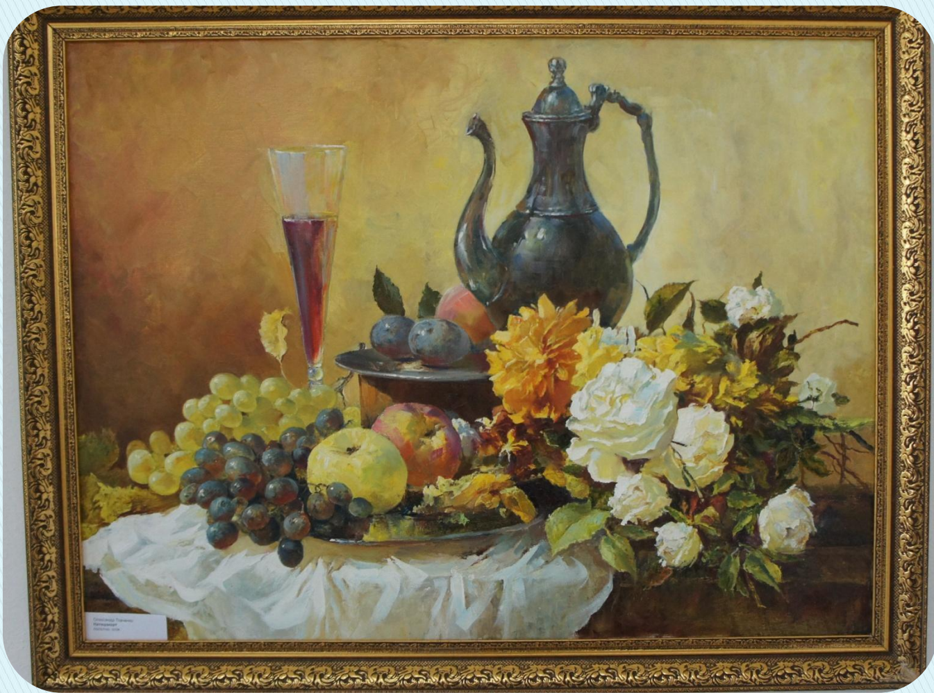
Carl Gustav Bruner Still life with flowers and fruit