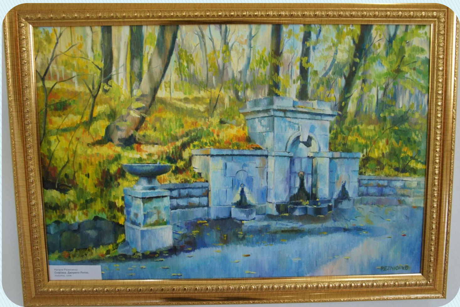
Марица Ризничева Софийка. Джерело Лотос. масло, олія