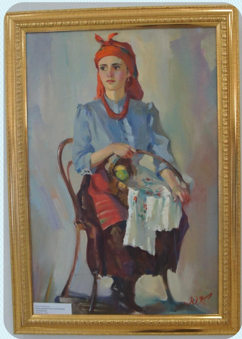
Э.И. Сидоров Женщина в традиционной одежде 1907 г.