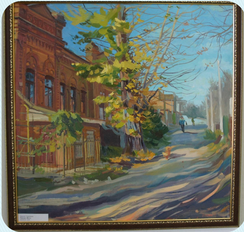
Street Scene Oil on Canvas 1900