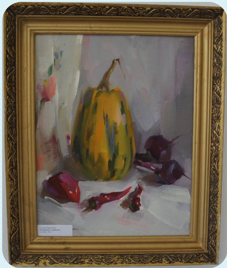
Оскан Лаврентьев Наполеон и гербула попраны, 1916