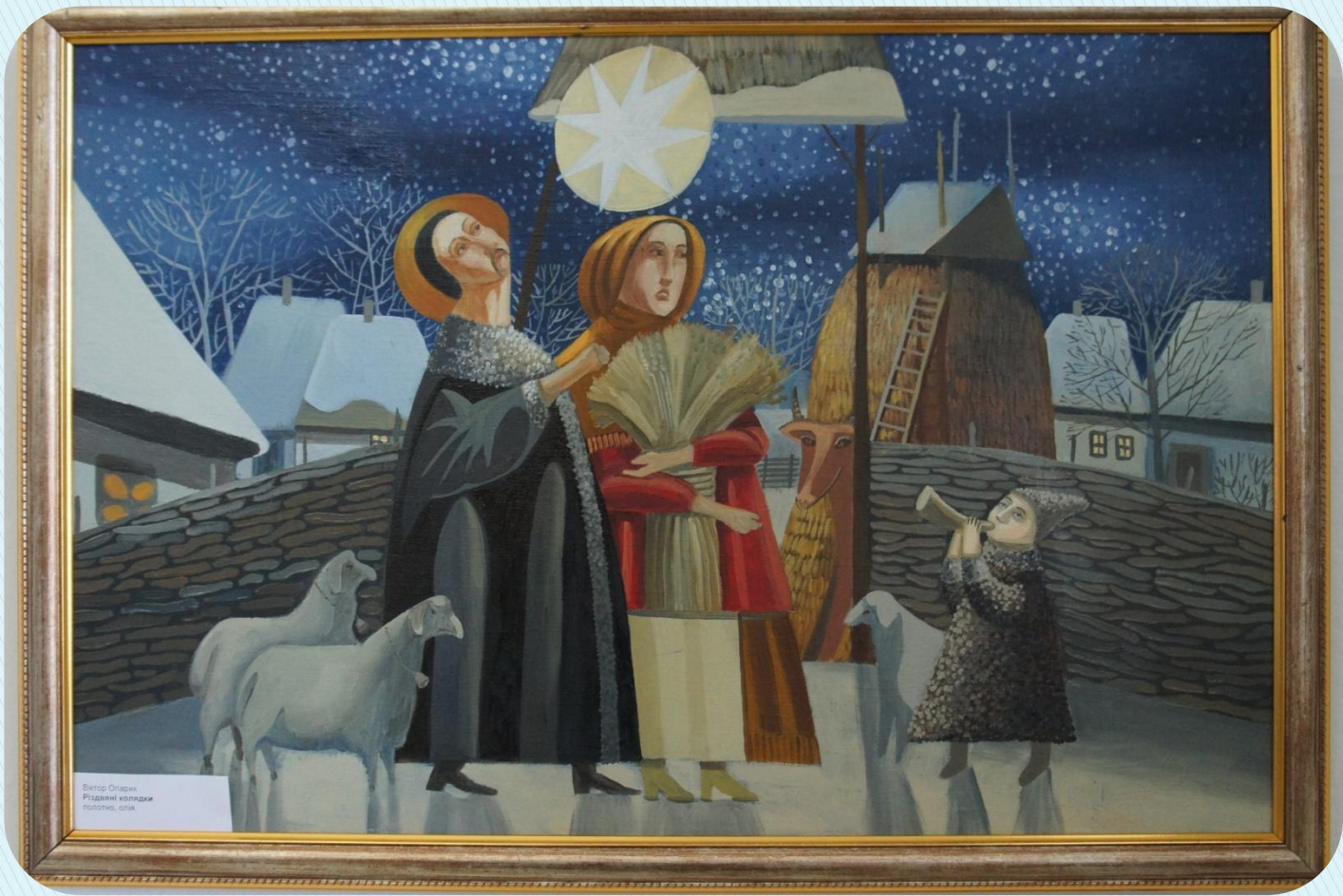
Віктор Сліарук Рідзінні комеджі полотно, олія