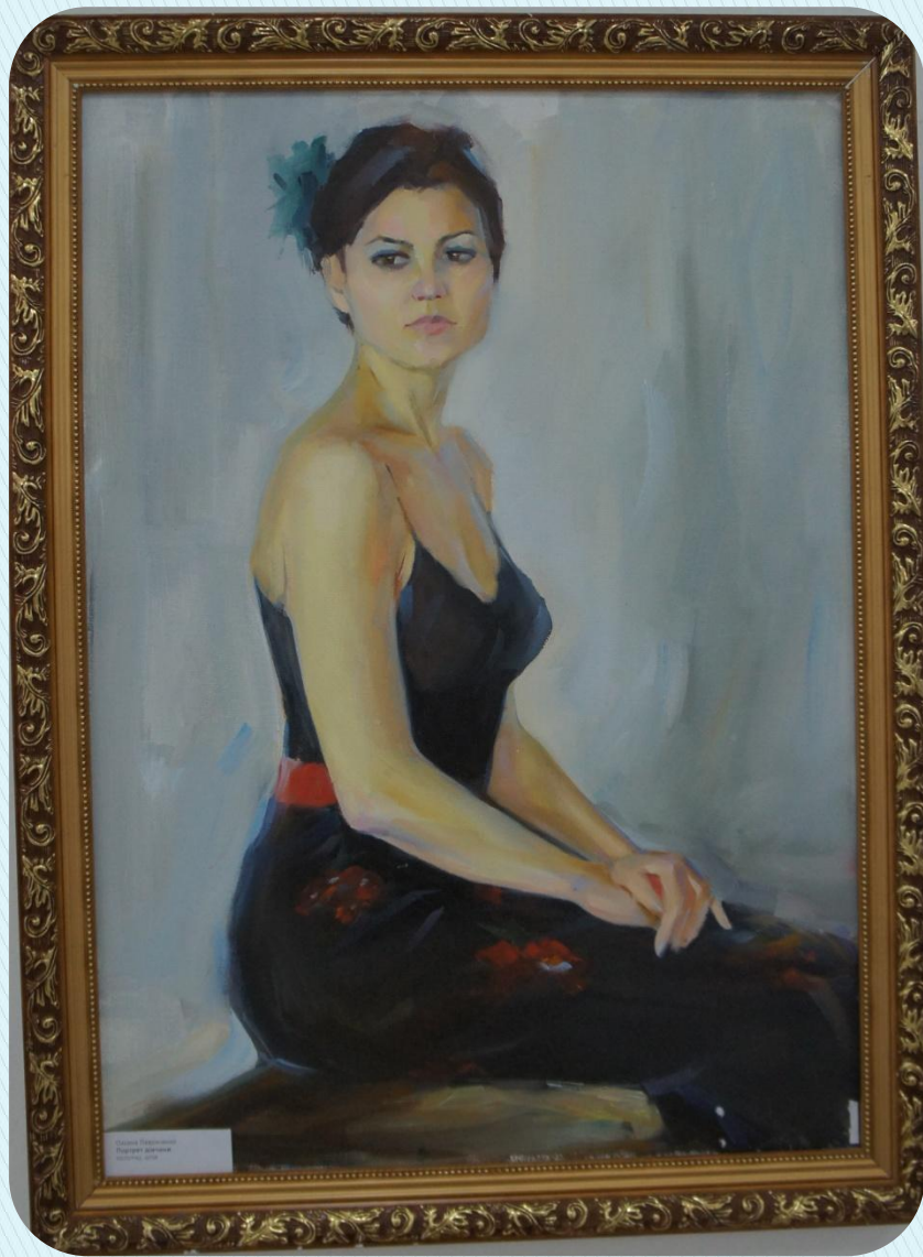
Giuseppe Penone Donna per sempre 1970