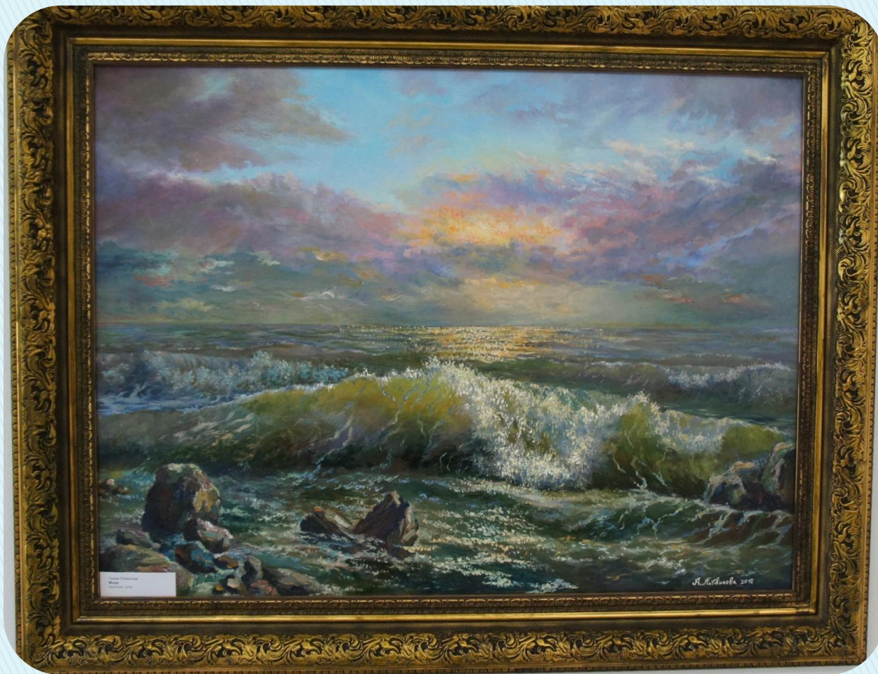
Small white label with illegible text, likely a museum identification tag.