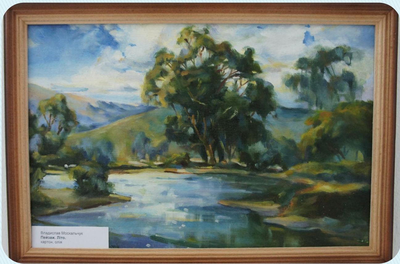
Владислав Москальчук Пейзаж. Літо, картон, олія