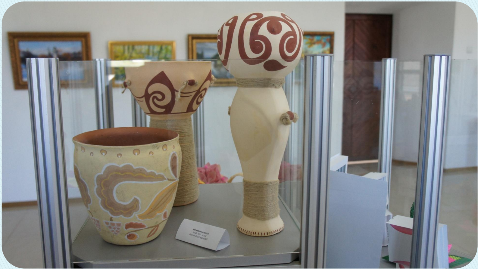
КЕРАМИКА АКТИВ - КС ДИЗАЙНЕРСКИЙ