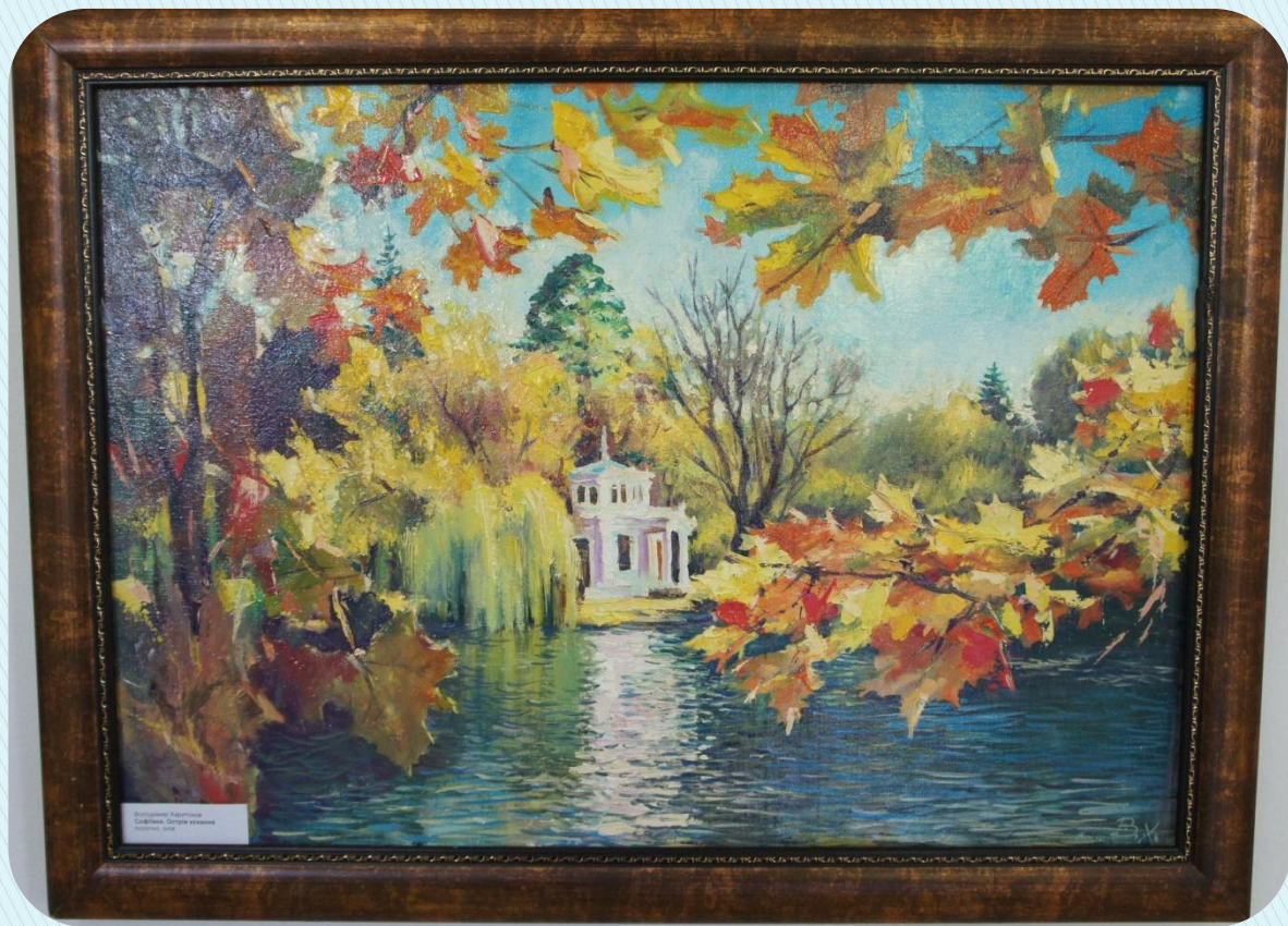
Autumn in the Park Cardiff, Cardiff, Wales 1900