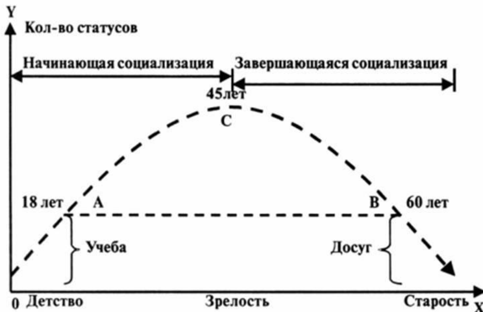
Рис. 6.2. Основные фазы социализации

На рис. 6.2 обозначены три кризисные точки в жизни человека: А – окончание средней школы и подготовка к поступлению в вуз или поиск работы, С – кризис середины жизни, В – выход на пенсию и переход к пассивной части социализации. Это период активной социализации, ограниченный тремя кризисными точками.