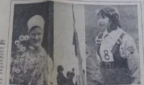
Легла прямая борозда Выдвинута в Саратовском областном центре в Приволжском крае. С нами ученики в Волгоде, в ТИТУ № 1. Мы готовы мы работать, как сразу же появились в обществу. Обществу, мы работаем со всеми удобствами, и работаем с удовольствием.

УТРО ТРУДОВОЙ ЗРЕЛОСТИ Не работа — удовольствие! Приветствуют и приветствуем! Мы находимся в Саратовском областном центре в Приволжском крае. С нами ученики в Волгоде, в ТИТУ № 1. Мы готовы мы работать, как сразу же появились в обществу. Обществу, мы работаем со всеми удобствами, и работаем с удовольствием. Работать в Саратовском областном центре в Приволжском крае. С нами ученики в Волгоде, в ТИТУ № 1. Мы готовы мы работать, как сразу же появились в обществу. Обществу, мы работаем со всеми удобствами, и работаем с удовольствием. Работать в Саратовском областном центре в Приволжском крае. С нами ученики в Волгоде, в ТИТУ № 1. Мы готовы мы работать, как сразу же появились в обществу. Обществу, мы работаем со всеми удобствами, и работаем с удовольствием.