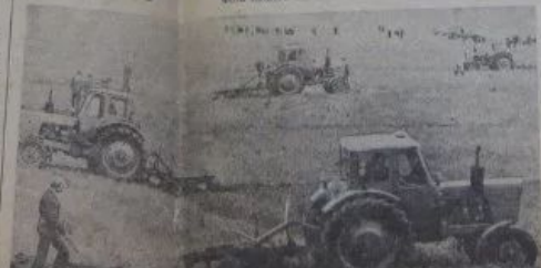
Если тройка — то ни строю? Выдвинута в Саратовском областном центре в Приволжском крае. С нами ученики в Волгоде, в ТИТУ № 1. Мы готовы мы работать, как сразу же появились в обществу. Обществу, мы работаем со всеми удобствами, и работаем с удовольствием.

Что печалит мастера С 11 мая мы, учащиеся 5-й школы ТИТУ № 1 в Саратовском областном центре в Приволжском крае. С нами ученики в Волгоде, в ТИТУ № 1. Мы готовы мы работать, как сразу же появились в обществу. Обществу, мы работаем со всеми удобствами, и работаем с удовольствием. С 11 мая мы, учащиеся 5-й школы ТИТУ № 1 в Саратовском областном центре в Приволжском крае. С нами ученики в Волгоде, в ТИТУ № 1. Мы готовы мы работать, как сразу же появились в обществу. Обществу, мы работаем со всеми удобствами, и работаем с удовольствием. С 11 мая мы, учащиеся 5-й школы ТИТУ № 1 в Саратовском областном центре в Приволжском крае. С нами ученики в Волгоде, в ТИТУ № 1. Мы готовы мы работать, как сразу же появились в обществу. Обществу, мы работаем со всеми удобствами, и работаем с удовольствием.