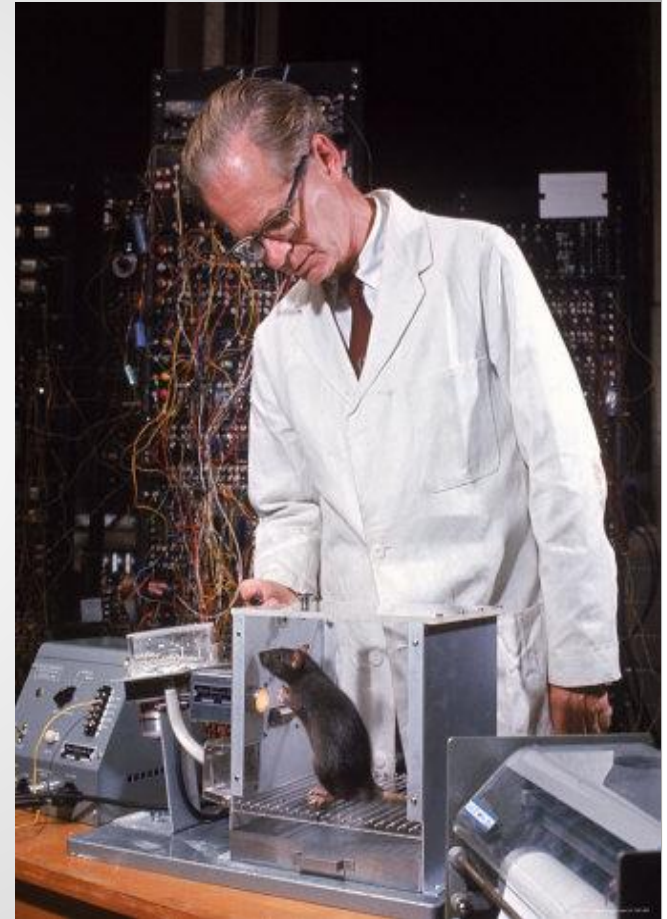
Беррес Фредерик Скиннер (1904- 1990)

Используя подкрепления, можно научиться делать то, что оправдывает наши усилия, приносит удовлетворение, вызывает социальное одобрение, а также добиться прекращения того, что влечет за собой нежелательные последствия