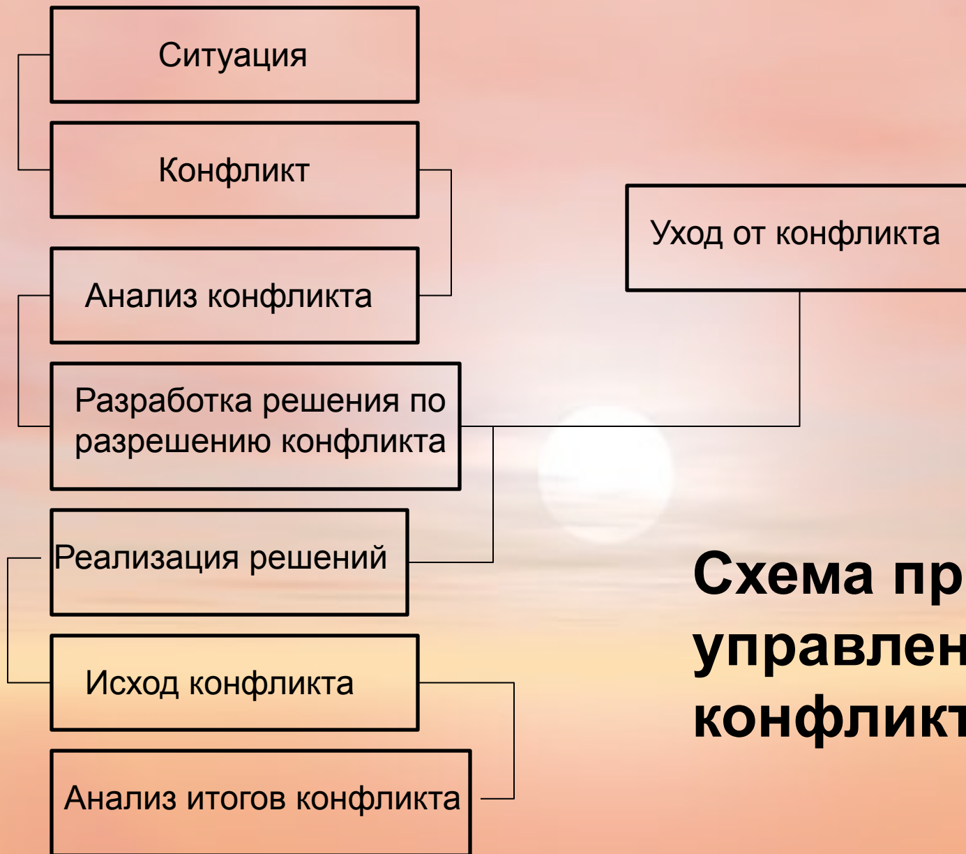
Схема процесса управления конфликтами