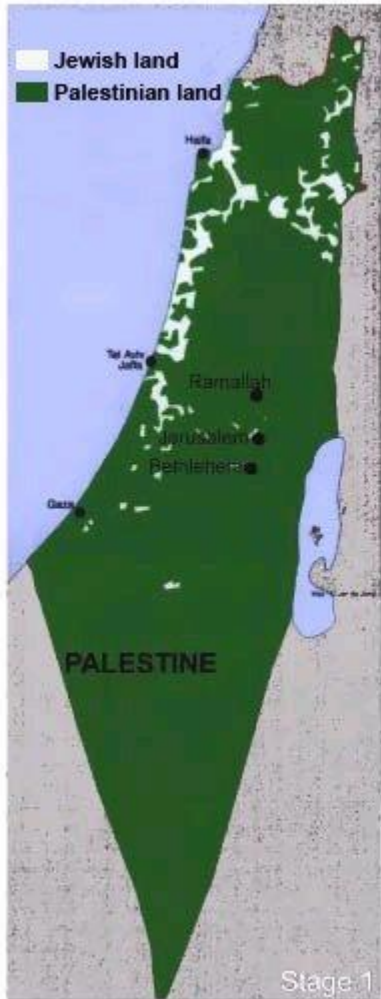
Palestinian and Jewish land 1946