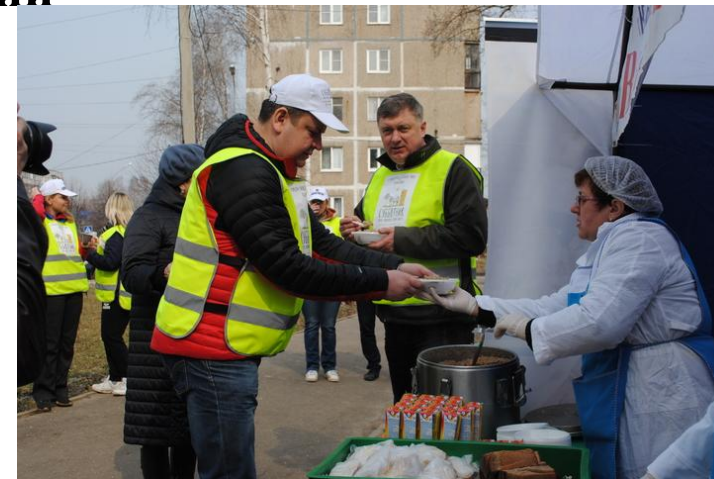
г.о. Павловский Посад