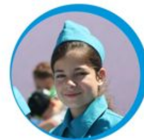
Юные инспекторы движения