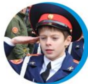
Юные помощники полиции