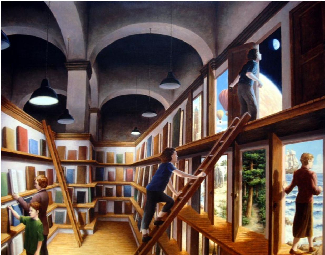
Written Worlds - Rob Gonsalves