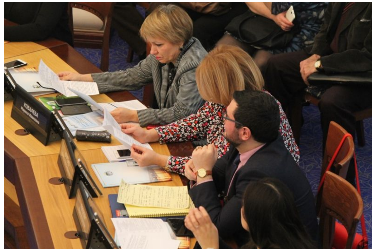
Форум «Особенности реализации молодежной политики в вопросах профилактики экстремизма в г. Новосибирск»