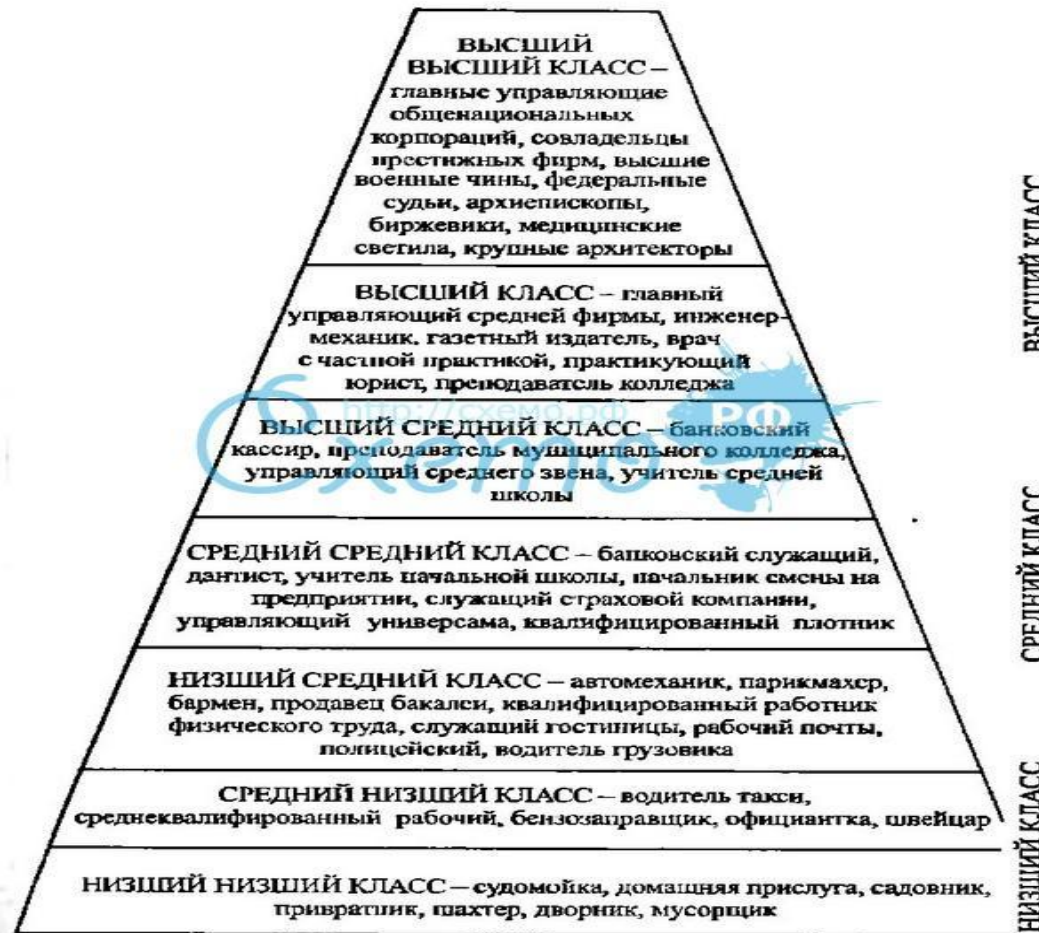
Американский вариант социальной стратификации