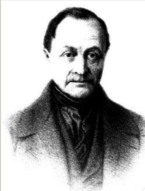
Огюстом Контом (1798-1857)

Термин введен Огюстом Контом (1798-1857) французским философом. Понятие «социология» является производным от двух слов: латинского soci (etas) – общество и греческого logos – слово, учение. Следовательно социология- наука об обществе