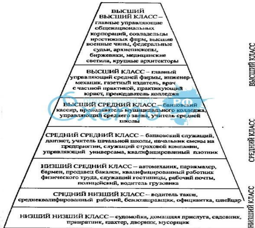
Американский вариант социальной стратификации