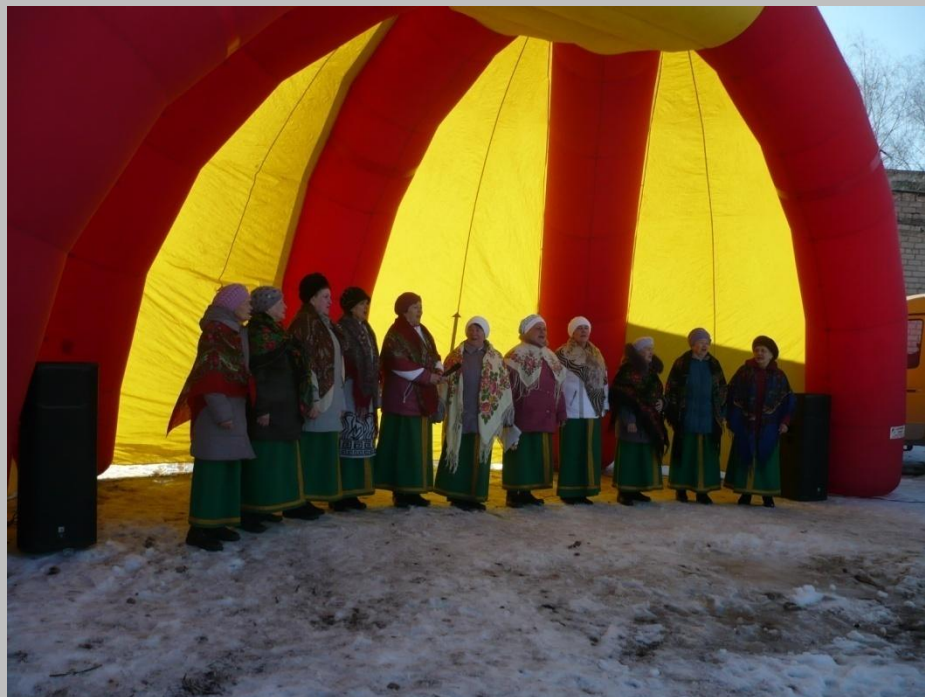
Хор "Уралочка" грамот