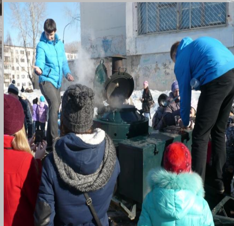
Каша и чай