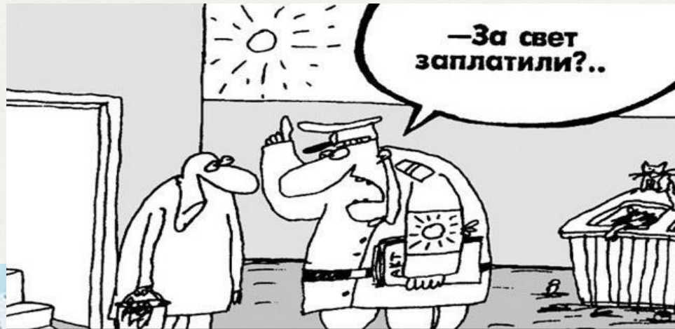
Социальная норма потребления электроэнергии в Ростовской области

0 Конфликт с внешней средой - ситуация, когда индивиды, составляющие группу, испытывают давление извне (прежде всего, со стороны культурных, административных, экономических норм и предписаний).