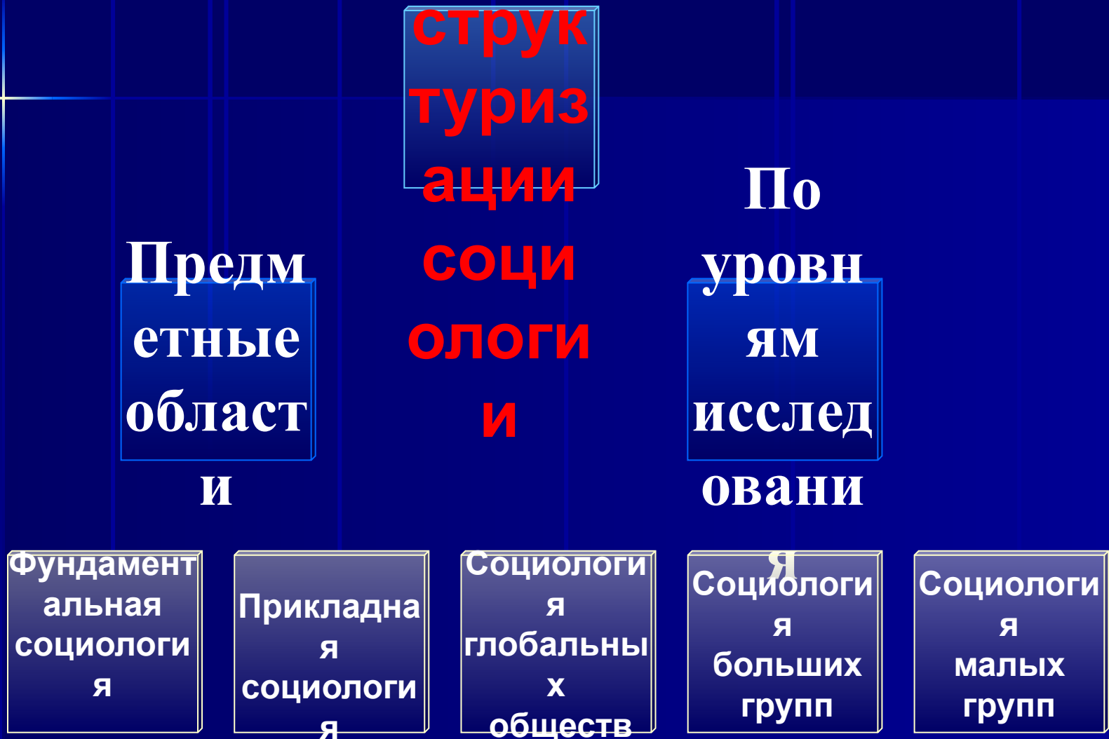
Схема 1. Структура социологии