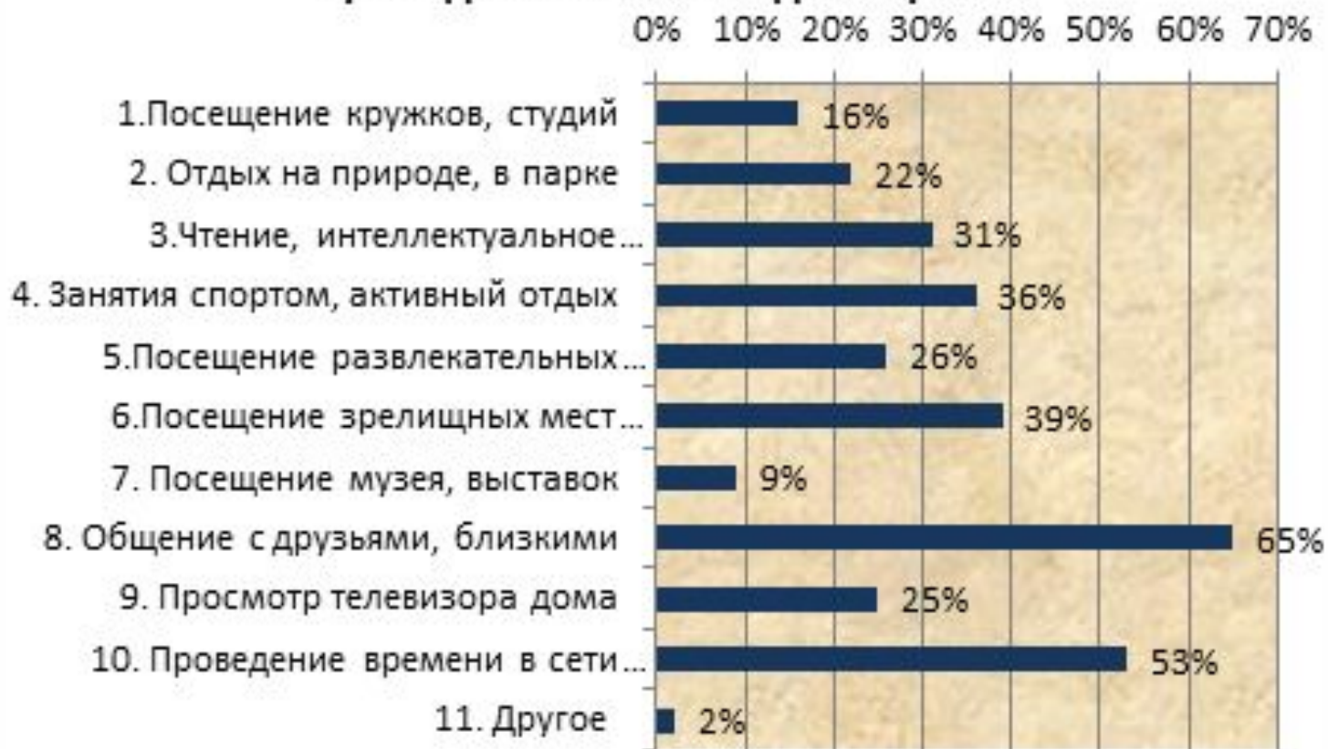
Диаграмма №9. Каким образом Вы чаще всего проводите свое свободное время?

Общение с друзьями и близкими – самое популярное проведение досуга, так отметили 65%