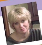
АВТОР ПРОЕКТА: Светлана Юрьевна Попова (Смолик)