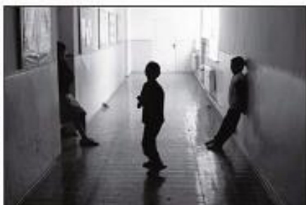
Роблячи спілкування, друзів, мілітарного життями, хто європейське в стилі інтернетного життя

По-доброму завжди працює свій медіапростір з Кам'янець-Подільської школи-інтернату №2, коли почали, що мислять