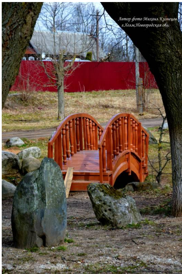
Автор фото Михаил Кузнецов, г. Холм, Новгородская обл.