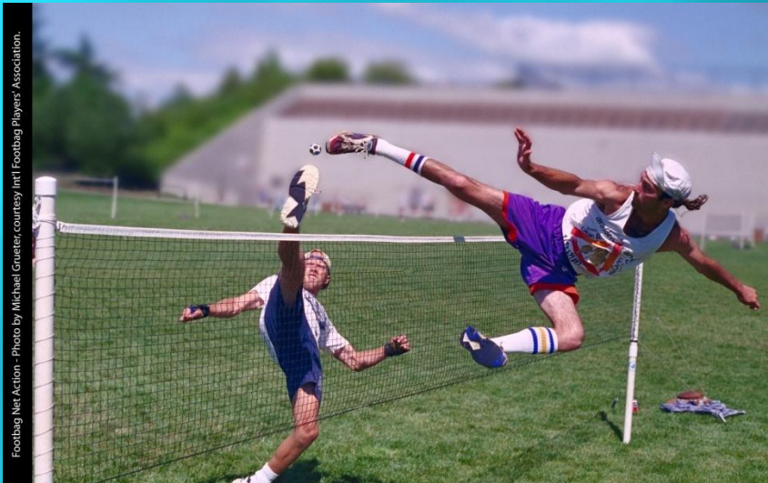
Footbag Net Action - Photo by Michael Grueter, courtesy Int'l Footbag Players' Association.

Футбэг (от англ. foot — нога и bag — мешок) — небольшой мяч, также называемый коротко — бэг, различные вариации которого используются в ряде игр. Футбэг Нет-гейм или Volley Sock (сокс) комбинирует элементы тенниса, бадминтона и волейбола. Нет-гейм играют поодиночке или парами. Игроки перекидывают мяч через 5-футовую (~150 см) сетку, причем касания производятся только ногой ниже колена. Расположение и размеры корта похожи на таковой в бадминтоне. Подсчет очков схож со старой системой, использовавшейся в волейболе (очко засчитывается только при подаче). Игра идет до 11 или 15 очков, при этом разница должна составлять минимум 2 очка. В одиночной игре участник имеет право сделать подряд 2 касания футбэга, причем только на своей стороне площадки. В парной игре разрешено 3 касания на команду, причем касания игроков должны чередоваться. Профессиональные игроки имеют в своем арсенале множество сложных, непредсказуемых ударов, зачастую выполняющихся в воздухе.