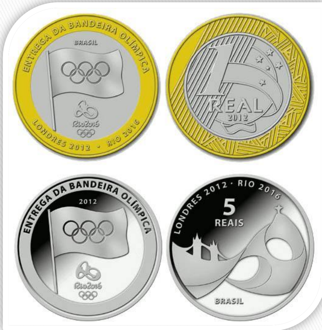
Монеты 1 и 5 РЕАЛОВ – БРАЗИЛИЯ 2012 Олимпиада в Рио-де-Жанейро 2016