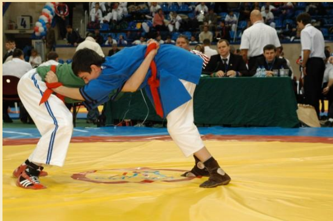
Борьба на поясах