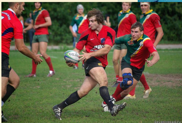
Регби - 7