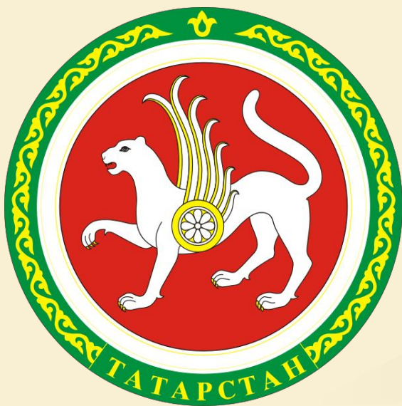
Государственный герб Татарстана

Девиз казанской Универсиады - «You are the World». Так как базовая эмблема Универсиады представляет собой латинскую букву U, то используется следующий вариант написания: «U are the World». Он позволяет трактовать слоган в двух значениях: «Ты - это мир» и «Универсиада - это целый мир».