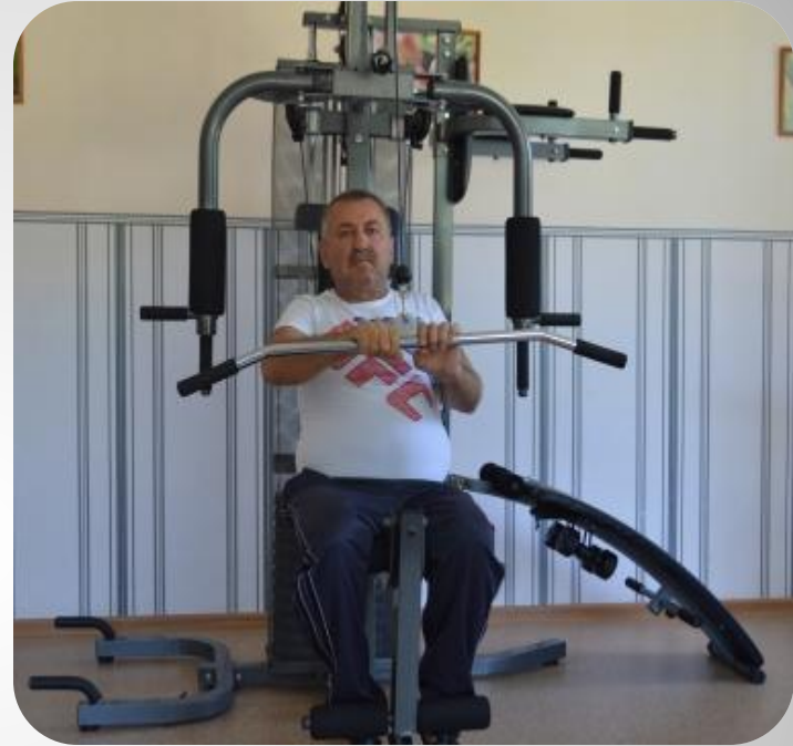
Занятия на многофункциональном силовом тренажере