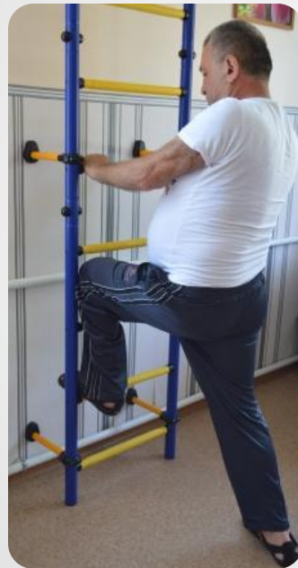
Упражнения около шведской стенки