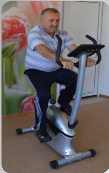
Езда на велосипеде