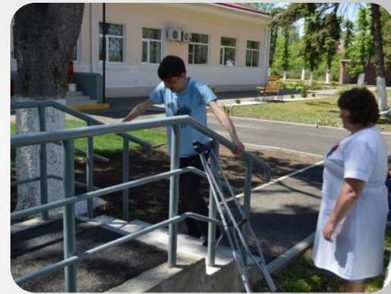
Дозированное восхождение (терренкур)