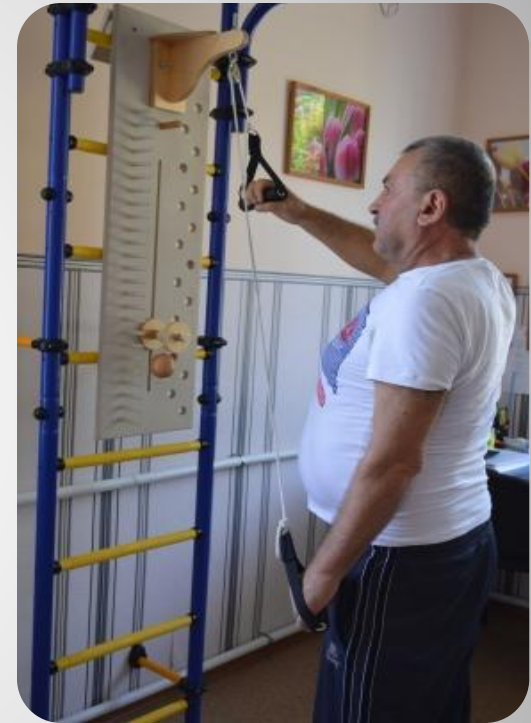
Многофункциональный тренажер для верхних конечностей (модель 5026)