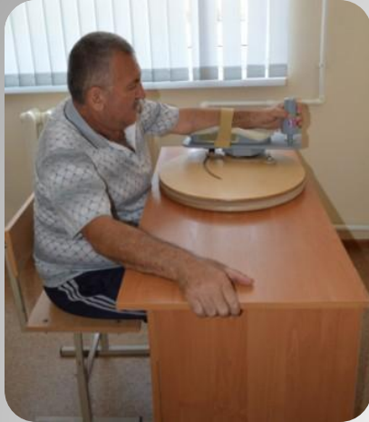
Тренажер разработки верхних конечностей (модель 5023)