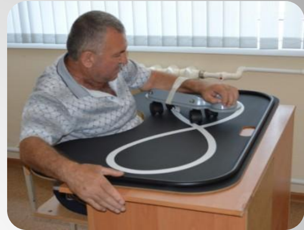
Механотерапевтический комплекс (модель 5267)