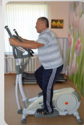
Ходьба на эллиптическом тренажере

Занятия на тренажёрах помогают получателям социальных услуг восстановить функции мозга и двигательного аппарата, укрепить сердечнососудистую, дыхательную системы организма