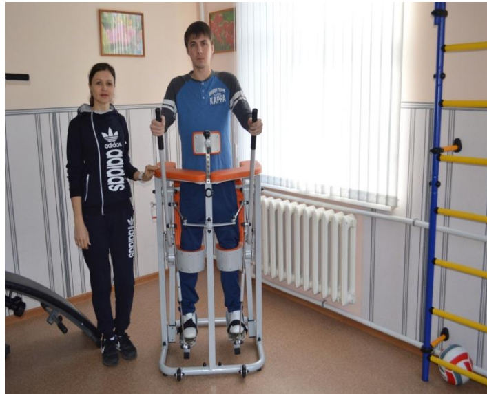
Имитатор ходьбы Имитрон