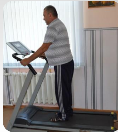
Ходьба на беговой дорожке

Занятия на тренажёрах помогают получателям социальных услуг восстановить функции мозга и двигательного аппарата, укрепить сердечнососудистую, дыхательную системы организма