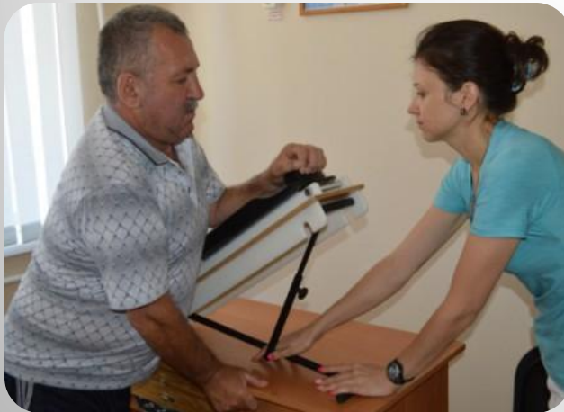
Прибор для разработки плечевого и локтевого суставов с возрастающим сопротивлением (модель 5262)