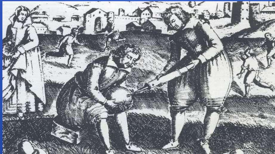
Игра в паллы была предшественницей футбола.