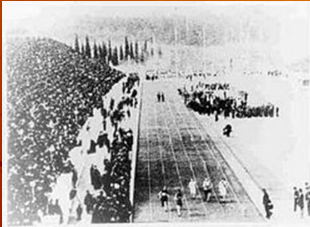
Финал в беге на 100 м. Олимпийские игры

В 1960 г. в Риме наши спортсмены впервые за всю историю Олимпийских игр нанесли поражение американским легкоатлетам. Эта победа над командой США навсегда вошла в историю легкой атлетики как выдающееся достижение советского спорта. За период с 1958 по 1967 г. советские легкоатлеты в семи матчах СССР-США шесть раз одерживали победу над американцами. Неоднократно сопутствовал успех нашим легкоатлетам и в других матчевых, кубковых встречах и в первенствах Европы