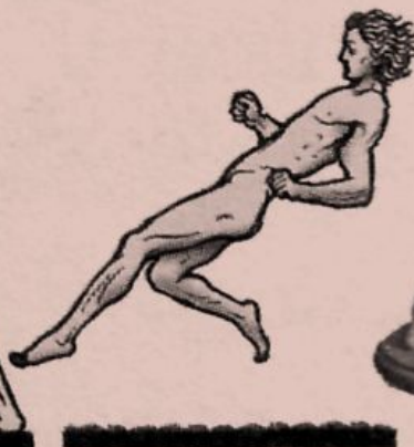
прыжки в длину