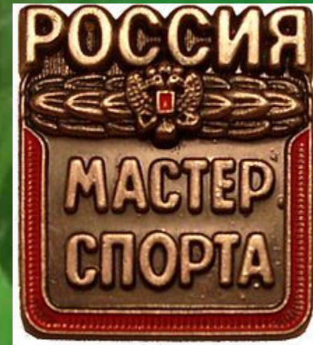
Знак «Мастер спорта России»