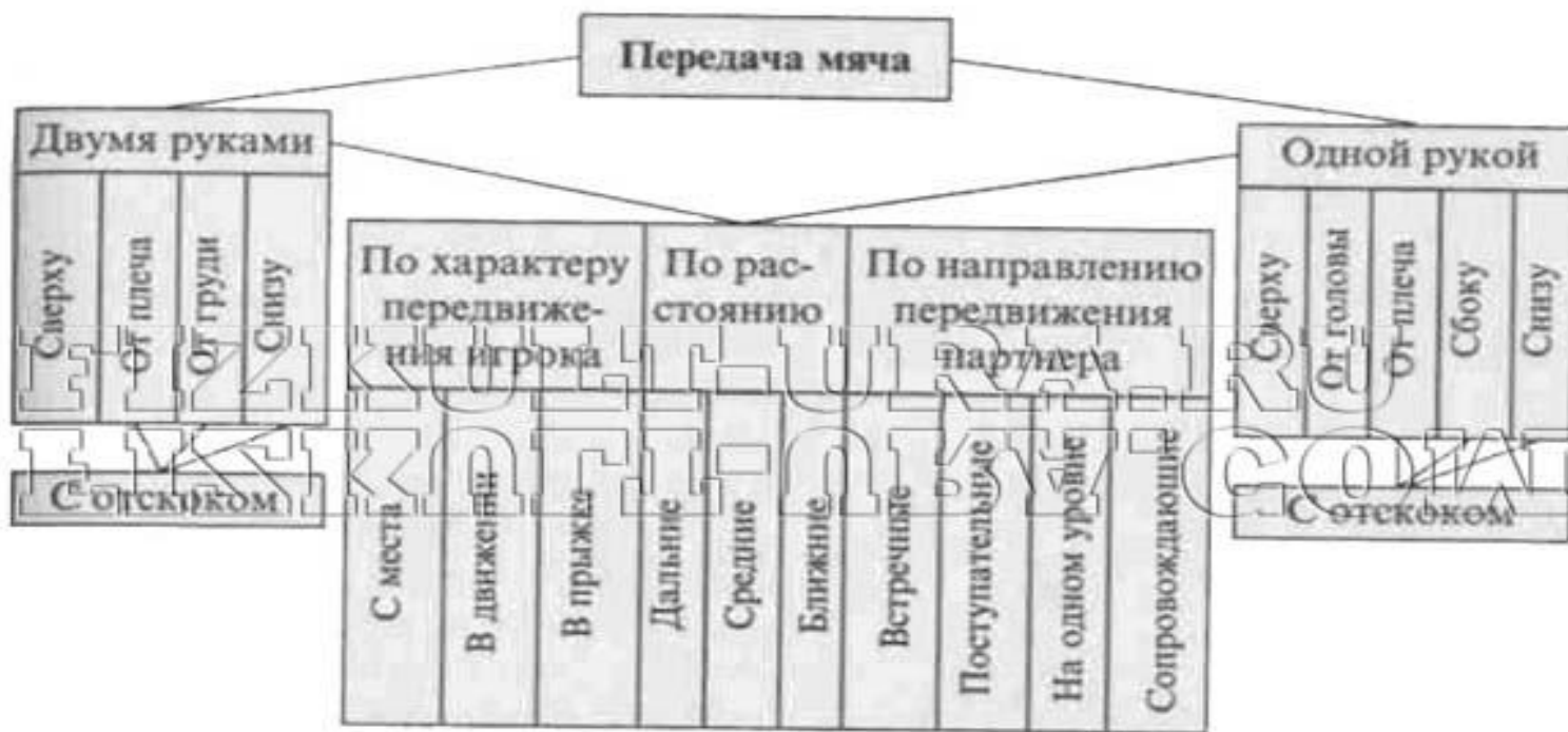
Классификация способов передачи мяча

Передача мяча в баскетболе - прием, с помощью которого игрок направляет мяч партнеру для продолжения атаки. Умение правильно и точно передать мяч - основа четкого, целенаправленного взаимодействия баскетболистов в игре