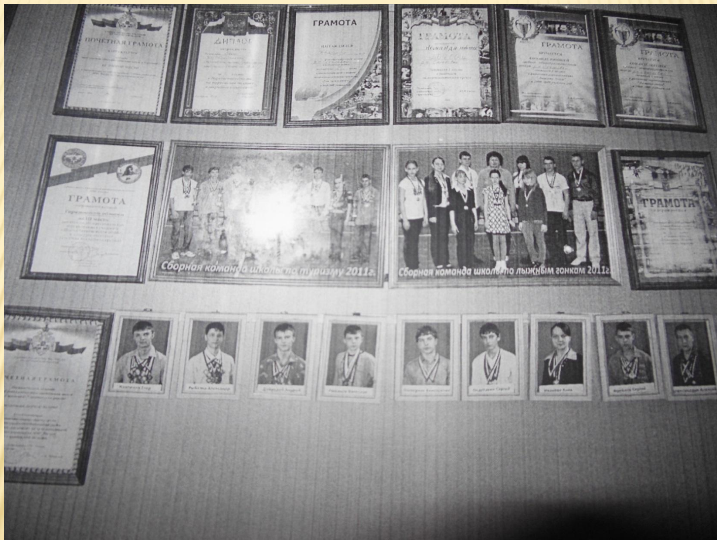
Стенд «Лучшие спортсмены школы»