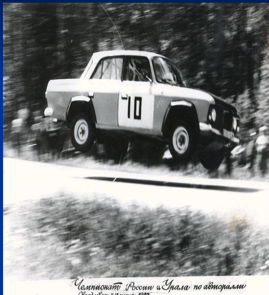
Чемпионат России и Урала по авторалли (Свердловск, 11-12 мая, 1988)