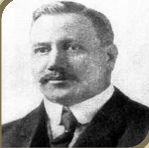
Уильям Дж. Морган

Игры, отдаленно напоминающие волейбол, были известны уже в античные времена. Так, в хрониках 240 до н.э. упоминаются игры римских легионеров, во время которых они перебрасывали друг другу мяч ударами кулака. Похожая игра с надувным мячом была и у древних греков. В свой «волейбол» играли в Японии более трехсот лет назад.