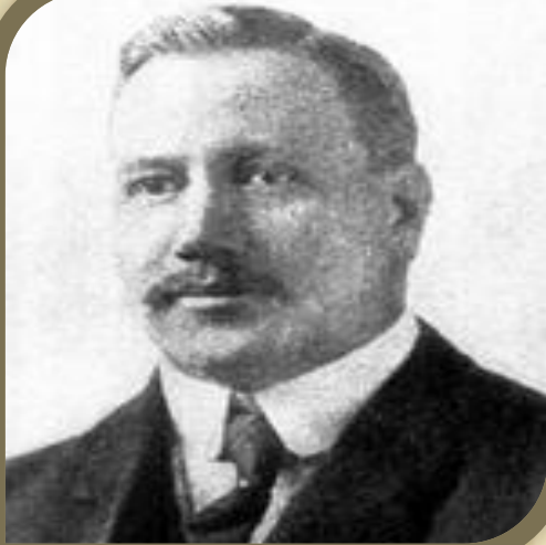
Уильям Дж. Морган

Игры, отдаленно напоминающие волейбол, были известны уже в античные времена. Так, в хрониках 240 до н.э. упоминаются игры римских легионеров, во время которых они перебрасывали друг другу мяч ударами кулака. Похожая игра с надувным мячом была и у древних греков. В свой «волейбол» играли в Японии более трехсот лет назад.