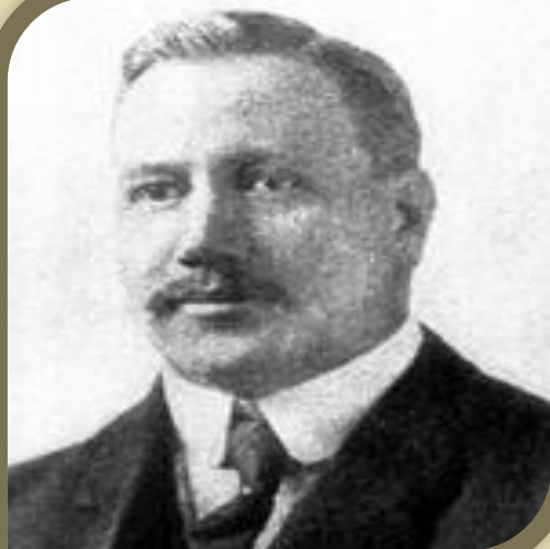
Уильям Дж. Морган

Игры, отдаленно напоминающие волейбол, были известны уже в античные времена. Так, в хрониках 240 до н.э. упоминаются игры римских легионеров, во время которых они перебрасывали друг другу мяч ударами кулака. Похожая игра с надувным мячом была и у древних греков. В свой «волейбол» играли в Японии более трехсот лет назад.