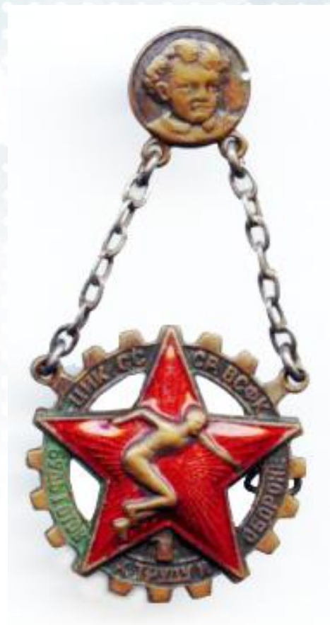
Знак БГТО образца 1934 года