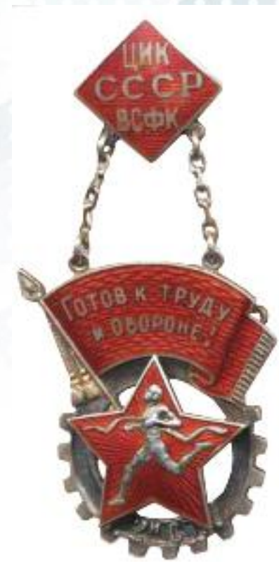
Знак ГТО 1931-1936 годов (2 ступень)

Он состоял из 25 испытаний — 3 теоретических и 22 практических. Для женщин общее количество испытаний составляло 21