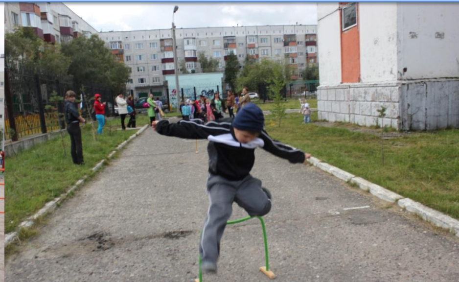
ПРЫЖКИ В ВЫСОТУ