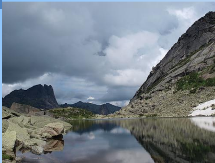
Озеро Горных Духов