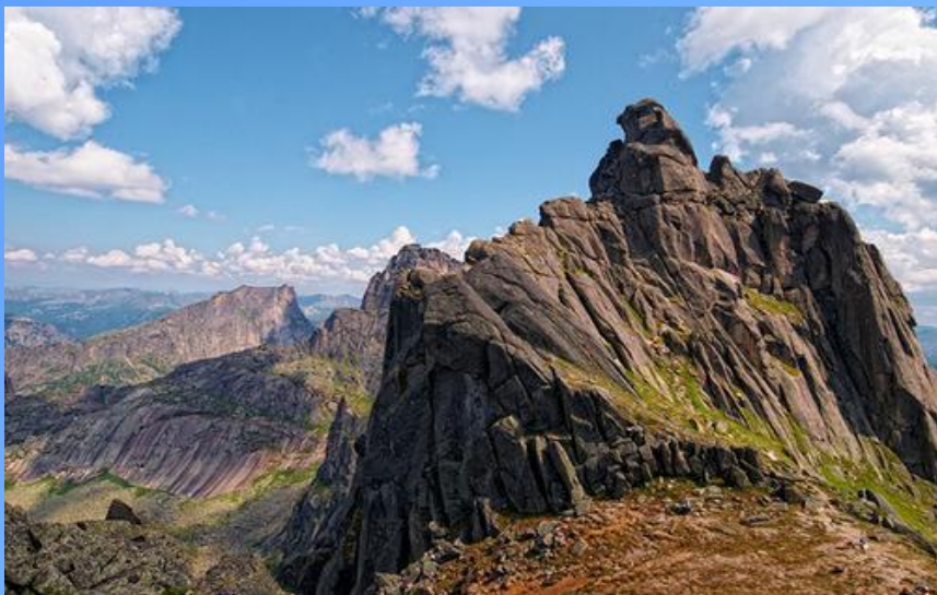
Скала «Пик Птица»