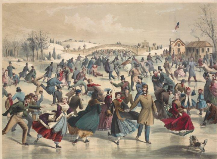
СЕНТРАЛ ПАРК, ВИНТЕР.

На I Конгрессе конькобежцев в 1871 году фигурное катание было признано как вид спорта. В 1882 году в Вене состоялись первые в Европе официальные соревнования по фигурному катанию. Правда первоначально, как отмечает Мишин А. Н., «это были своего рода кулуарные соревнования», так как в них принимало участие всего несколько спортсменов.