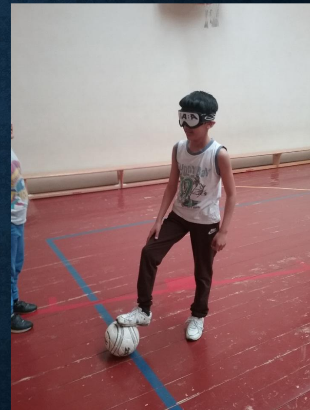
Занятия двигательной активности по мини-футболу