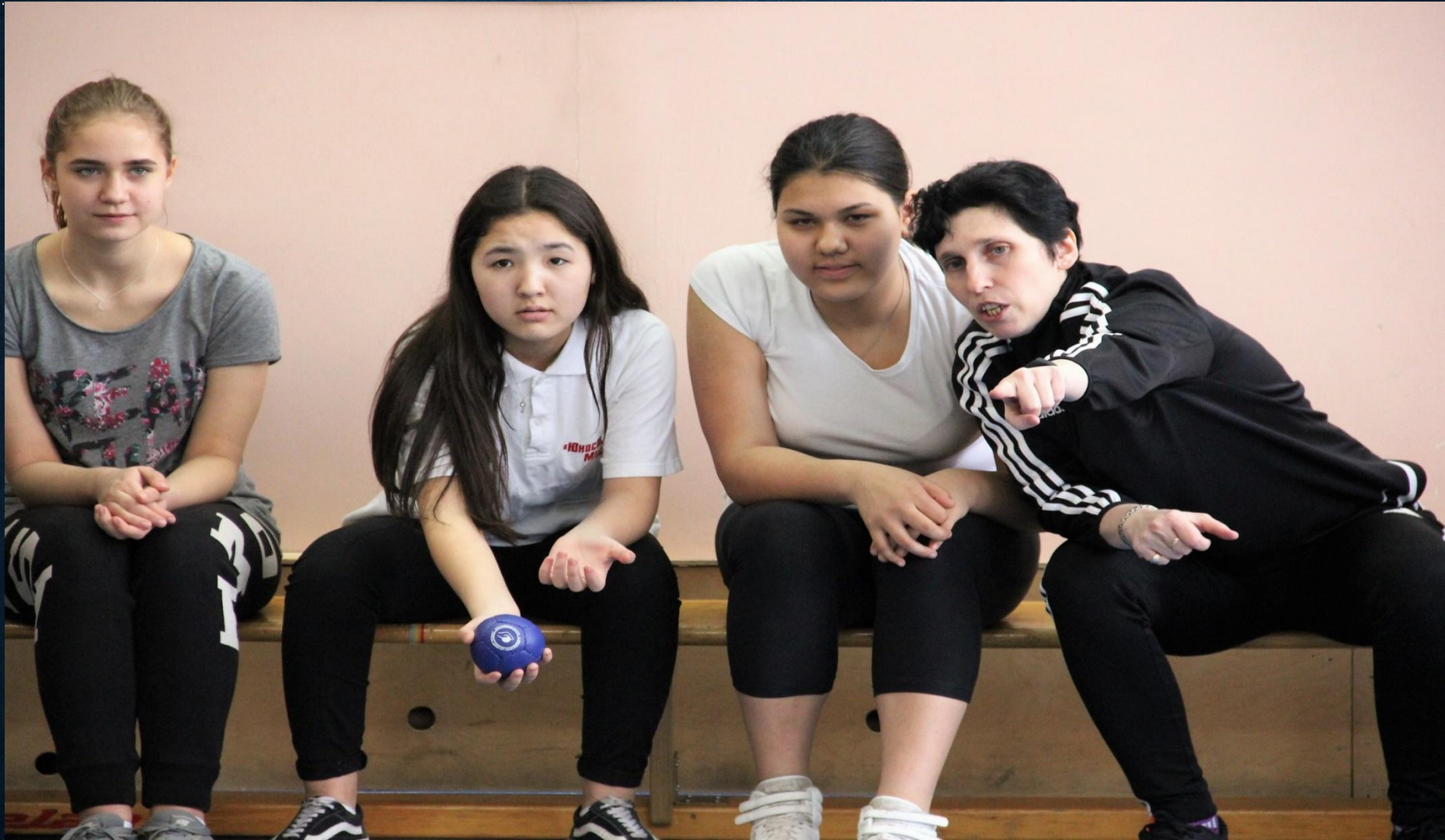
Урок в 8 «Г» классе по игре в бочче