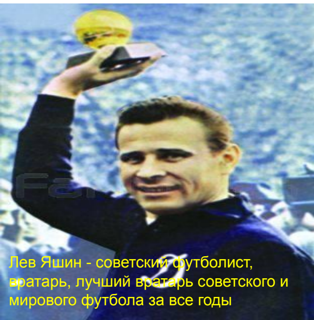
Лев Яшин - советский футболист, вратарь, лучший вратарь советского и мирового футбола за все годы