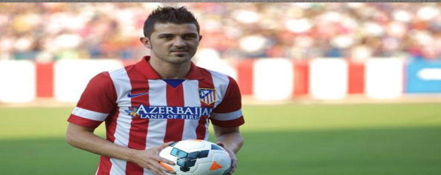
Давид Вилья - испанский футболист, нападающий футбольного клуба «Барселона»