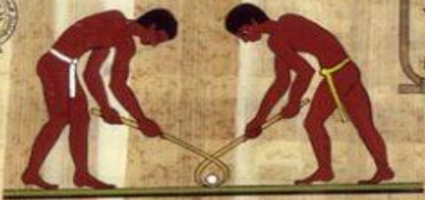
TOMB OF KHETY AT BENI HASSAN 2000 B.C. II AFRICAN CHAMPIONSHIP CAIRO 1963