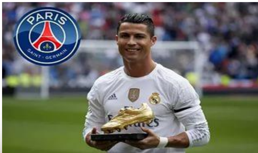
Криштиану Роналду-португальский футболист, считается самым дорогим футболистом мира и одним из лучших футболистов современности