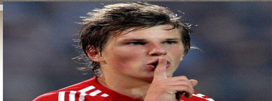
Андрей Аршавин - российский футболист, капитан сборной России