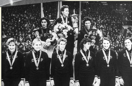
С блеском выступили на первенстве мира советские баскетболистки.