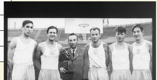
Слава отечественного баскетбола связана с выдающимися игроками нашей страны. Среди них заслуженный мастер спорта и заслуженный тренер Сурен Спандарян, некогда один из лучших игроков страны. Вот он среди своих учеников.